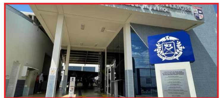
São 275 vagas do 7º ano do ensino fundamental ao 3º ano do ensino médio