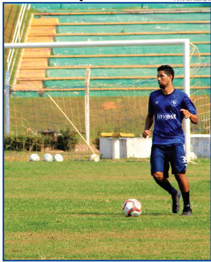
Galo também disputa a Copa Verde, enfrentando o Porto Velho na primeira rodada