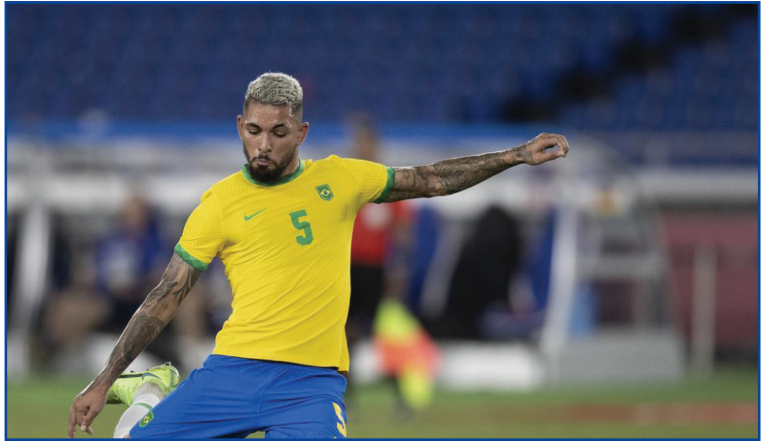
Douglas Luiz, volante da Seleção, em ação nas Olimpíadas

Outra possível novidade é o retorno do goleiro Alisson à meta brasileira. Nas últimas rodadas, sem poder contar com os atletas que atuam na Inglaterra, Tite escalou Weverton.