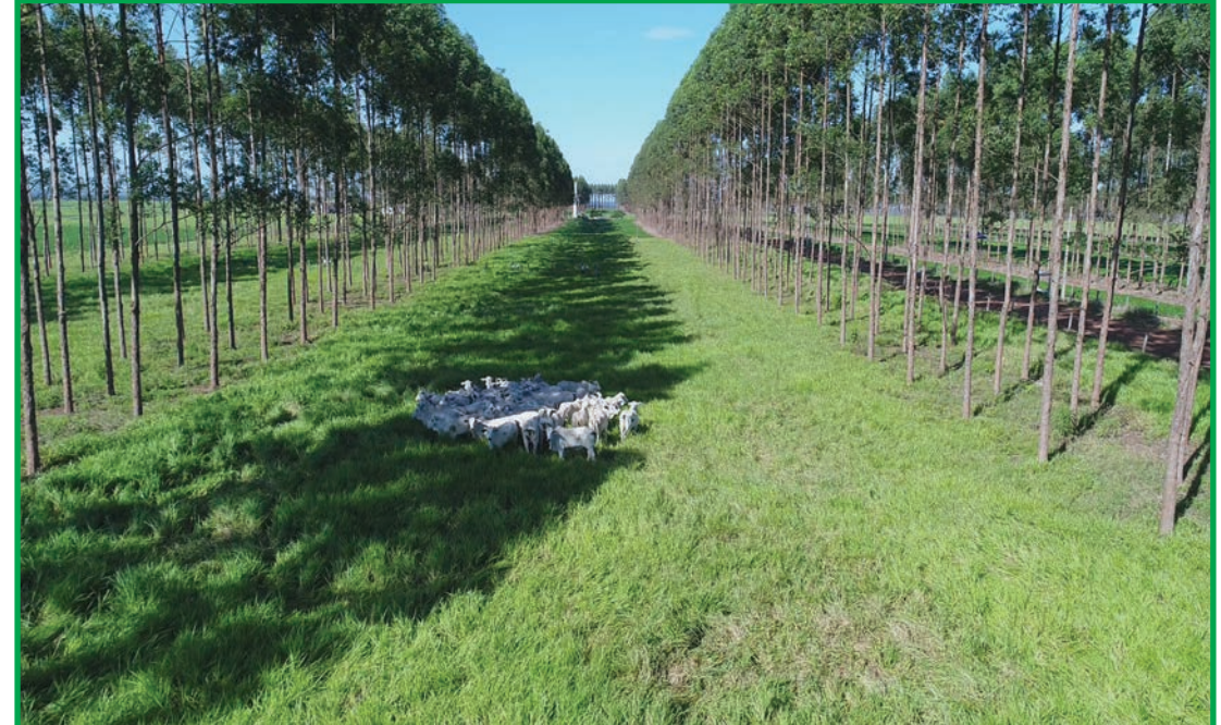
Melhores índices de precocidade sexual de novilhas em sistemas integrados

Outro levantamento feito na pesquisa foi o peso dos bezerros no nascimento. De acordo com os dados coletados, os bezerros nascidos das novilhas dos sistemas silvipastoris e da integração lavoura-pecuária tiveram peso médio sem diferença estatística, entre 34,5 e 35,8kg. Já os bezerros das vacas que ficaram na pastagem em sistema exclusivo nasceram menores,