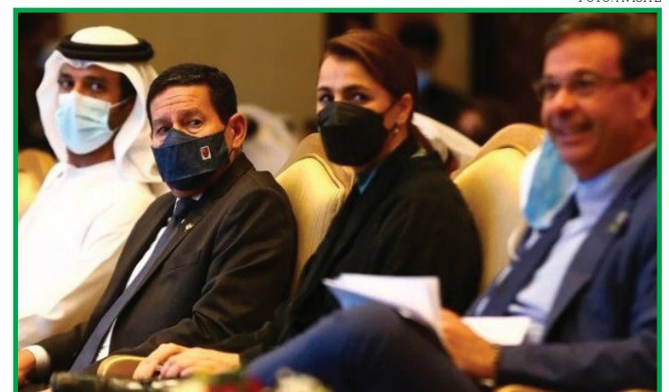
Brasil tem como principal pauta exportadora à nação árabe os alimentos