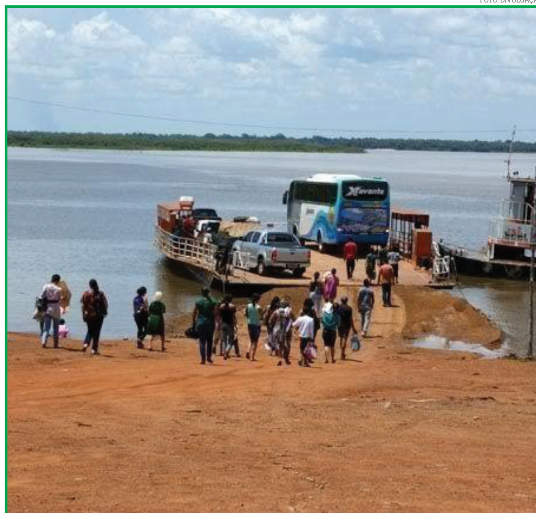
Empresa fará reforma e reparos estruturais

A execução dos serviços é uma demanda de extrema importância, uma vez que a balsa é a única alternativa para a travessia no Rio Xingu, sendo fundamental para o escoamento da produção da região e para a entrada