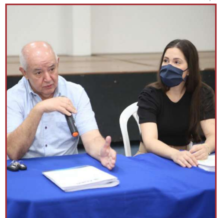
Por enquanto, segue o "não" para o índice de 37,86% da concessionária