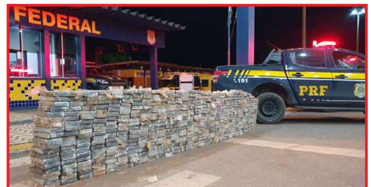
Os motoristas foram dos veículos foram presos