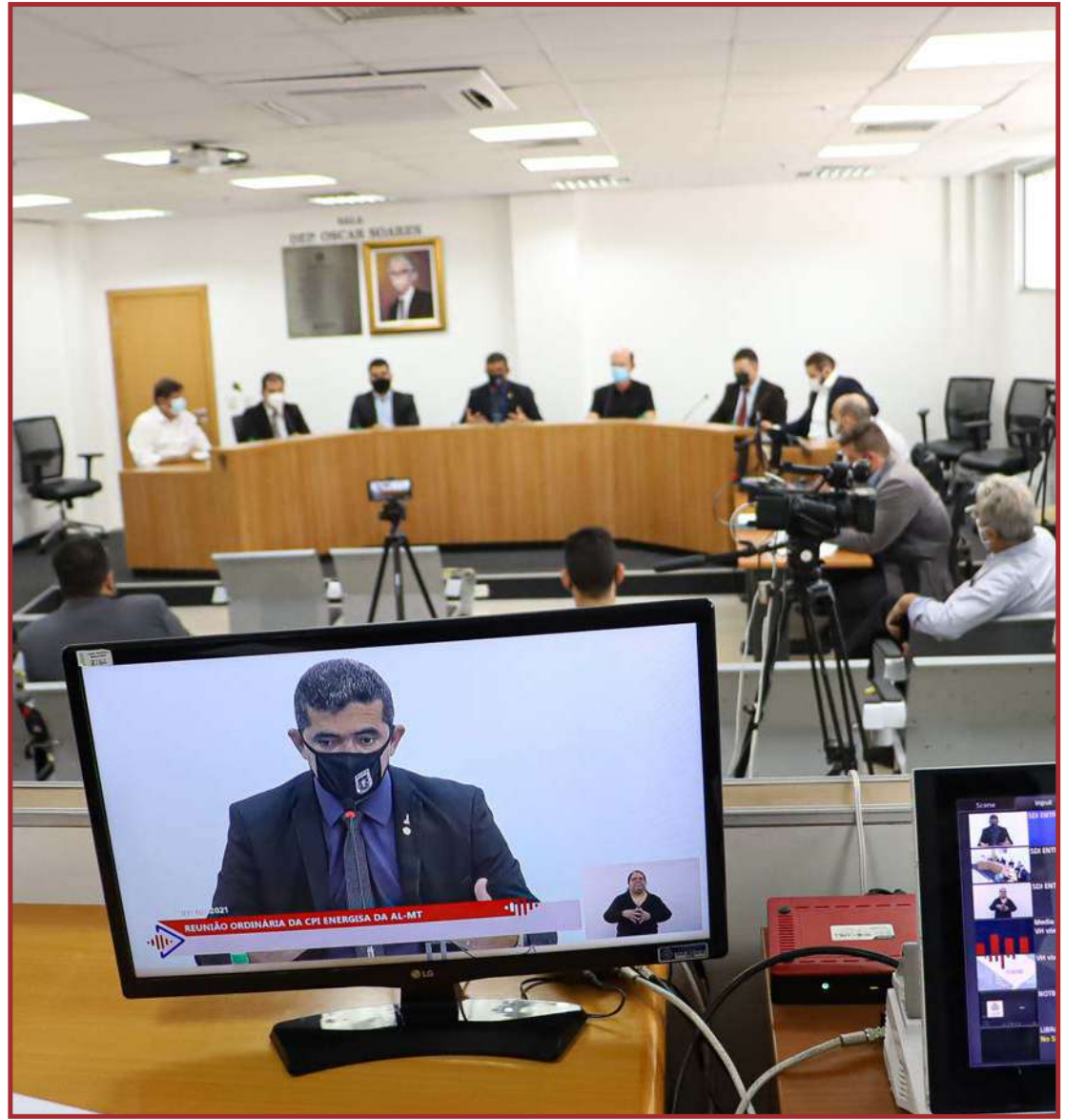
Informações do relatório chegam até o final de novembro

Vale ressaltar que a CPI da Energisa é para investigar quanto ao aumento abusivo nas contas de energia elétrica nos municípios mato-grossenses, bem como o engucamento nos quadros de funcionários e a má prestação dos serviços concessionados. Também participaram os deputados Avallone e Faissal.