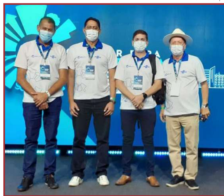
Comitiva esteve no Mato Grosso do Sul para evento do Sebrae

O Plano de Desenvolvimento Econômico, feito em