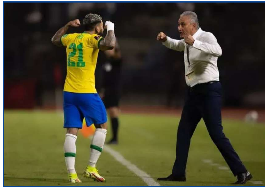
Atacante fez o segundo gol da vitória sobre a Venezuela

O camisa 21 da seleção brasileira não esqueceu do que disse o ex-jogador e publicou em seu Instagram a foto confraternizando com Tite na comemoração. Na legenda? "Pior pessoa", escreveu o jogador do Flamengo.