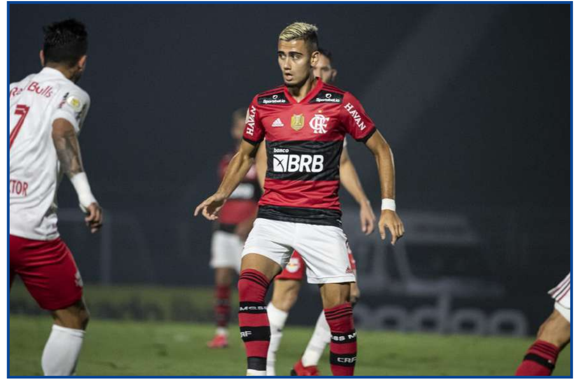
Clube só avançou em reforços após superar metas de receita

- Andreas Pereira foi emprestado pelo Manches-