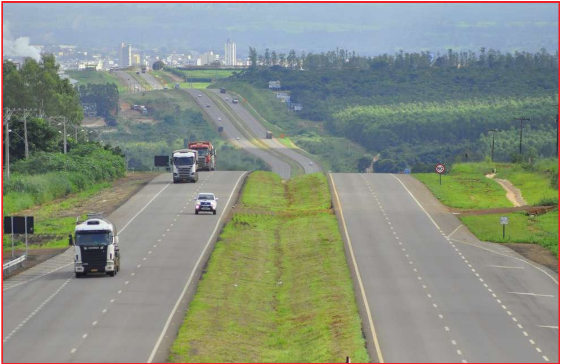
Tráfego na BR-163 em MT

Já na segunda (11) e terça-feira, o ritmo começa a