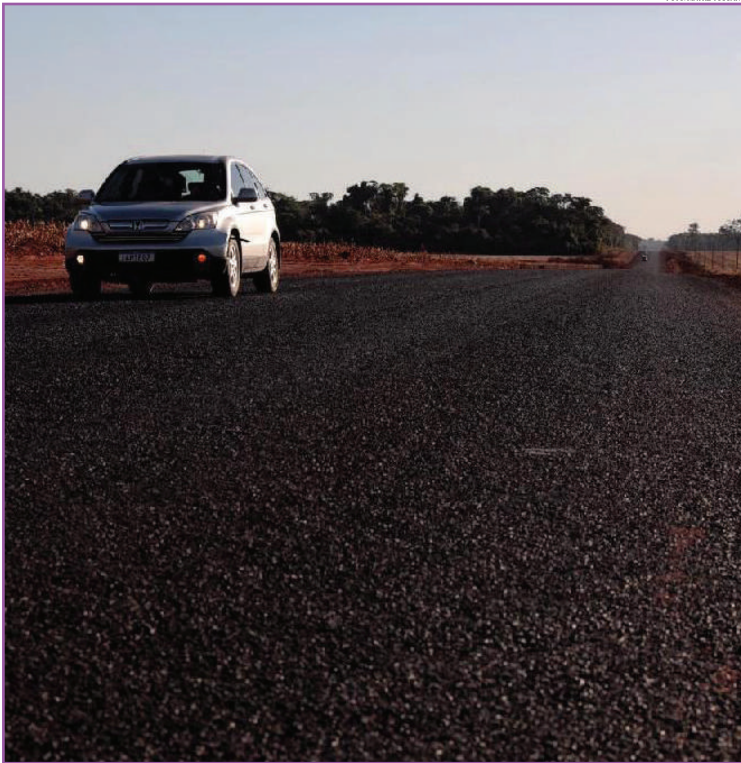
Estado investe em pavimentação de estradas

As obras fazem parte do programa Mais MT, o maior programa de investimentos públicos da história de Mato Grosso, lançado pelo governador Mauro Mendes. Apenas para o eixo de infraestrutura estão previstos R$ 4,73 bilhões em investimentos.