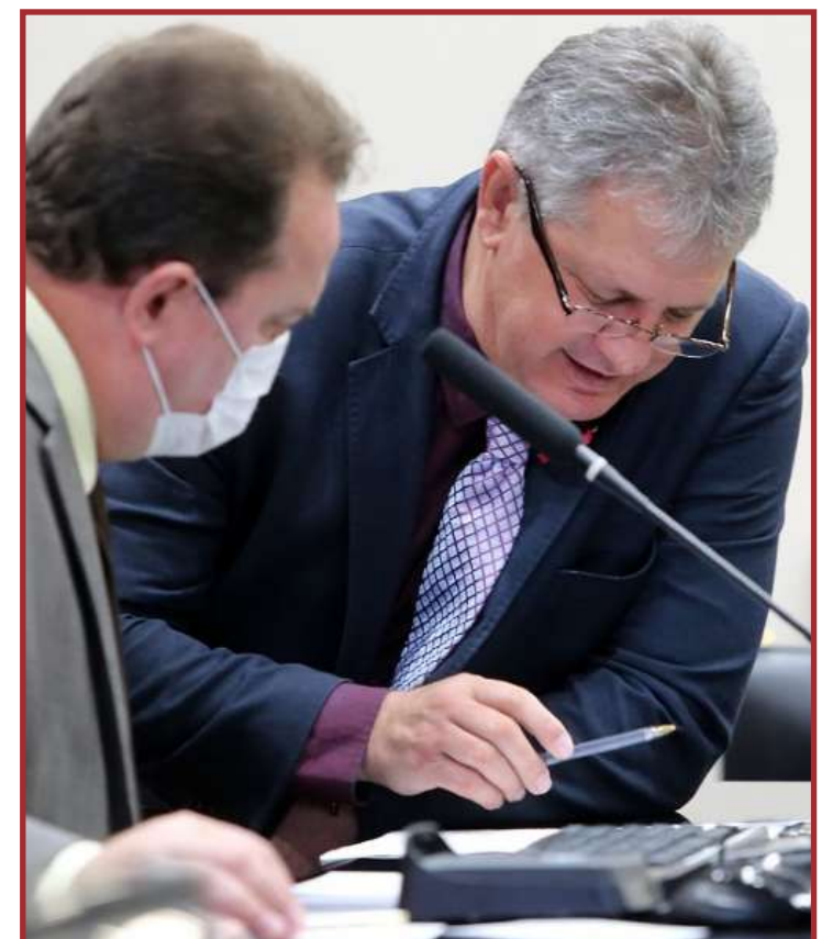
Líder do governo, Dilmar afirma que apenas 35% foram empenhas e 15% pagas