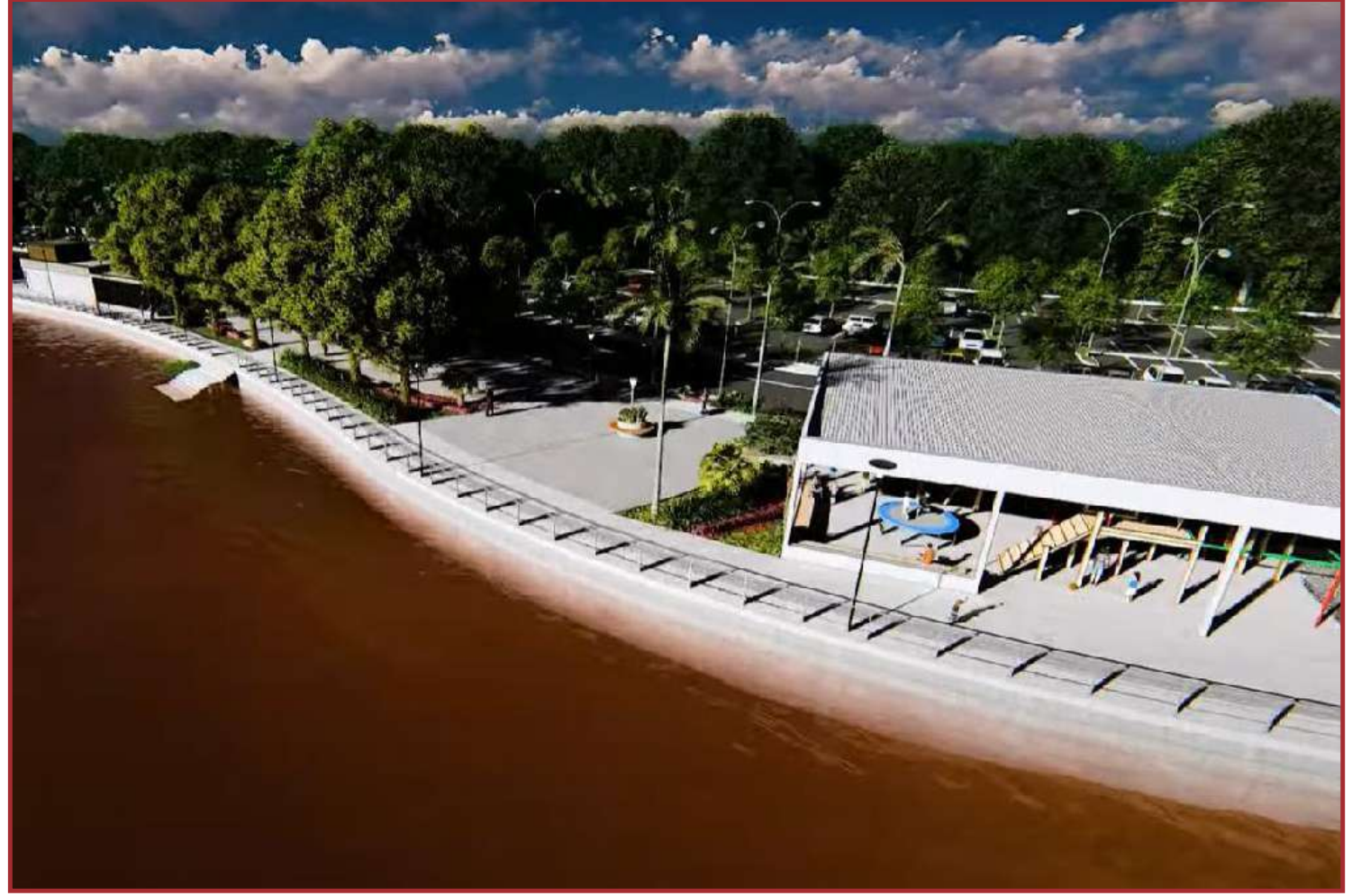
Simulação de como ficará a Orla de Santo Antônio de Leverger

O Governo de Mato Grosso também lançou licitação para construir uma ponte de 140 metros sobre o Rio Cuiabazinho, com 140 metros de extensão, na divisa dos municípios de Nobres e Rosário Oeste. A ponte irá substituir outra de madeira, em uma região de potencial turístico, com cachoeiras, pesqueiros e restaurantes, a aproximadamente 50 quilômetros do distrito de Bom