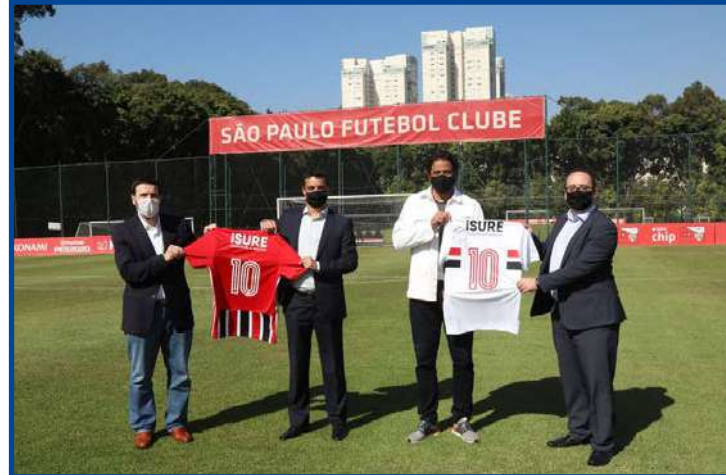
Clube cobra R$ 2,5 milhões da iSure

da iSure registra que Lucas foi questionado sobre quais vantagens teria no negócio, já que os valores não indicavam lucros, e ele teria dito