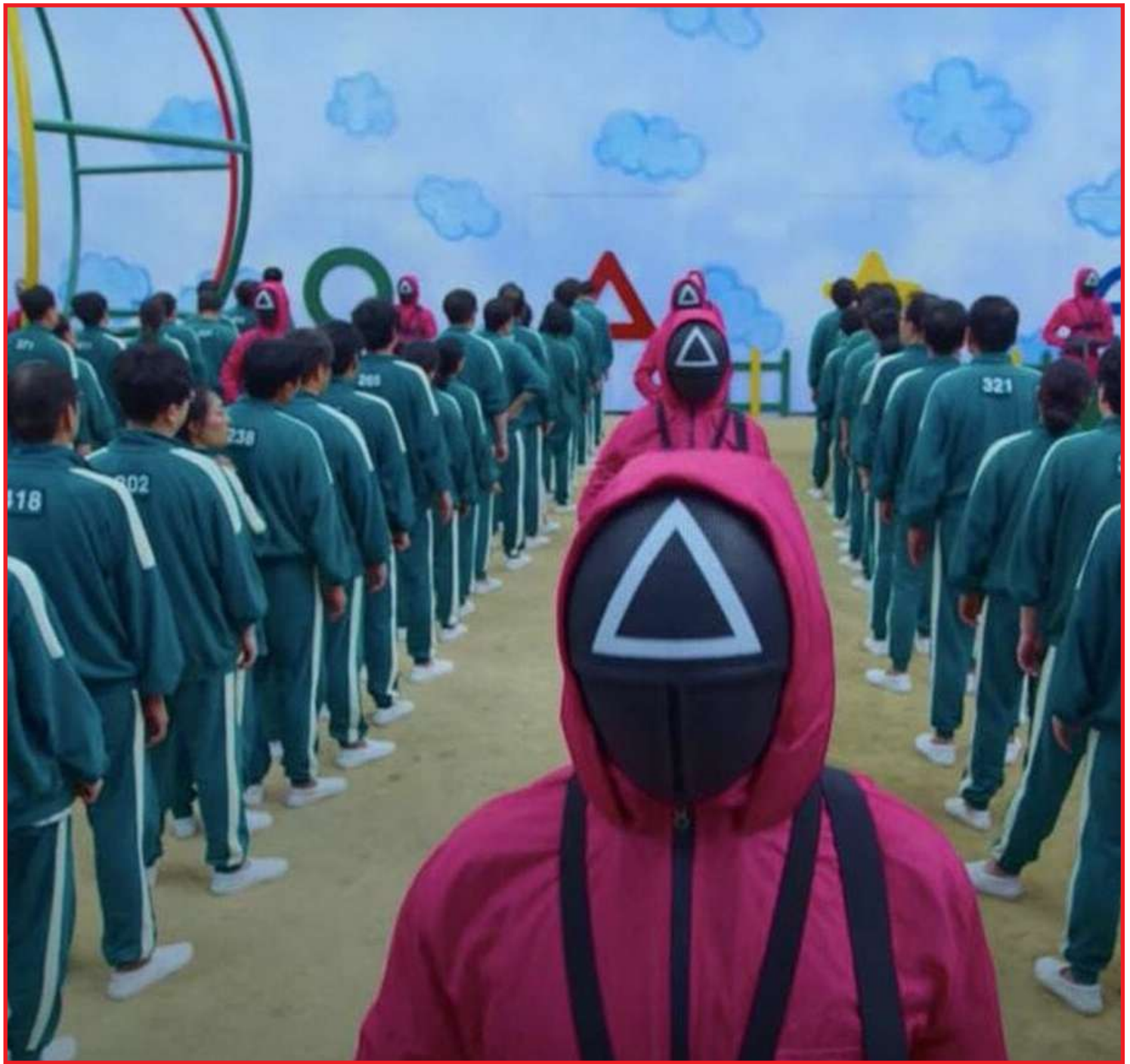
Motorista destruiu cruzes de homenagem às vítimas da Covid

Os cenários ficcionais baseando-se na realidade, nos torna capazes de identificar tais problemáticas e refletirmos, até onde a ficção se distancia do real, e em qual momento ela passa a fazer parte de realidade.