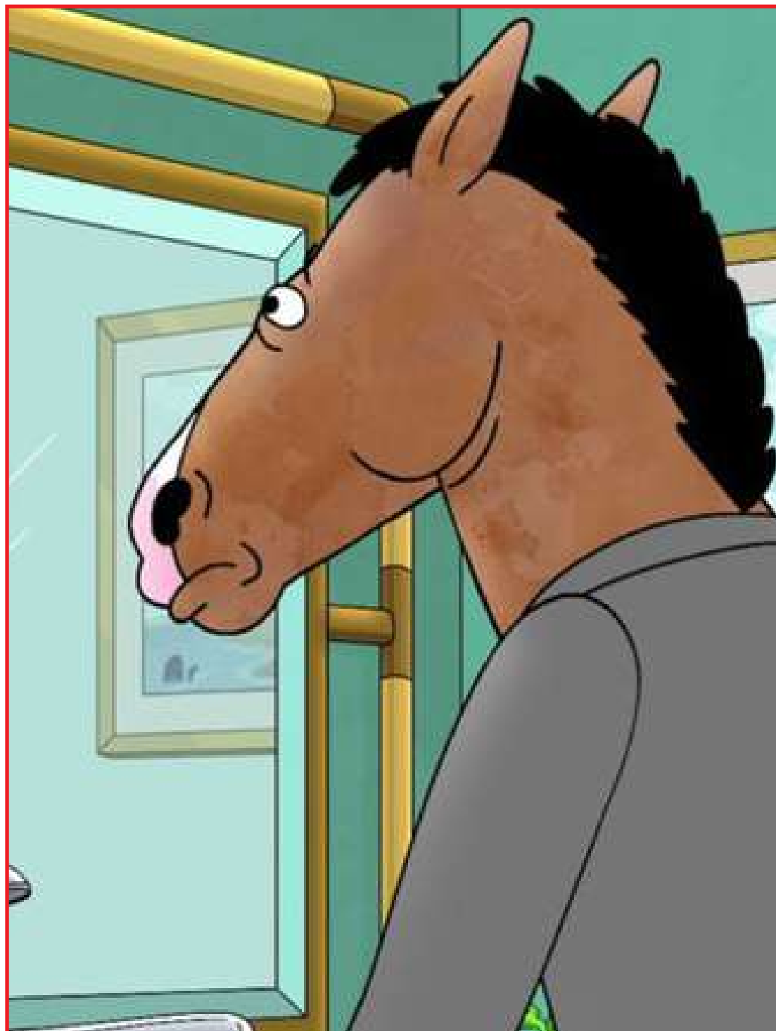
Série fala de depressão, problemas emocionais e responsabilidade

No enredo, o personagem principal apresenta-se melancólico a todo momento, vive se baseando no passado e prejudicando o seu presente e futuro, sendo muitas vezes uma pessoa amarga, que age de má fé para com os outros, mesmo tendo pessoas que se importam com ele e que tentam o ajudar, sempre preferindo se isolar e continuar se afundando, essa é uma das séries que nos faz refletir sobre o que fazemos em decorrência dos problemas psicológicos,