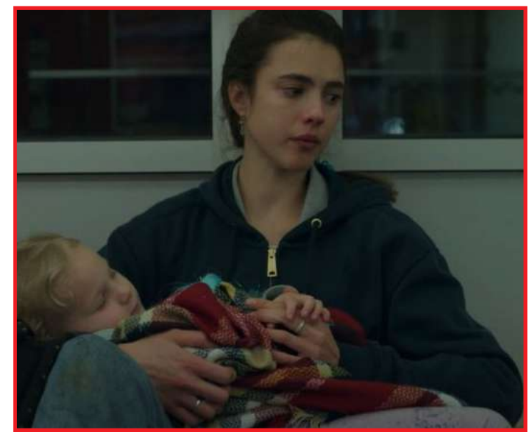
Série tem feito sucesso na Netflix