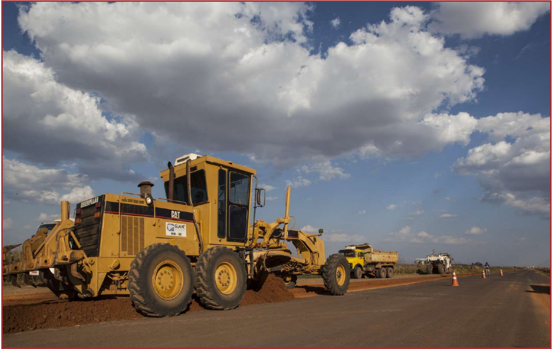
As obras estão em andamento em 164 quilômetros da MT-100

Vale ainda destacar que a MT-100 é uma das principais rotas de escoamento de grãos do estado, por isso uma pavimentação de qualidade é essencial até mesmo para o desenvolvimento da economia de Mato Grosso. O