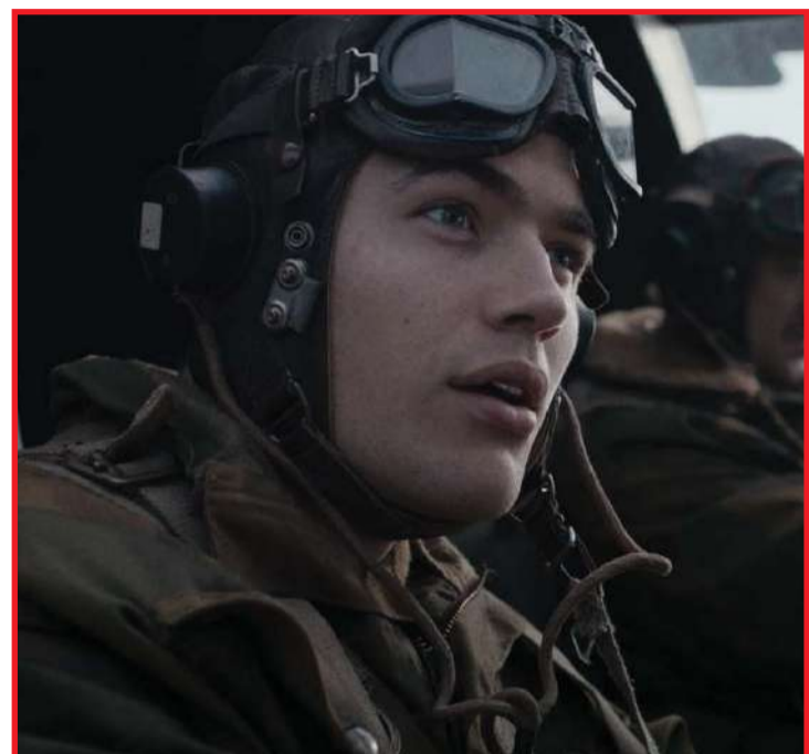
Filme retrata momento decisivo da 2ª Guerra Mundial

E provavelmente essa fatídica cena do encontro seja a mais bonita e dolorosa do filme. Ela carrega uma noção implícita de que o horror os reuniu num instante bastante específico que nada tem de grandioso, épi-