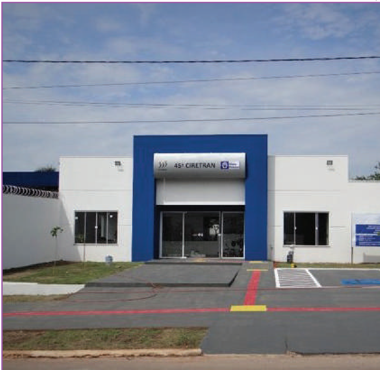
Órgão lida diretamente com o atendimento ao público

“Com as reformas queremos melhorar o atendimento ao público, garantia das exigências de acessibilidade e melhoria do ambiente de trabalho aos servidores”, destacou.