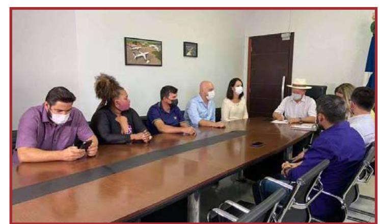
O custo global da estrutura é de R$ 520 mil