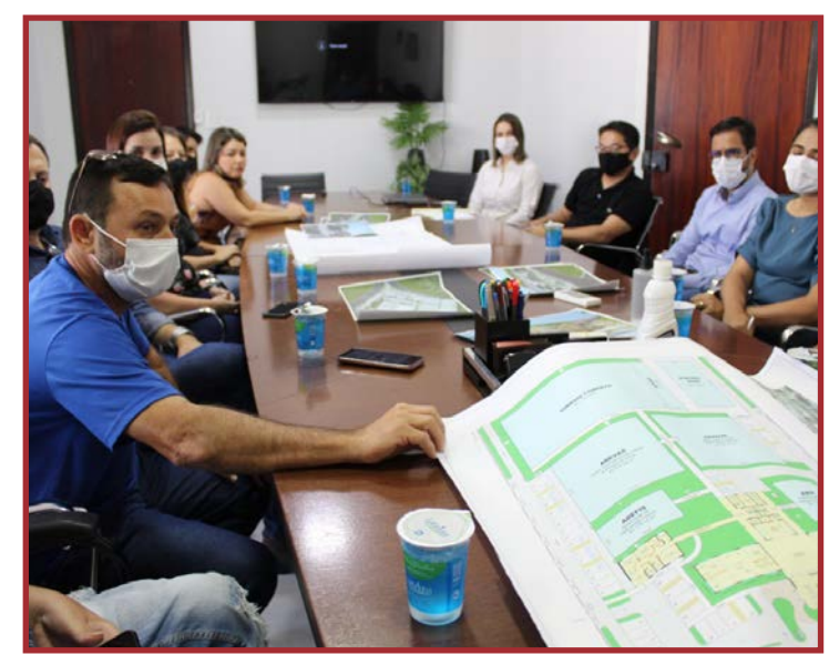
AMA, ADEVAS, APROVE, ADEFIS e terão sede unificada