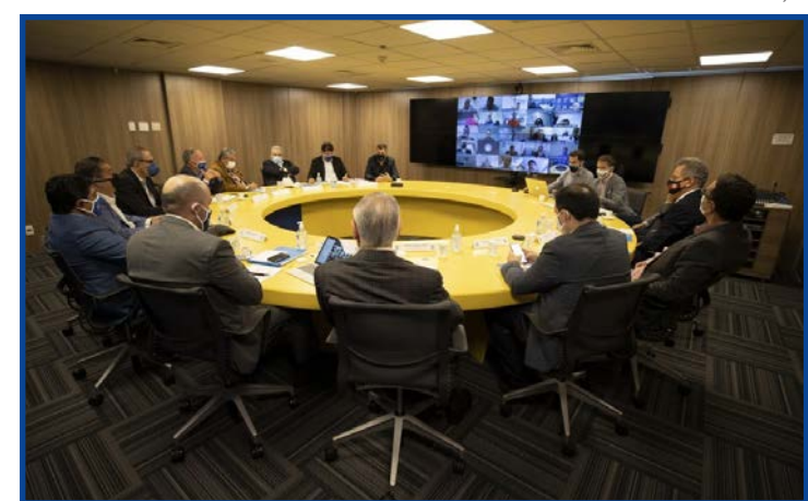
CBF divulga proposta para o ano que vem com previsão de 17 dias de pré-temporada