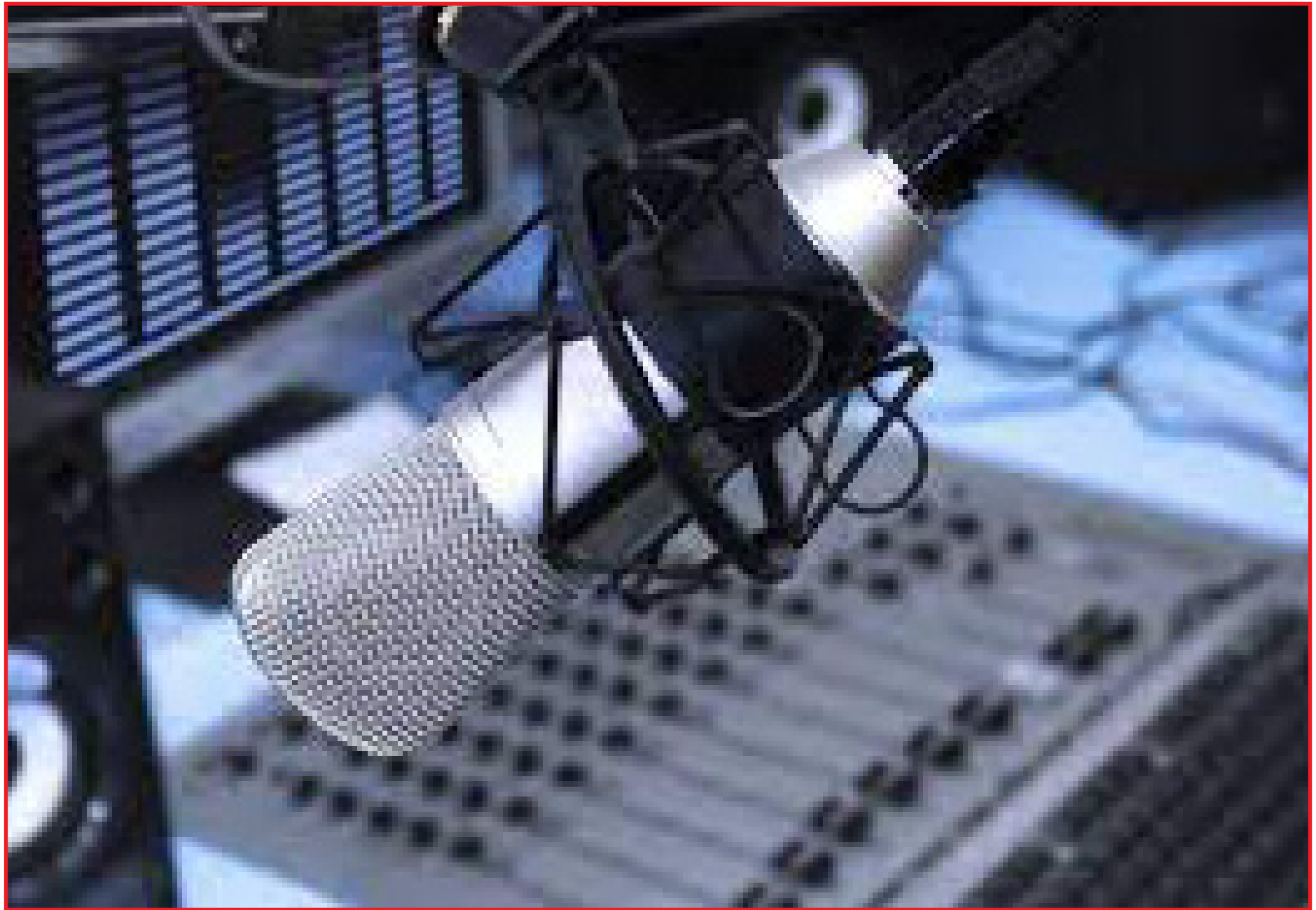
Dia do Radialista é comemorado (também) neste 7 de novembro

Sua paixão pelo rádio foi verificada principalmente na Rádio Tupy, onde produziu e participou de vários programas e ainda foi locu-