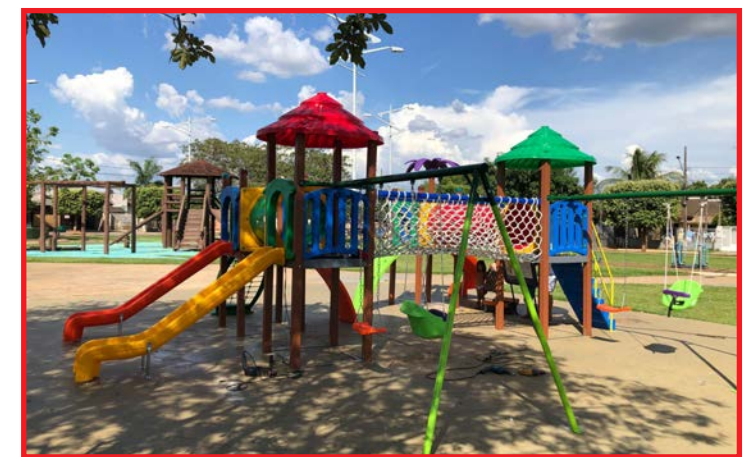
Parquinhos já estão disponíveis para uso pelas crianças