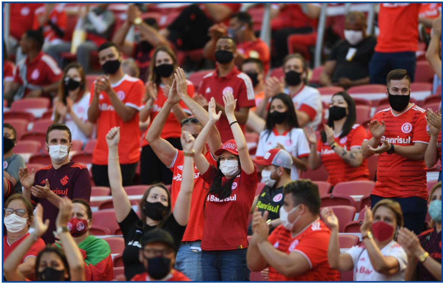
Beira-Rio receberá apenas torcedores do Inter

O Grêmio também recebeu punição do Juizado do