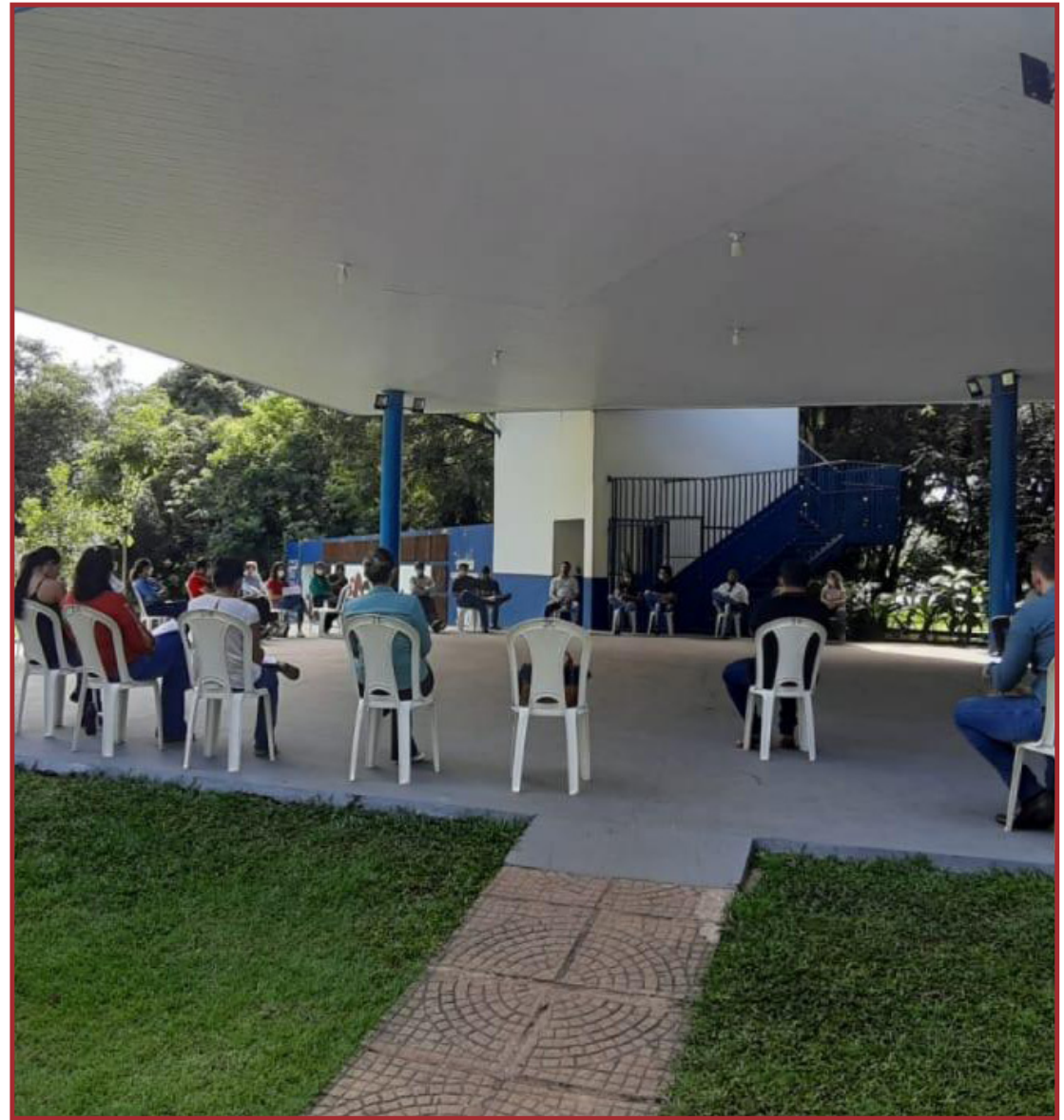
53 cidades foram convidadas a expor suas experiências