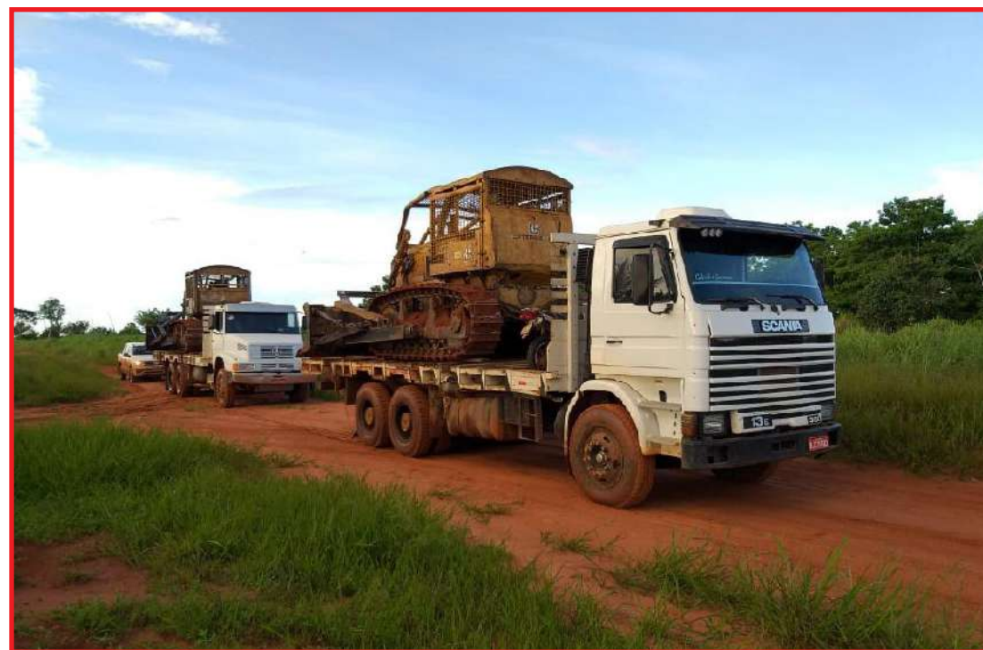
Apreensão de máquinas usadas em desmatamento ilegal em Brasnorte

A Secretária de Estado de Meio Ambiente (Sema-MT) ainda irá regulamentar o procedimento de conciliação, assim como os outros pontos na nova Lei. A nova redação também aumentou de 15 para 20 dias o prazo para apresentação de defesa após o recebimento do auto de infração - que é o