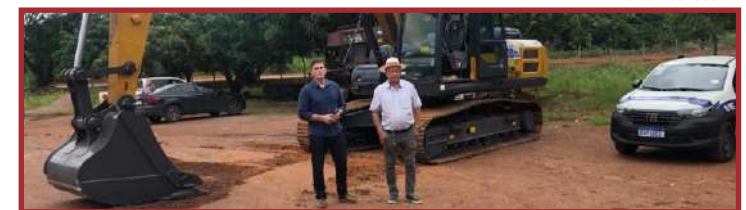
Os equipamentos já estão no município