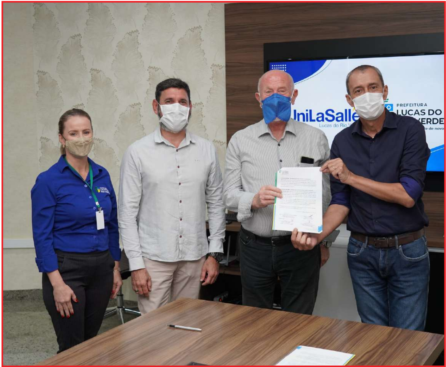
Bolsas de estudo em ensino superior à galera da agricultura familiar

Sugerimos a criação dessa escola técnica, de en-