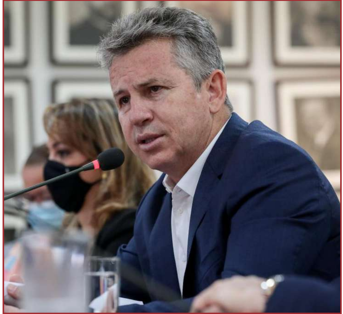
Mendes fez balanço da participação de Mato Grosso

Porém, o governador ponderou que é preciso maior colaboração dos países desenvolvidos para a manutenção desses ativos ambientais, uma vez que é necessário aportar grande volume de investimentos para garantir a preservação. “Nós temos um plano de ação já em andamento com 12 estratégias para acelerar a redução do carbono.