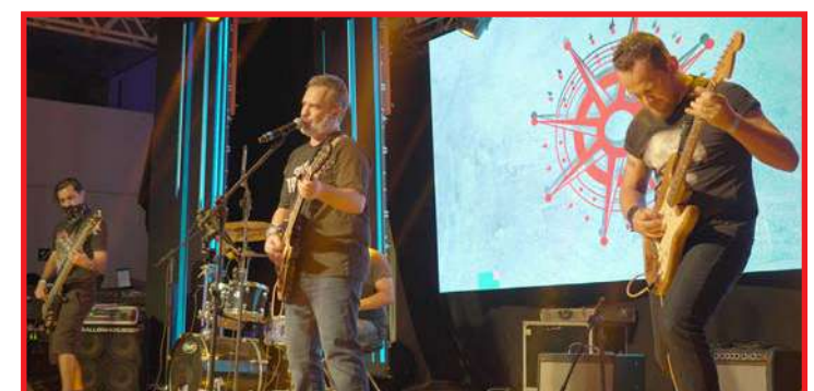
Grupo "Power Rock Trio", de Cuiabá, ministrará oficina de bandas a partir das 18h