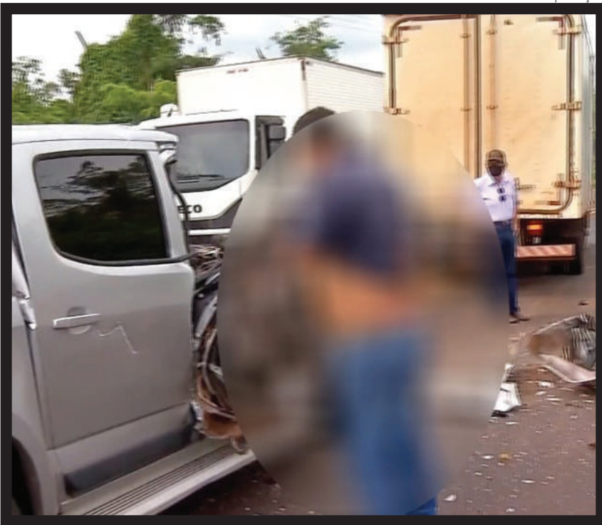
Um motorista saiu APENAS desorientado de um grave acidente que sofreu na MT-480. O motorista de caminhão estava parado na rodovia esperando a liberação da pista, por causa de um capotamento na serra, quando a caminhonete se chocou contra a traseira dele. Segundo a polícia, o motorista desrespeitou a sinalização na pista, estava em alta velocidade e bateu no caminhão. O homem saiu andando do veículo, cuja cabine ficou completamente destruída.