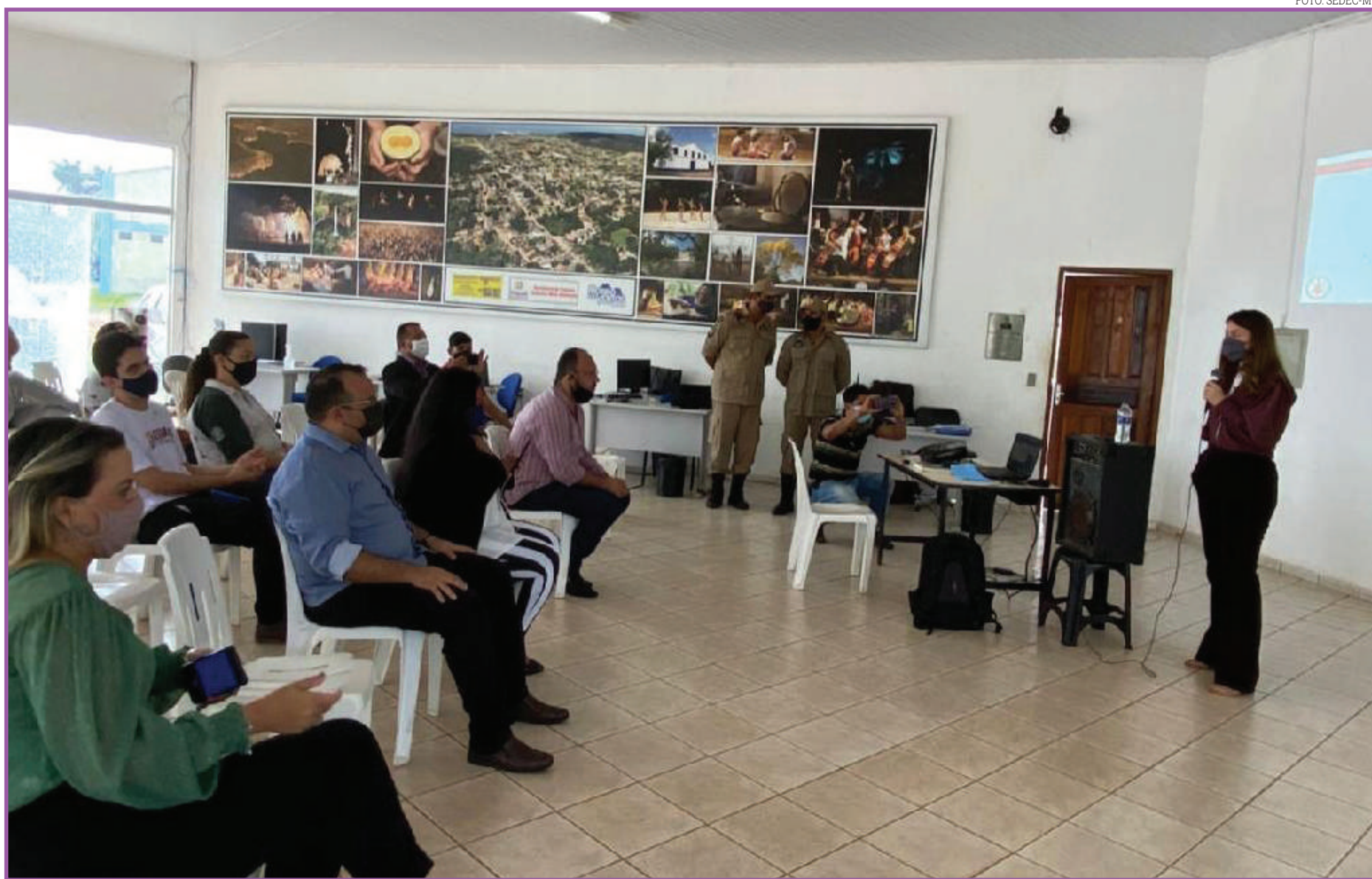
Condutores e guias de turismo recebem capacitação em primeiros socorros

Secretaria de Estado de Segurança Pública (Sesp-MT), Corpo de Bombeiros Militares de Mato Grosso (CBM-MT), Prefeitura de Chapada dos Guimarães, Sindicato dos Guias de Turismo de Mato Grosso (Singtur) e Conselho Municipal de Turismo (Comtur).