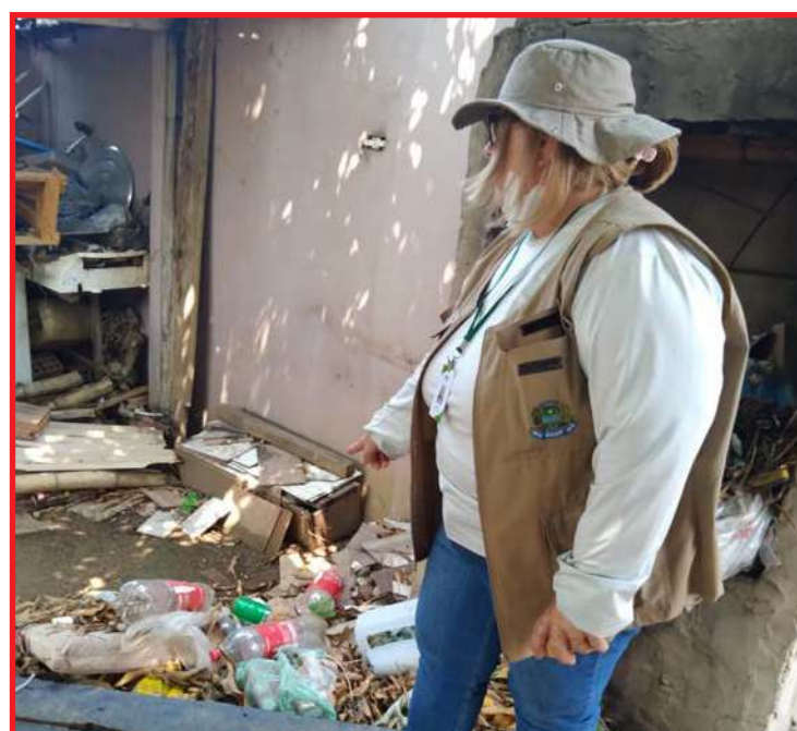
Caminhada percorrerá Av. Júlio Campos

Recém-eleito por Hanks como um de seus filmes favoritos, o filme, lançado em 2000, foi dirigido por Robert Zemeckis (Forrest Gump) e arrecadou mais de US$ 400 milhões mundialmente. Por