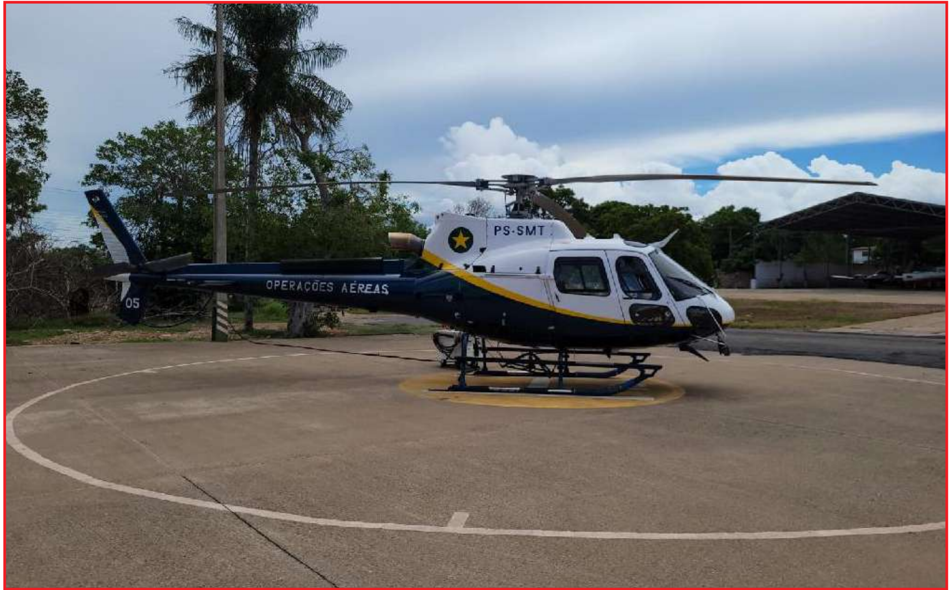
Novo helicóptero do Ciopaer: ações de fiscalizações e resgates

Com este helicóptero, o Ciopaer passará a ter 4 helicópteros e 9 aviões, sendo 2 deles UTI aérea. O Centro In-