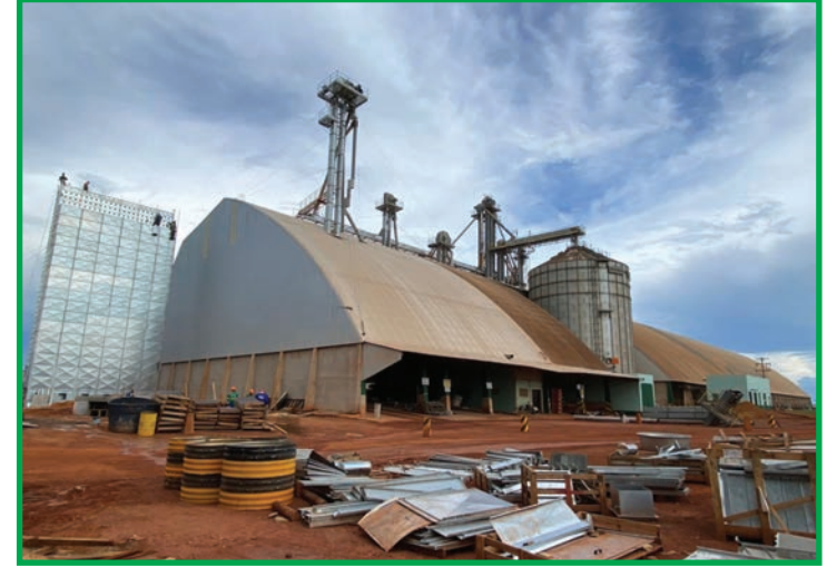
Terraplanagem onde ficará um novo armazém em Canarana

E a situação vem tomando proporções maiores, tendo em vista que a soja é uma commodity e, um abalo na ponta da cadeia produtiva, pode afetar o mercado do grão como um todo. Coube a vários agentes responder ao chamado da classe produtiva por uma solução. Entidades, o próprio Governo Federal, tradings e os próprios produtores também foram em busca de alternativas. E os primeiros resultados começam a surgir. Em Canarana e em Água Boa, a empresa Agrícola Alvorada foi uma das que atendeu ao chamado dos produtores, e iniciou recentemente a construção de dois novos armazéns,