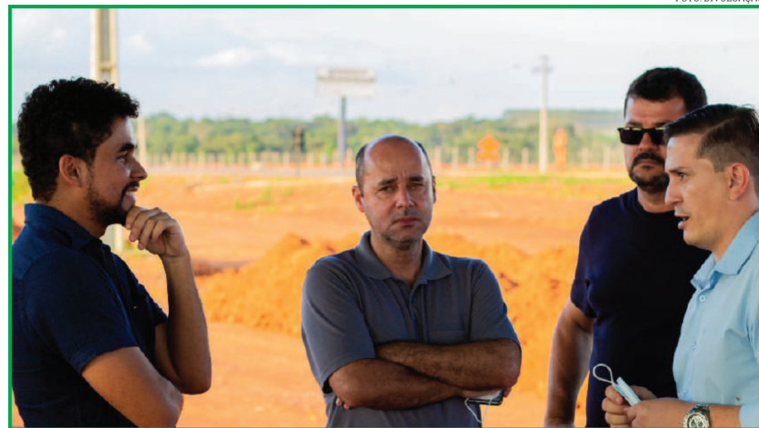
Gonçalves conheceu empresa de bioenergia que investirá R$ 60 milhões

Durante a visita, o secretário conheceu o projeto de modernização da Desplan e o pátio de máquinas completo, com mais de 60 tratores. Em seguida, a comitiva visitou