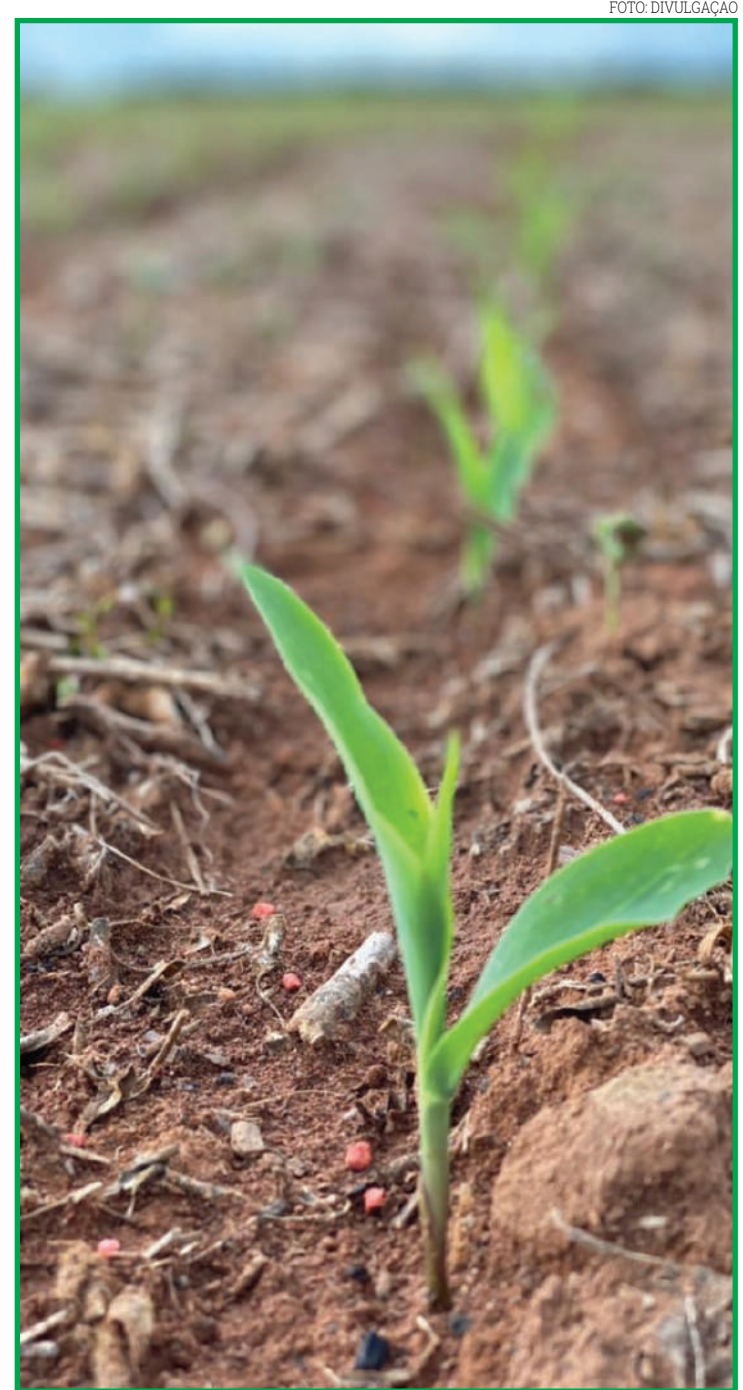
Movimento de baixa é observado no mercado doméstico

Além disso, as exportações seguem desaquecidas e as estimativas divulgadas na semana passada pela Conab indicaram possível boa produtividade na safra 2021/22.