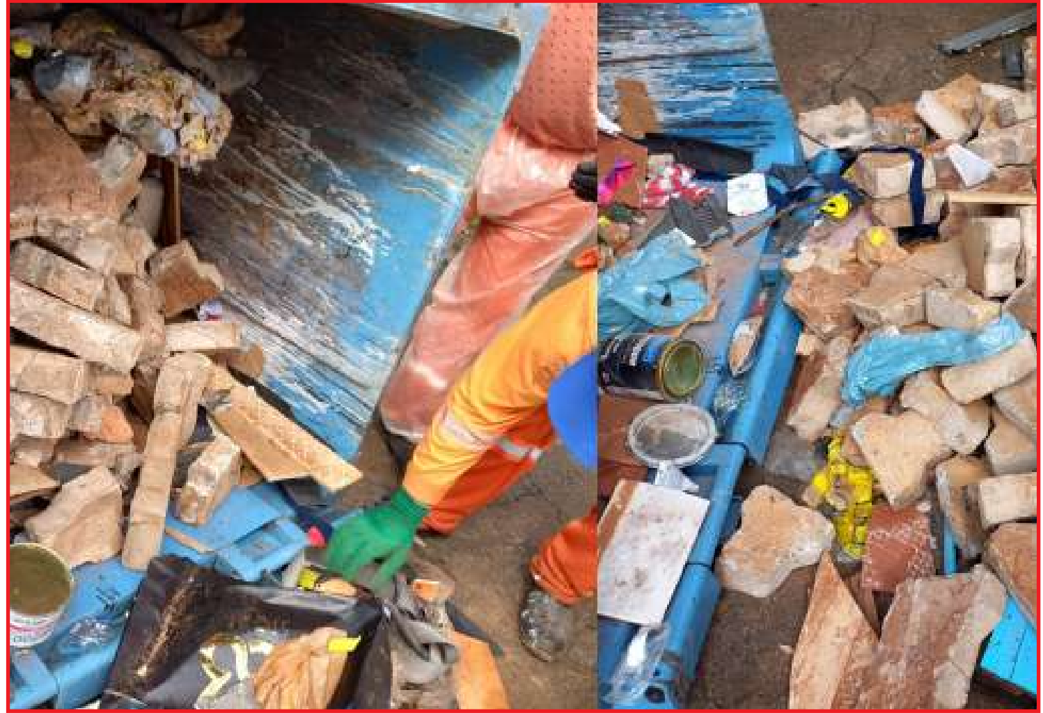
Lixo comum residencial é coletado diariamente pelos caminhões da coleta seletiva

Galhos e podas de árvores, materiais restritos, como