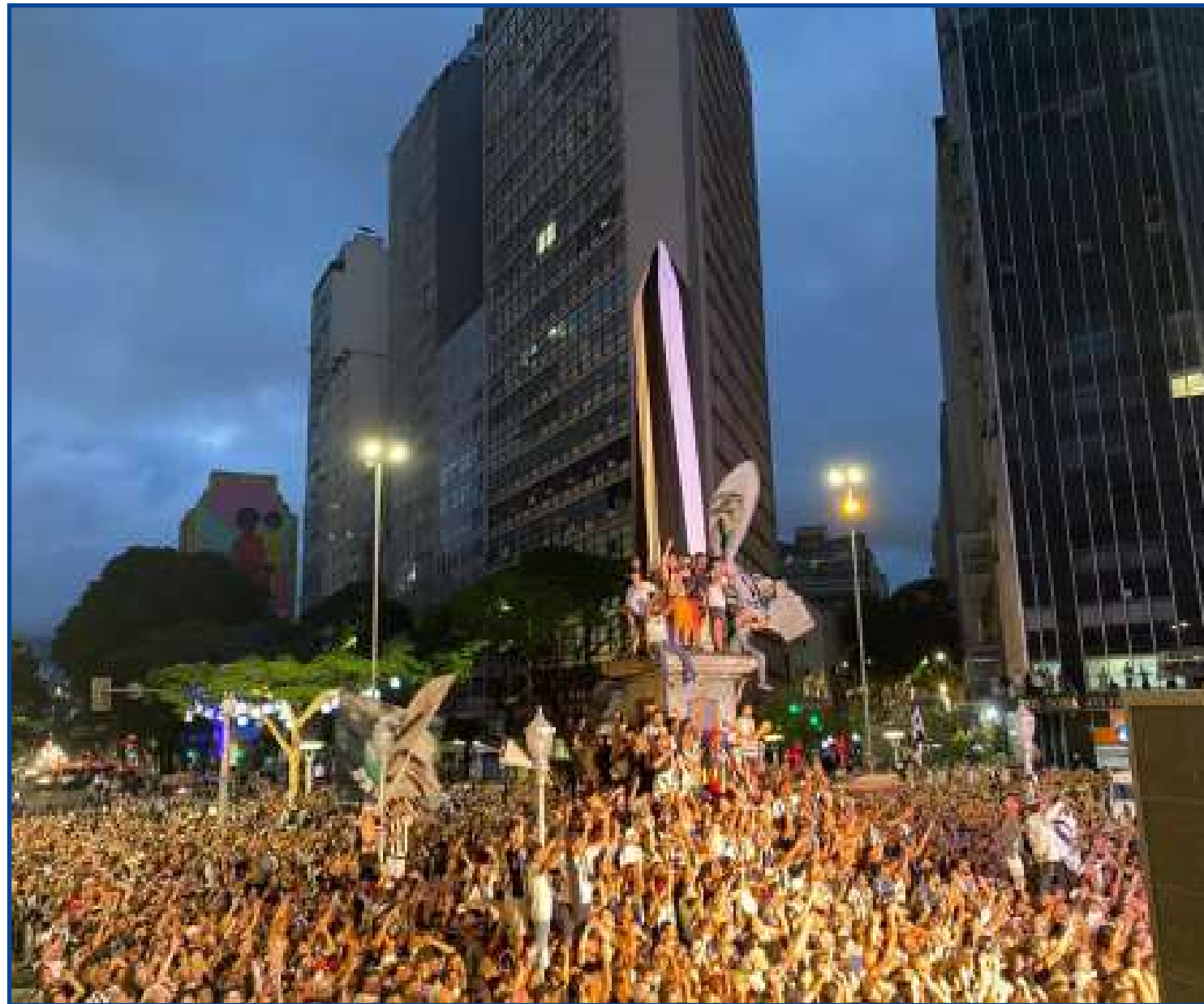
Festa do Atlético-MG chega aos primeiros raios solares de sexta em BH

A comemoração atleticana também não deixou