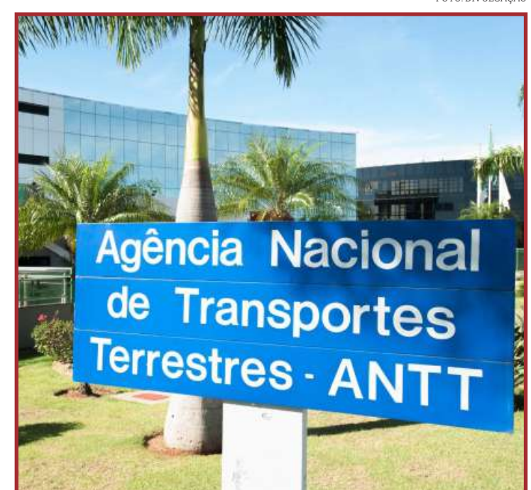
Proposta será encaminhada à diretoria ANTT