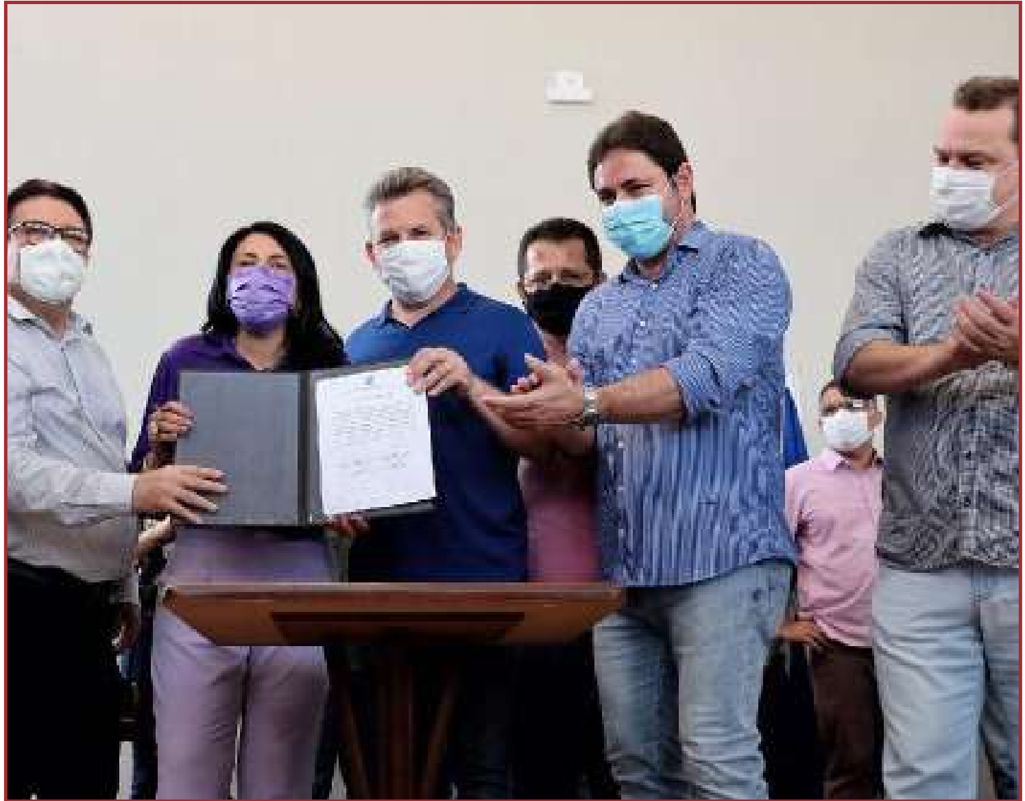
Todos os convênios firmados terão contrapartida da prefeitura de Cáceres

Porque é assim que temos trabalhado no Governo de Mato Grosso: aplicando corretamente o recurso público, que não é o dinheiro do governador, é o dinheiro do povo que o Estado arrecada e devolve para o cidadão, através de tantas e tantas obras que graças a Deus estamos dando andamento",