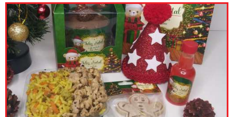
Produtos são naturais e agradam o paladar dos pets, segundo a confeiteira