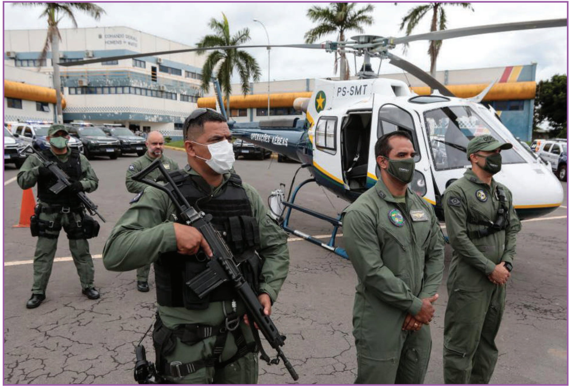
Helicóptero da Airbus AS 350 B3, conhecido como "Esquilo"

Com as aquisições, o Ciopaer encerra 2021 com uma frota composta por 12 aeronaves, sendo quatro helicópteros e oito aviões, entre eles, dois equipados com Unidade de Tratamento Intensiva (UTI) aérea. As bases da unidade estão localizadas em Várzea Grande e Sorriso (395 km de Cuiabá) e a partir destas regiões atendem chamados em diversos municípios do estado.