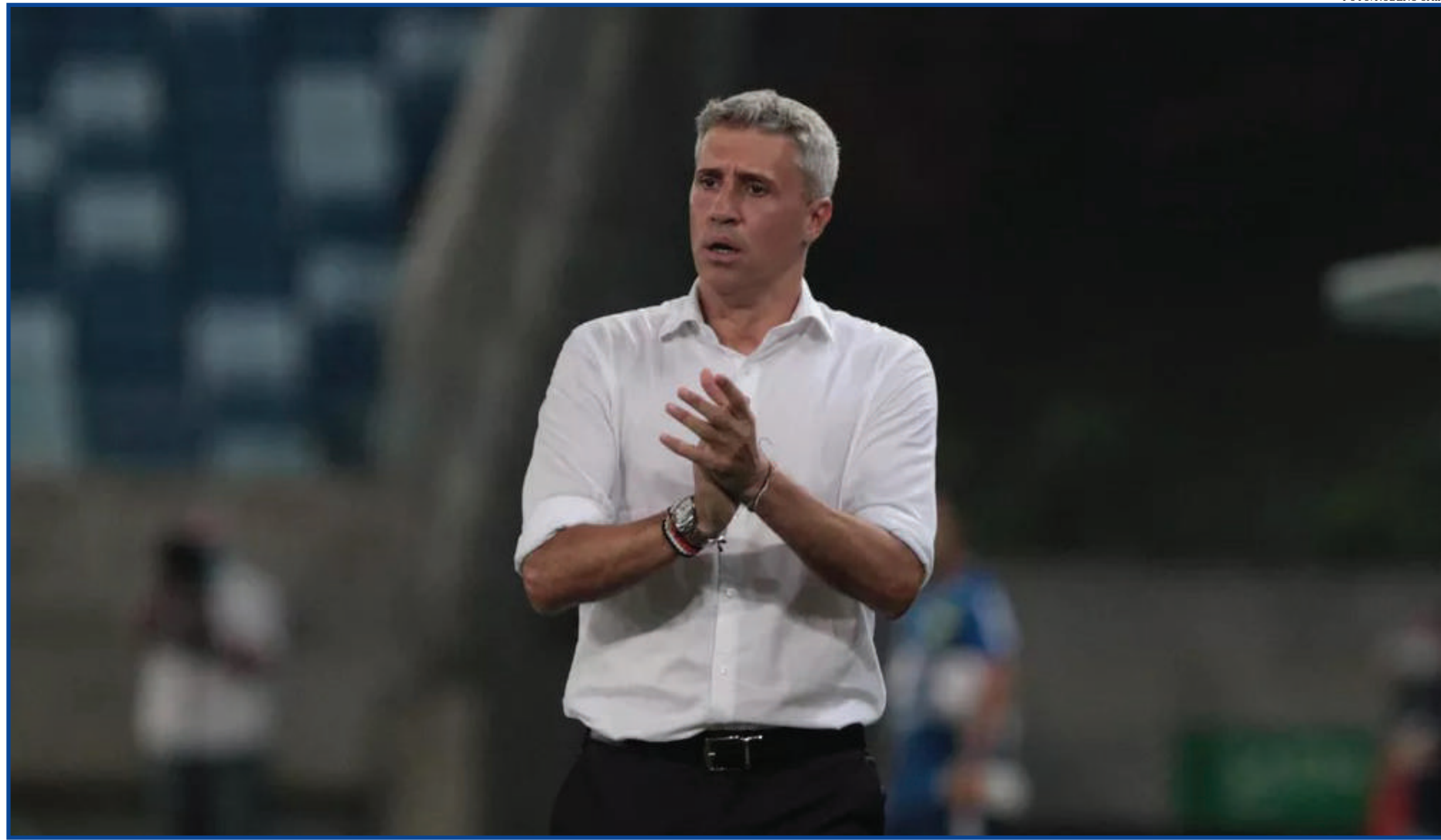
Hernán Crespo durante a partida contra o Cuiabá

Para demitir Hernán Crespo, o clube precisaria pagar mais de R$ 4 milhões para a comissão técnica argentina. Porém, houve negociação durante semanas para reduzir o valor. O contrato de Crespo com o São Paulo previa uma redução