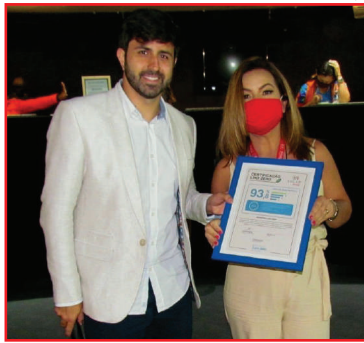
Unidade destina corretamente os resíduos

As ações voltadas para o pilar ambiental têm sido um ponto estratégico dentro do negócio da Solar. Junto ao Sistema Coca-Cola, a companhia aderiu à iniciativa World Without Waste (Mundo sem Resíduos), cujas metas incluem a expansão dos pro-