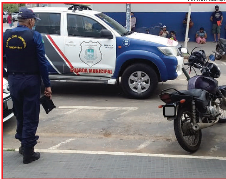
Objetivo é o cumprimento do Código de Trânsito