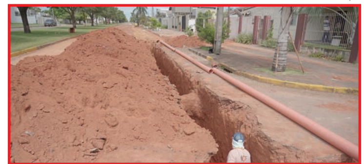
Uma das concorrências é para executar rede coletora de esgoto sanitário fase 3

Durante o período de recesso de atendimento ao público no Paço Municipal, o Departamento de Licitações estará disponível apenas pelo telefone: (65) 3549-8327 ou pelo e-mail: licitacao@lucasdoriverde.mt.gov.br .