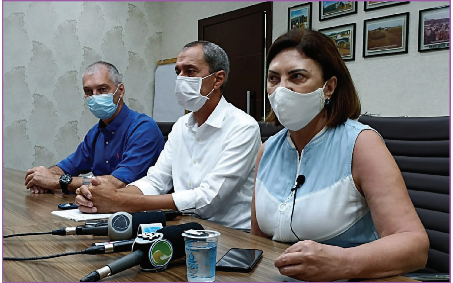
Detalhes do projeto apresentado à imprensa