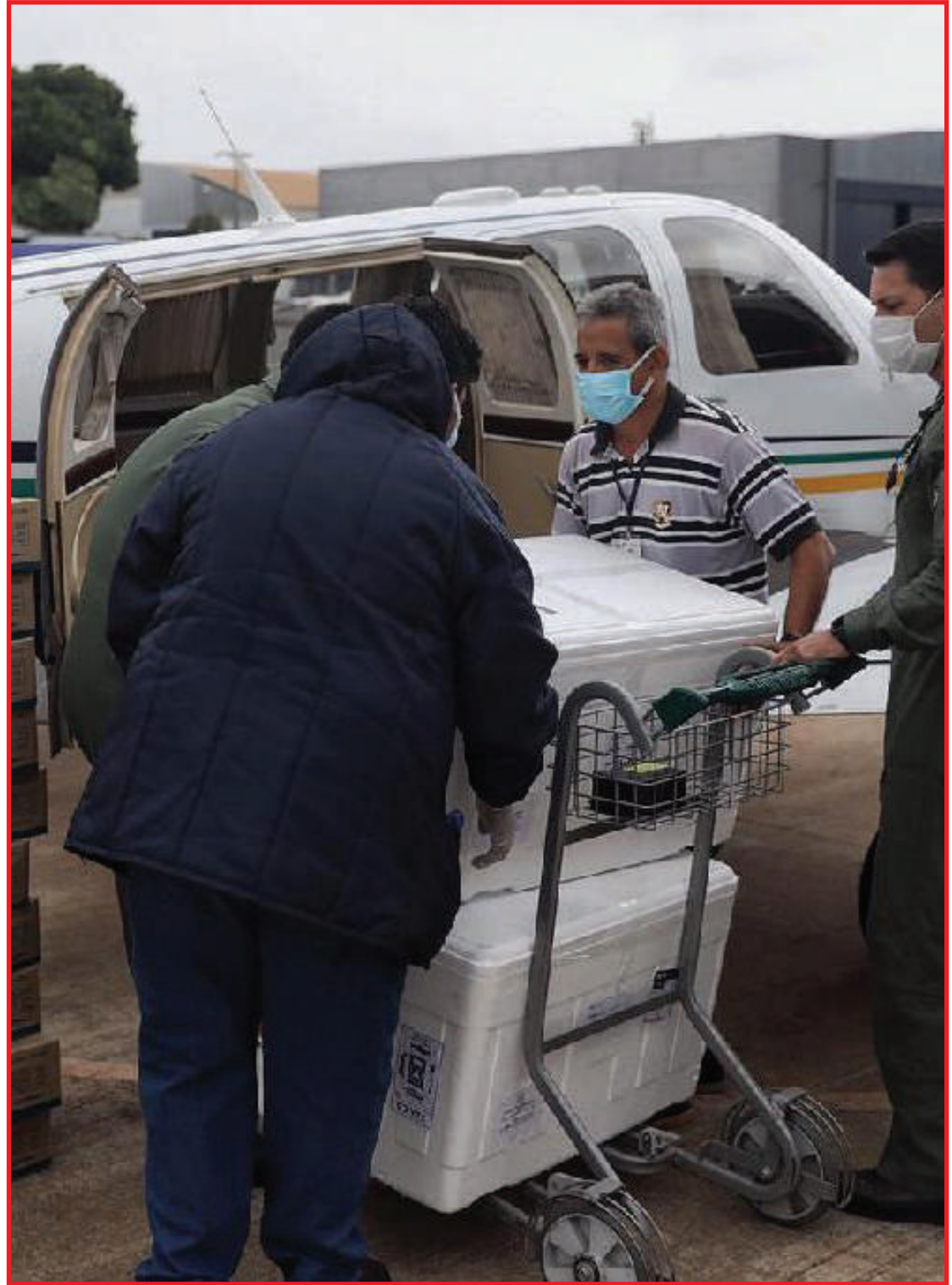
Corporação ajuda na entrega de vacinas no interior

Em 2021, o Ciopaer completou 19 anos de atuação em Mato Grosso e quer desmistificar a ideia de que o Centro Integrado é apenas uma unidade para transporte de servidores oficiais. Pelo contrário, a instituição também tem a tarefa de atuar no combate à criminalidade, salvamento de vidas e defesa do meio ambiente, conforme o balanço dos serviços prestados no ano passado.