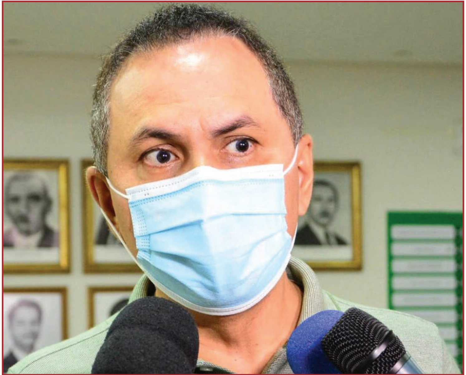
Polêmica gira em torno de cursos do Fundeb

O prefeito de Cuiabá disse ainda durante a live que a Revisão Geral Anual (RGA) dos servidores começa a ser paga ainda em janeiro. “Na educação vamos pagar RGA de 2021 de 9,22% já na folha de janeiro, e em março RGA de 2020 de 2,35%, e em maio RGA de 3,70% relativo ao ganho real de 2019. Ou seja, em cinco meses eu vou garantir a recomposição