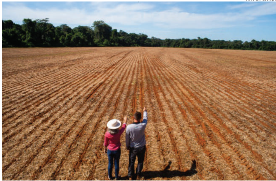
Portaria suspendeu adequação até 5 de julho

Desta forma, o Produtor Rural terá o prazo até o início do segundo semestre deste ano para realizar as devidas adequações, dos tratores destinados à aplicação de defensivos agrícolas com utilização de atomizador mecanizado tração.