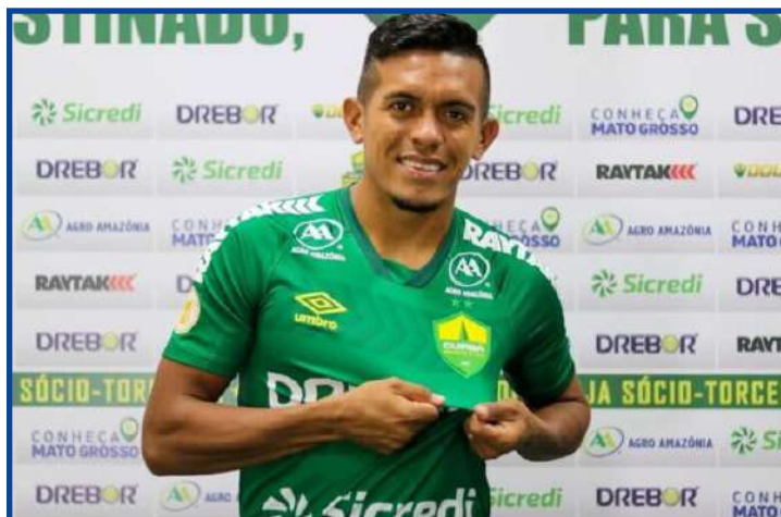
Lateral vem do Atlético-GO

O atleta também destacou a força do elenco do Cuiabá, que manteve os principais nomes da temporada passada. Para ele, isso é um diferencial para o Dourado. "É bom já ter