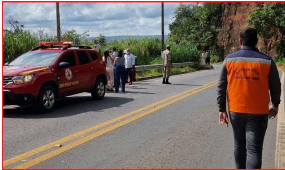
Defesa Civil junto com os bombeiros e dois geólogos realizaram a avaliação

O objetivo dessa mobilização é evitar que ocorra uma tragédia semelhante à de Capitólio, em Minas Gerais, onde cerca de 10 pessoas morreram após a queda de parte de um cânion sobre lanchas que passeavam pelo