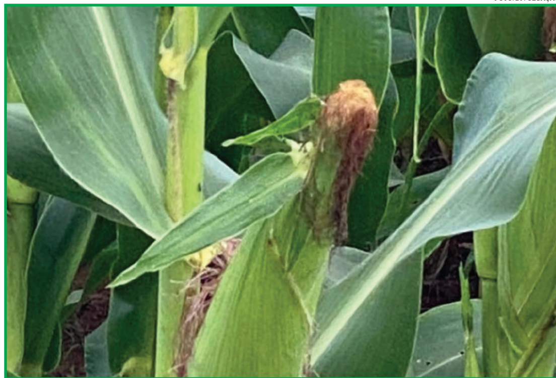
Clima no Sul preocupa produtores

No campo, produtores do Sul do Brasil já iniciaram a colheita da safra verão, mas, com o andamento dos trabalhos de campo, começam também a calcular os danos da forte estiagem na região sobre a produção de milho. Já no Sudeste e Centro-Oeste, as chuvas mais frequentes favorecem as lavouras.