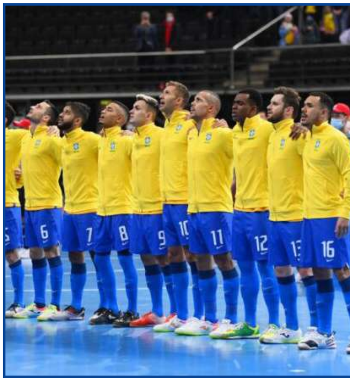
Convocação abre a temporada 2022 do futsal