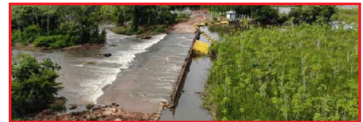
Equipes trabalharam de forma preventiva; local é monitorado devido à previsão de chuvas