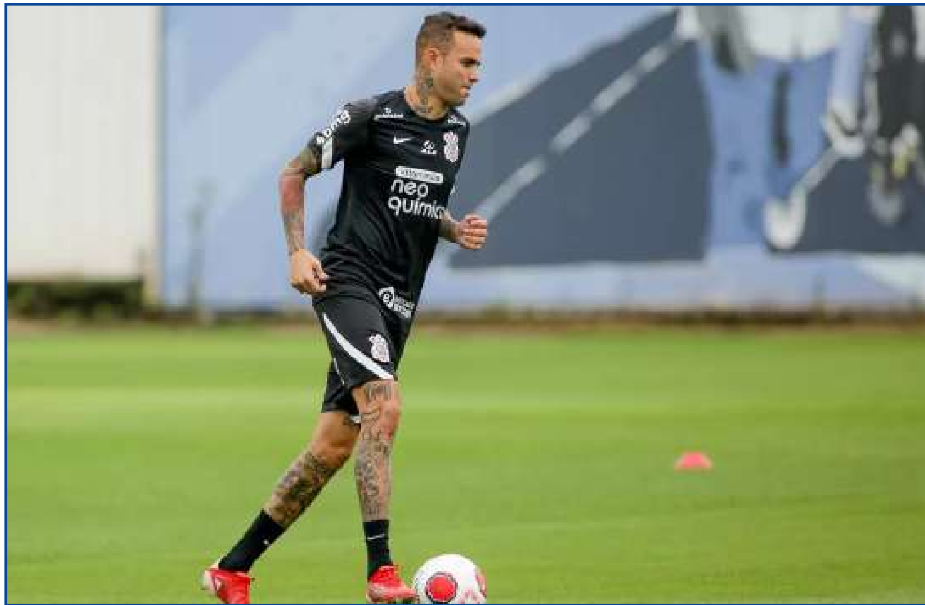
Camisa 7 completa 29 anos em março e não tem propostas na mesa para deixar o Timão

técnica de Sylvinho, Luan é visto como uma peça para compor elenco. Não deve encontrar facilidade para brigar pela posição de titular, assim