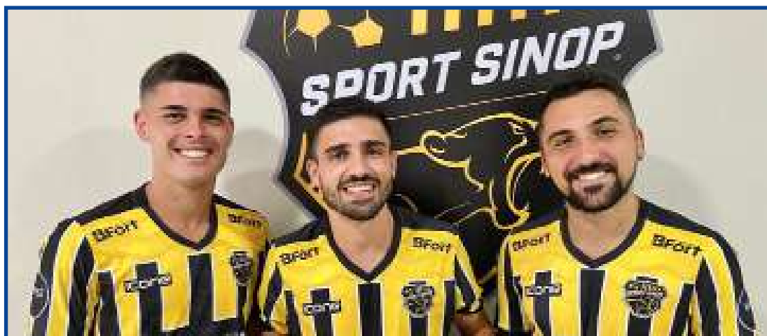
Sport Sinop contratou zagueiro, meio-campo e atacante