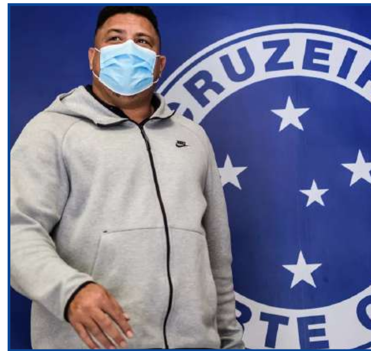
Ronaldo pretende disputar a temporada com R$ 35 milhões de orçamento

Segundo o balancete patrimonial de 2020, divulgado no ano passado, foram gastos R$ 250 milhões com