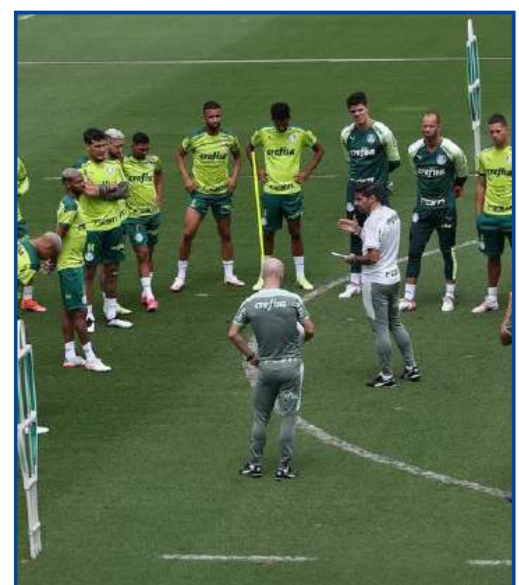
Elenco do Palmeiras antes do treino na Academia