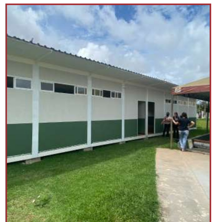
As estruturas trazem inovação e conforto térmico