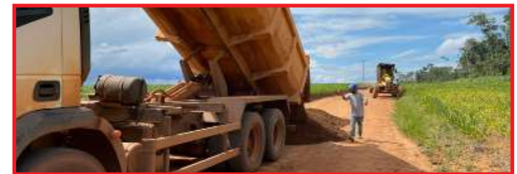
Recuperação de estradas na Gleba Mercedes