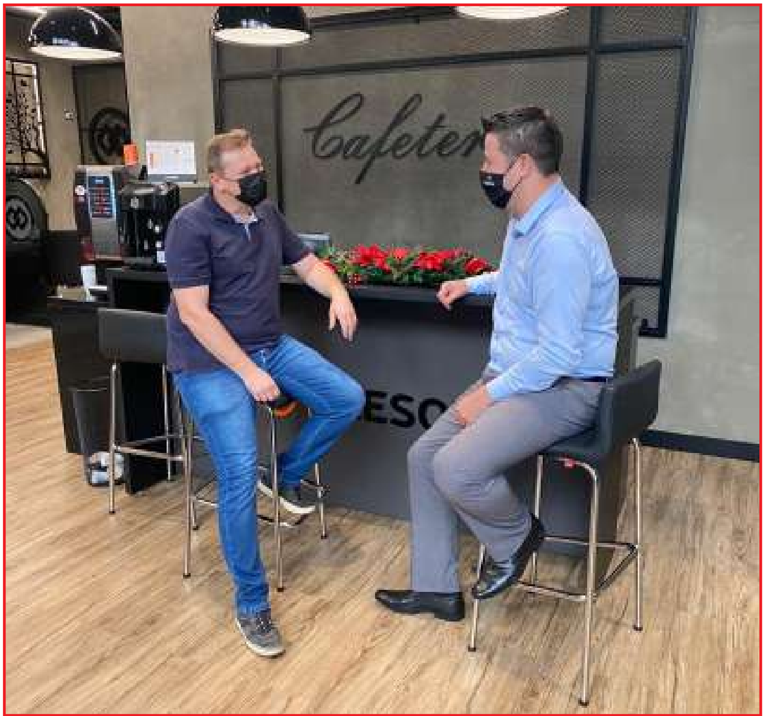
Cooperado recebe anualmente pagamento de juros ao capital social

Para consultar os valores de juros ao capital, o cooperado deve entrar em contato com o seu gerente ou fazer uma visita à sua agência de relacionamento.