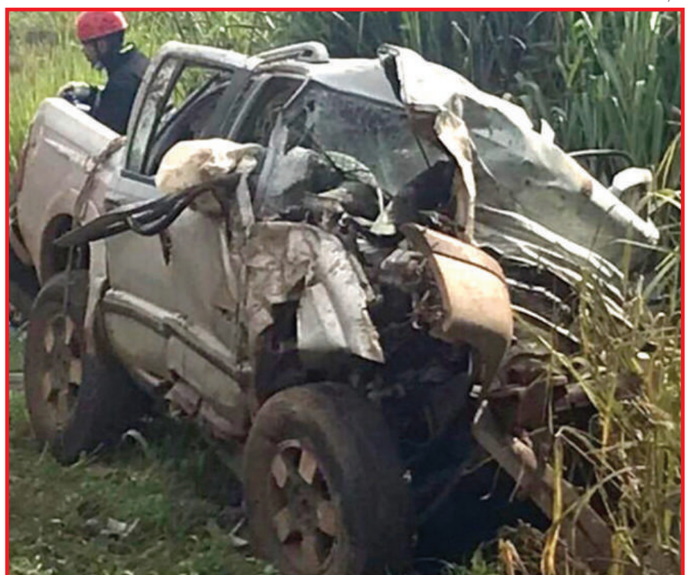
S10 ficou destruída

A versão apontada inicialmente, mas que ainda será investigada, é que o condutor da carreta seguia sentido Sul