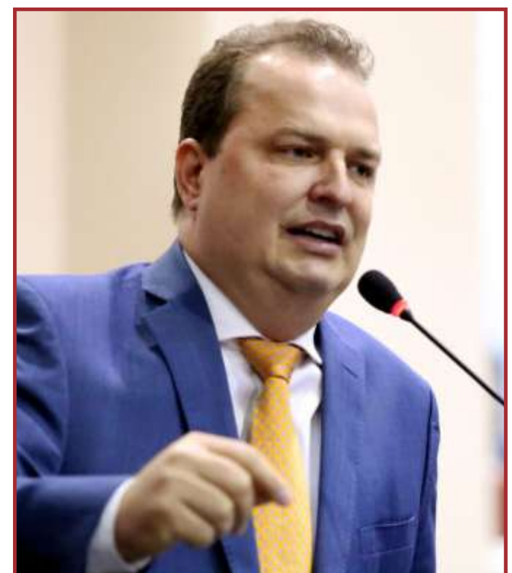
Objetivo é disputar a reeleição para Assembleia Legislativa