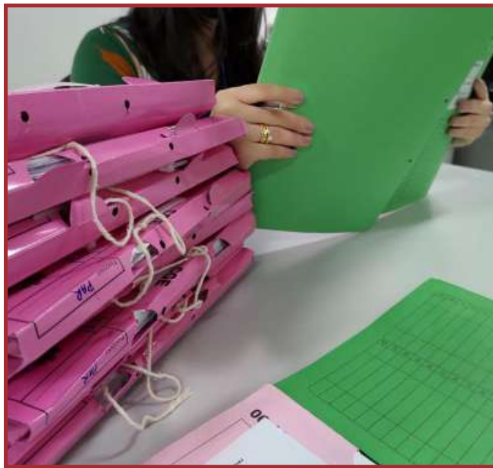
As multas decorreram do julgamento de nove processos administrativos

Além das multas, foram aplicadas outras sanções às empresas nos nove (09) processos julgados: publicação extraordinária da decisão condenatória, declaração de inidoneidade, suspensão