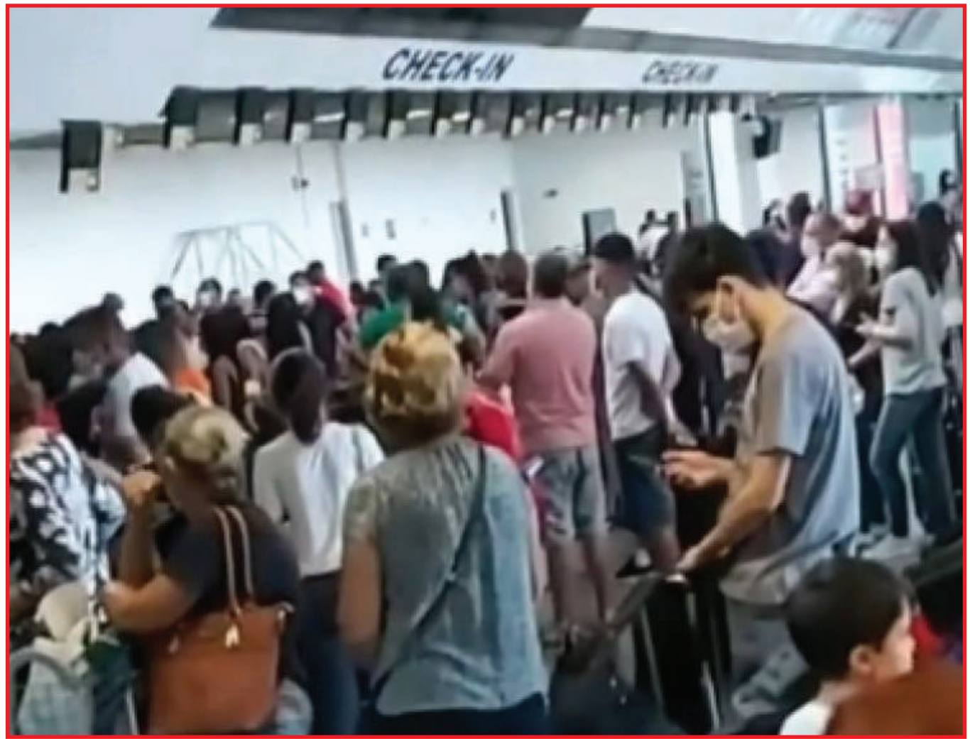
Passageiros se aglomeraram à espera de atendimento

O tumulto que aconteceu no último sábado foi registrado por