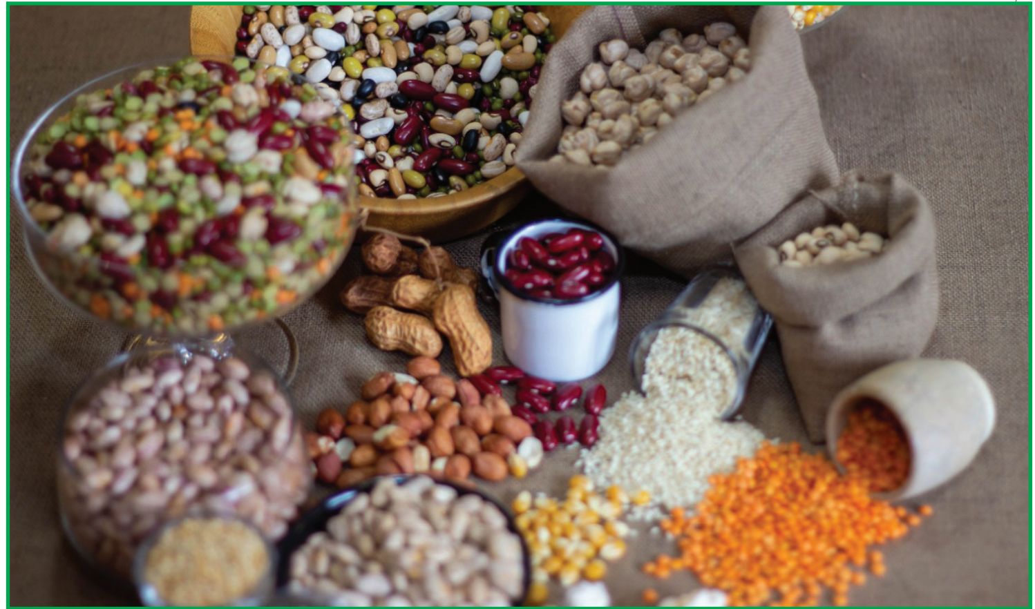
Criação da data tem o objetivo de incentivar a produção e consumo desses grãos

“A cultura tem grandes desafios para se desenvolver no futuro, ela vem crescendo nos últimos anos, chegou a perder um pouco de espaço nas últimas safras, mas tem