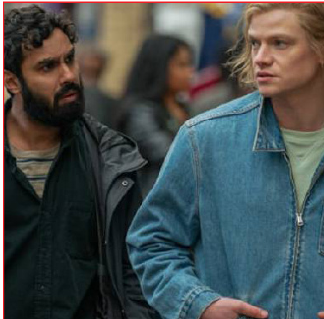
“Querida provar a mim mesmo que era capaz de algo diferente”, diz ator

Ao lado de outros quatro cidadãos britânicos que estavam no mesmo hotel de Nova York no dia do sequestro, ele é detido e interrogado sobre sua conexão com o crime.