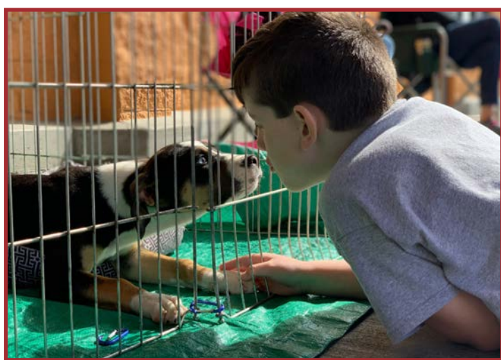
Animais são tratados vacinados, castrados e chipados

Além da disponibilidade para ter um animal de estimação, a Associação faz algumas exigências aos tutores. Entre os requisitos, é necessário ter um quintal fechado, proporcionar condições de vida digna e ter consciência de que ele terá um gasto financeiro, (despesas com veterinário, vacinas e eventuais tratamentos).