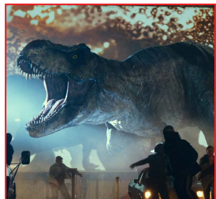
Sam Neill, Jeff Goldblum e Laura Dern se reúnem no longa