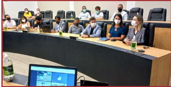
A premiação é considerada a maior da área

O coordenador ressalta como foi o processo para que Sinop chegasse nesta etapa. “No preenchimento da inscrição apontamos os dados e