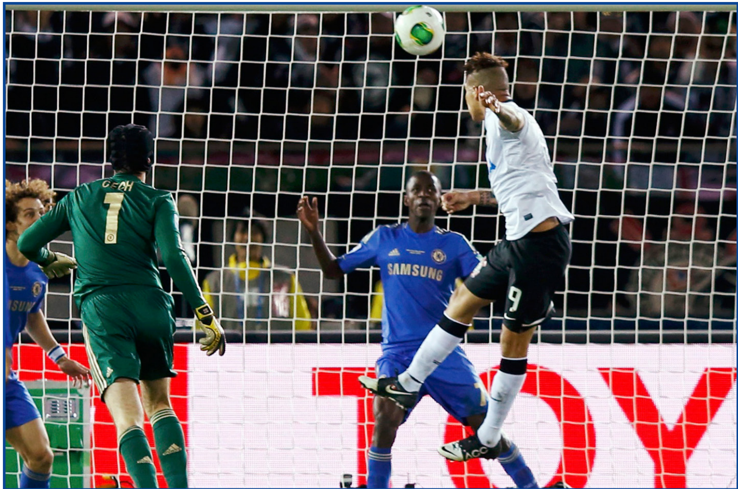
Chelsea caiu para o Corinthians na final de 2012