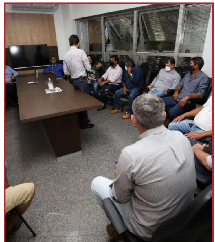
Intenção é formar uma comitiva mista em busca de uma solução definitiva para o impasse que se arrasta há 24 anos