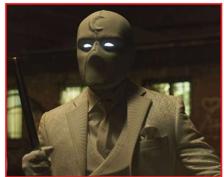
Personagem é uma das personalidades de Marc Spector