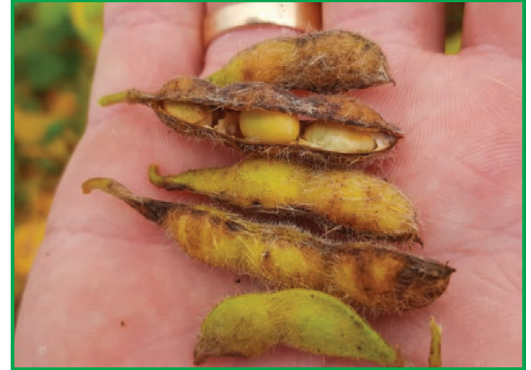
Produtores relatam maiores perdas de produtividade e impactos de até 40% na quantidade de grãos avariados

Os pesquisadores da Fundação MT relatam que em todas as avaliações neste período de três safras, não foi encontrado nenhum patógeno incomum associado ao problema, e sim fungos dos gêneros Fusarium, Colletotrichum, Phomopsis, Cercospora e também bactérias,