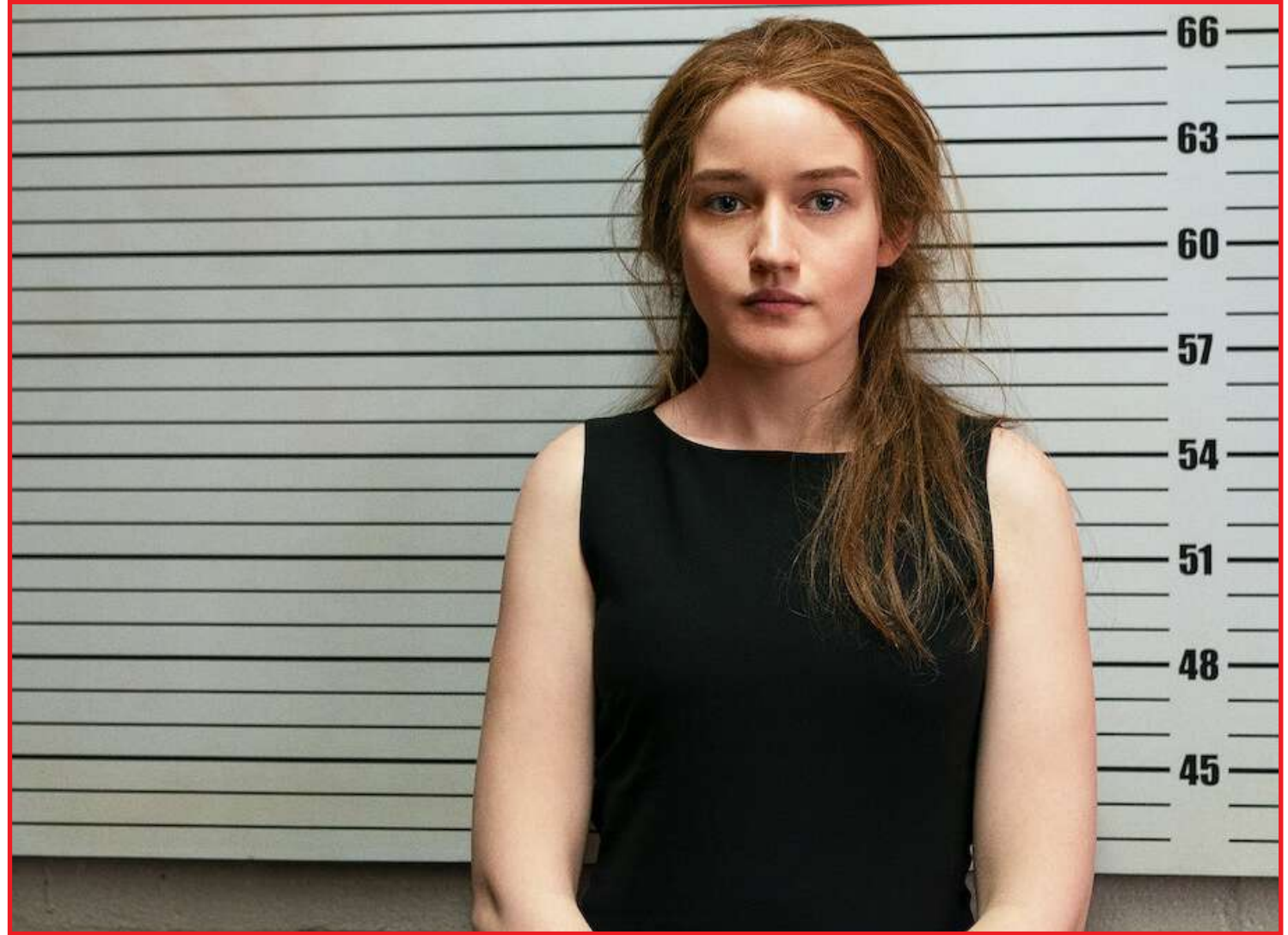
VW Meteor já está sendo testado pela engenharia e clientes da marca

É ao alimentar essa angústia existencial e moral causada pela história de Anna que a produção da Ne-