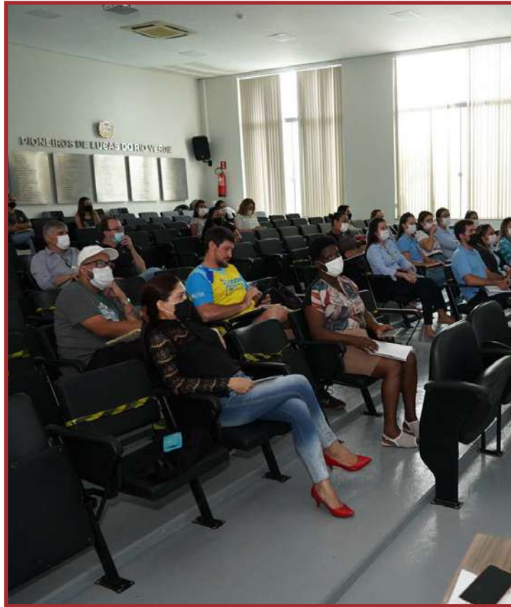
Ação foi realizada pela Controladoria Interna de Lucas do Rio Verde

Dúvidas ou informações sobre prestação de contas podem ser obtidas na Controladoria Interna pelo telefone (65) 3549-8362 ou ainda no e-mail controleinterno@lucasdorioverde.mt.gov.br.