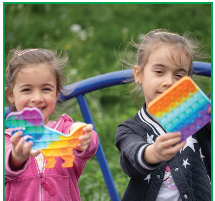
Oficina Choco Pop It já é um sucesso pela garotada