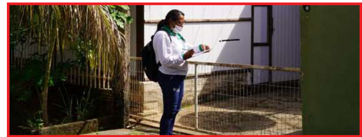
Capacitação em arboviroses realizada pela Saúde Municipal discutiu situação com Estado