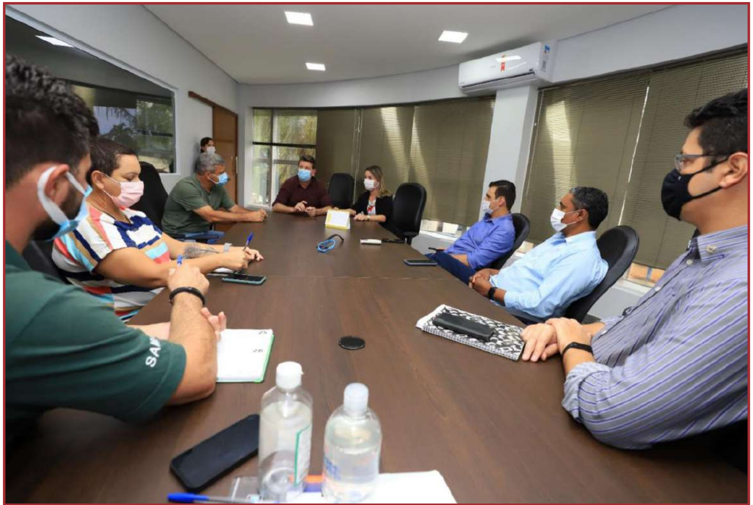
Representantes discutiram projeto-piloto do São José, que deve ser reforçado e ampliado

Para quem cuida de horta desde que "se entende por gente", o projeto tem tudo para resgatar a cultura, que, aos pouquinhos, vem perdendo espaço no Município frente à expansão imobiliária.