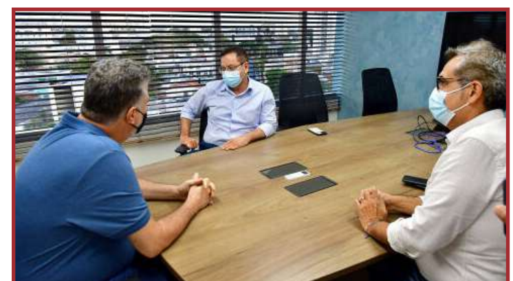
Ninho das Águas é um dos locais que mais sofre com a queda da energia elétrica