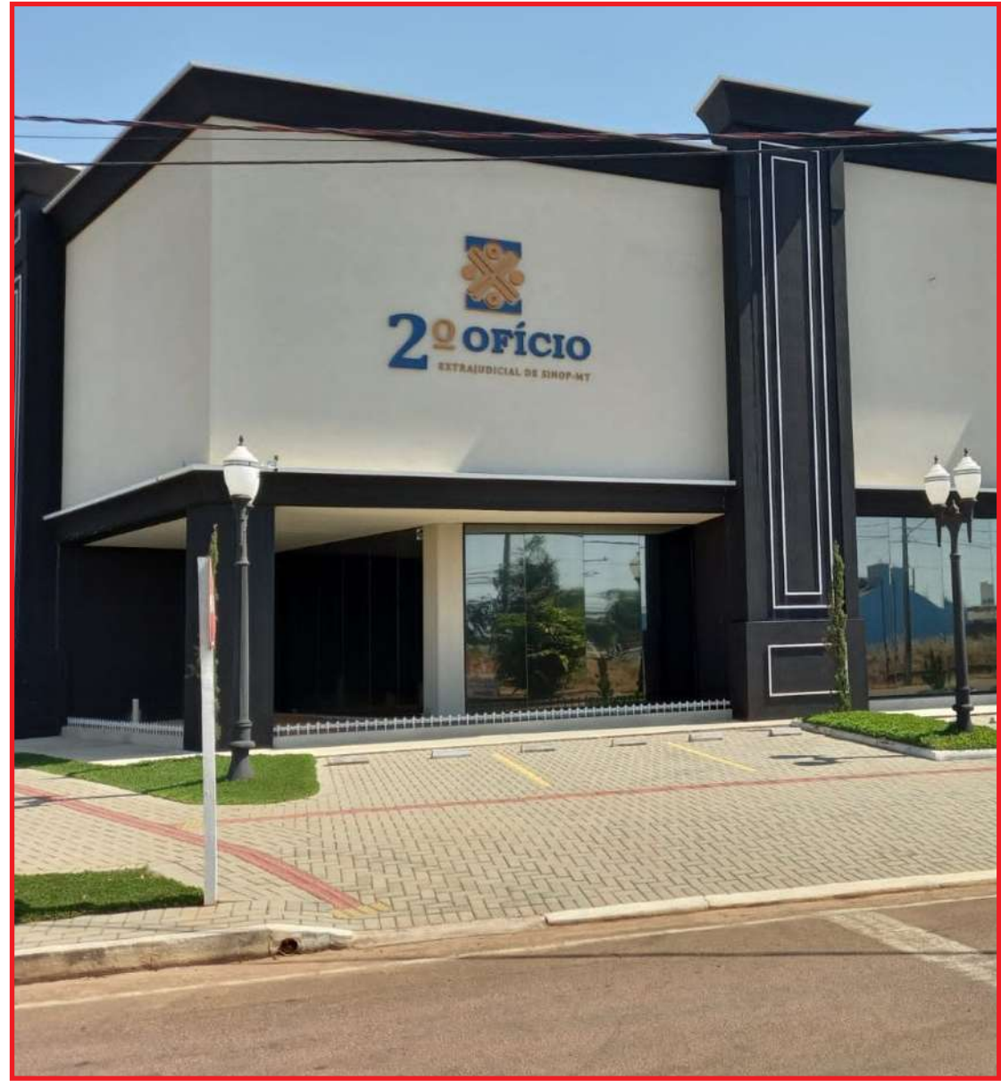
Número de óbitos por insuficiência respiratória cresceu 140%

Além disso, alguns estados brasileiros expandiram o prazo legal para comunicação de registros em razão da situação de emergência causada pela Covid.