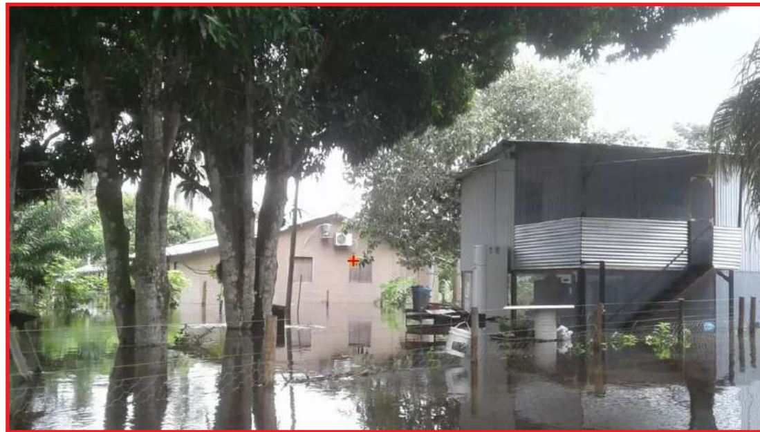
Moradores afetados recebem doações

municípios mais atingidos pelas fortes chuvas, cerca de 80 famílias ficaram desalojadas e outras 5 desabrigadas por causa dos alagamentos. Essas pessoas foram encaminhadas pela Defesa Civil ao Centro Comunitário e hotéis na cidade.