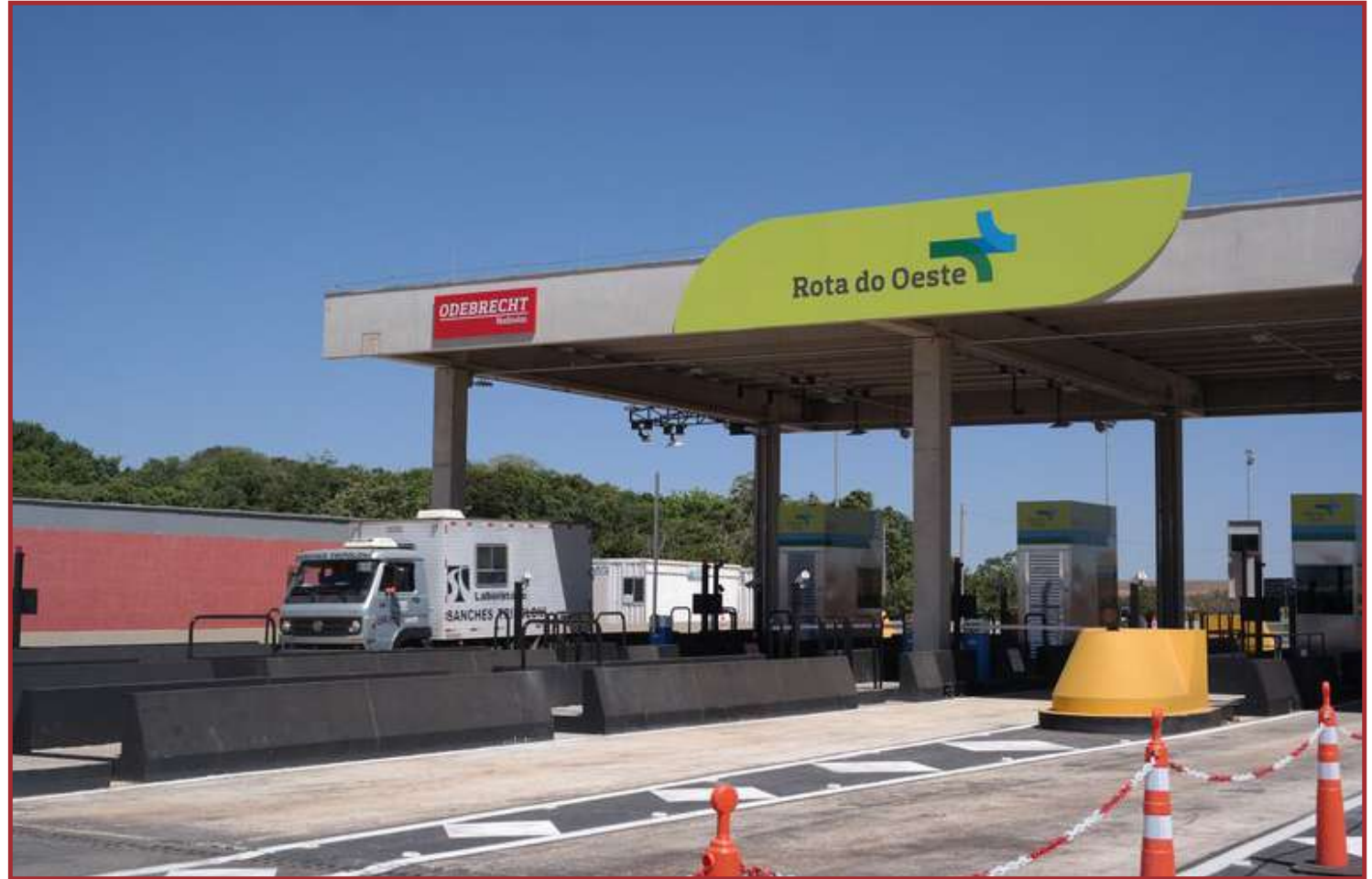
A Rota do Oeste assumiu a concessão da BR-163 em 20 de março de 2014