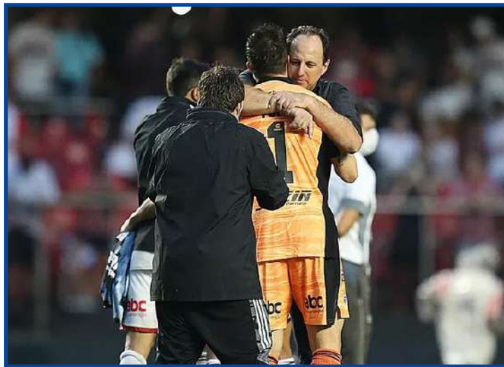
Treinador venceu os quatro duelos contra rivais desde que voltou

lução considerável se comparado com o retrospecto de Rogério em clássicos na primeira passagem pelo São Paulo, em 2017. Naquele ano, foram oito jogos contra Corinthians, Palmeiras e Santos. Venceu só dois jogos e teve aproveitamento de 37,5%. O jogo contra