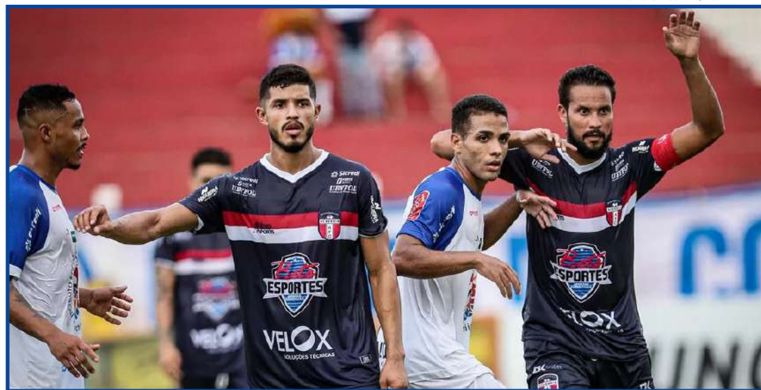
Leão da Colina superou o Academia e vai enfrentar o Cuiabá