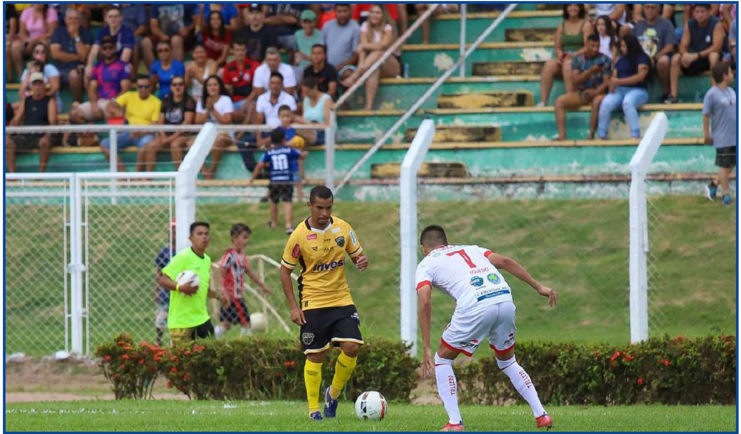
Sport Sinop venceu, mas resultado não foi suficiente para avançar

O zagueiro Tayron e líder do time, também desta-