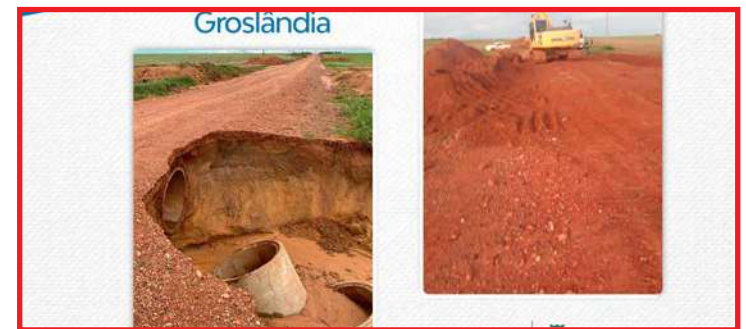
Linha 13 rompe drenagem, mas é restaurada pela Secretaria de Infraestrutura e Obras