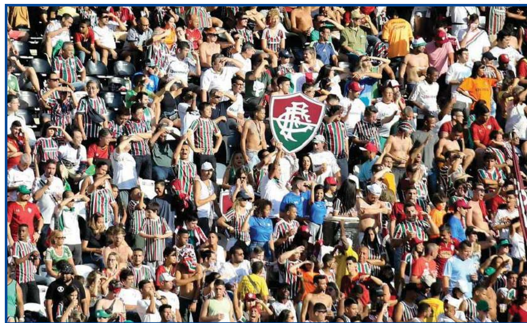
Torcida no Fluminense promete lotar o Nilton Santos

Não haverá venda de ingressos no Nilton Santos em nenhum dia. Na quarta-feira, a bilheteria do estádio só funcionará para a retirada de ingressos comprados pela internet. Os sócios terão disponíveis três modalidades de acesso ao estádio: a carteirinha de sócio, o E-Ticket e o ingresso tradicional. A retirada do ingresso em uma das bi-