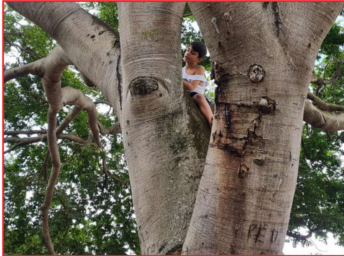
Uma das primeiras cenas foi gravada na árvore ao lado do Paço Municipal

Apoiam Mulheres - OSCs", a Secretaria de Assistência Social se reúne no Auditório dos Pioneiros no dia 9 com mulheres das Organizações da Sociedade Civil, às 19h.