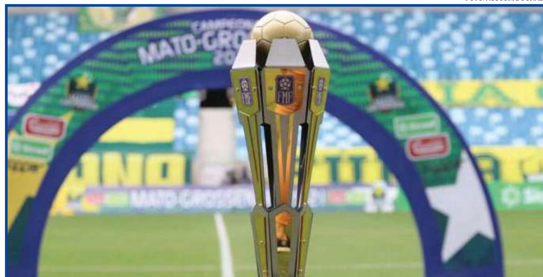
Duelos serão disputados nos próximos finais de semana

Confira os confrontos: no sábado (12), Dom Bosco x Cuiabá jogam às 15h30 no Estádio Dutrinha, enquanto União x Luverdense duelam no domingo (13), às 15h30, no Luthero Lopes. Os jogos de volta serão no sábado (19). Cuiabá x Dom Bosco, às 15h30, na Arena Pantanal, e Luverdense x União, às 19h, no Passo das Emas.