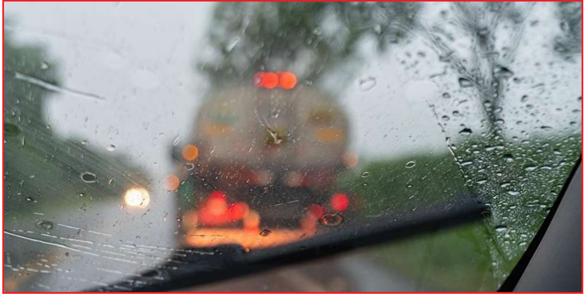
Motoristas devem redobrar atenção durante período de chuvas constantes