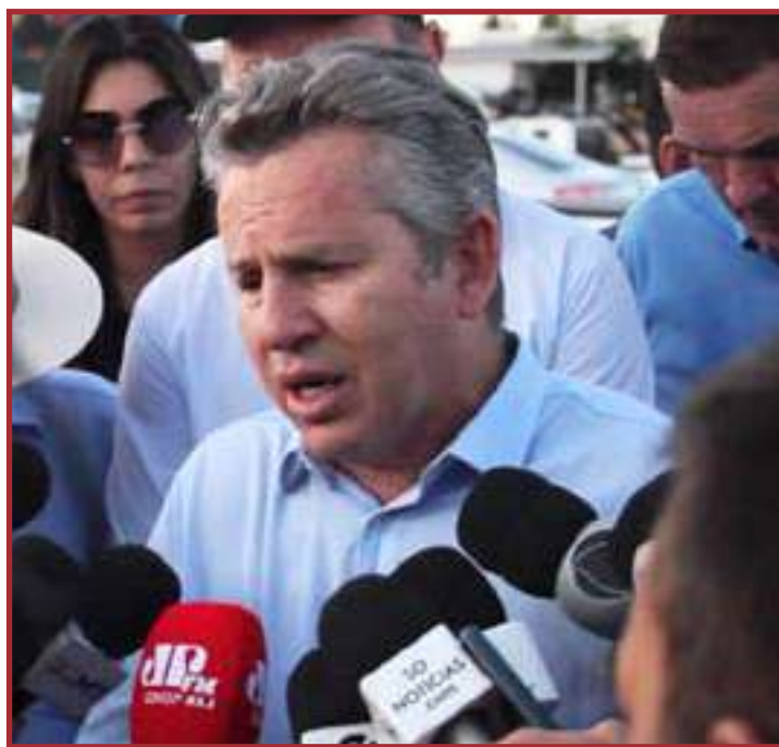
Governador classificou possibilidade como "piadinha"

Na próxima segunda-feira Emanuel Pinheiro se ausentará da prefeitura de Cuiabá até o dia 27 de março para estudar melhor a possibilidade de dar ou não continuidade na ideia de disputar o Palácio Paiaçuás. Já o seu principal desafeto político, o governador Mauro Mendes ao ser questionado em Sinop sobre sua candidatura à reeleição voltou a desconversar dizendo que está focado no atual mandato. "Fui eleito para administrar Mato Grosso, cuidar dos graves problemas que o estado tinha e tem, e trabalhei e trabalhamos muito no dia-a-dia e foi agindo assim que em três anos nós concertamos o estado. Vamos ter eleição em outubro, reconhecemos isso, e aí estou dialogando, vou dialogar com todas as forças e vou tomar a decisão se serei, ou não, candidato", concluiu.