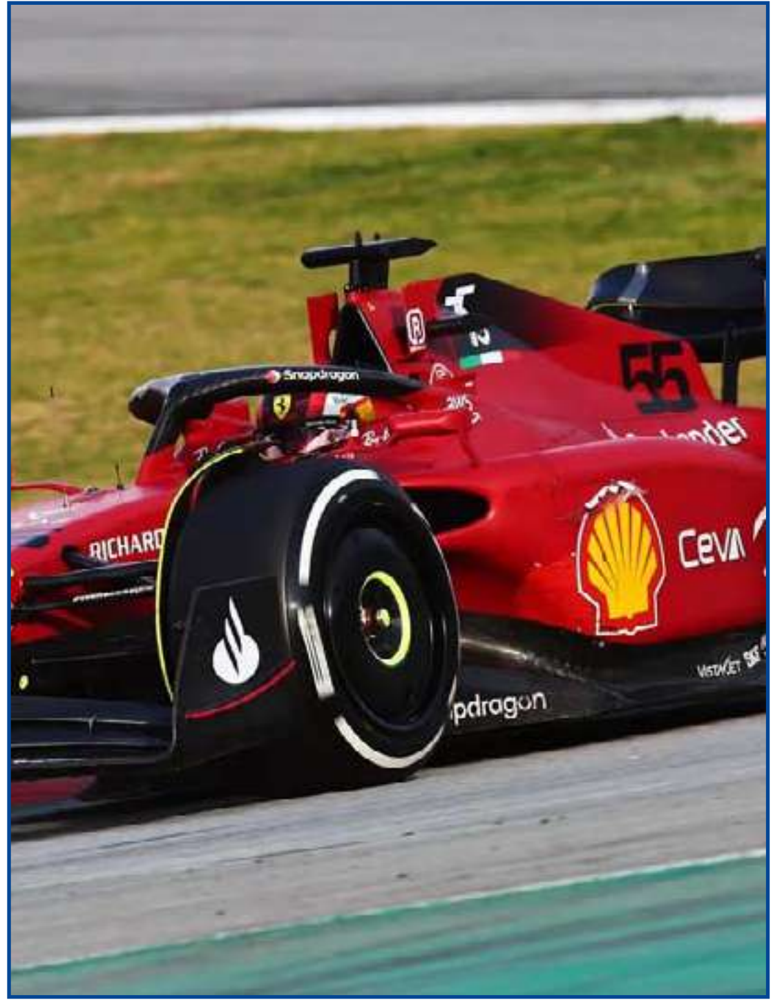
Equipes têm dificuldades de ficar no limite mínimo de 795 kg

Respostas que serão dadas a partir desta quinta. Fato é que, pelo que vimos em Barcelona, McLaren e Ferrari parecem ter uma tranquilidade