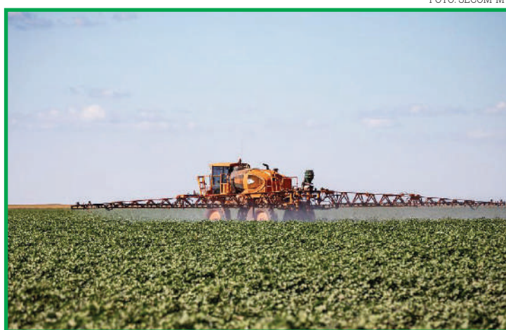
Estado também ocupa a 1ª posição em transparência das ações de combate ao desmatamento

tou ainda Mato Grosso como o 1º Estado em transparência das ações de combate ao desmatamento nos anos de 2020 e 2021. E em 3º em Potencial de Mercado, no âmbito nacional, neste mesmo período.