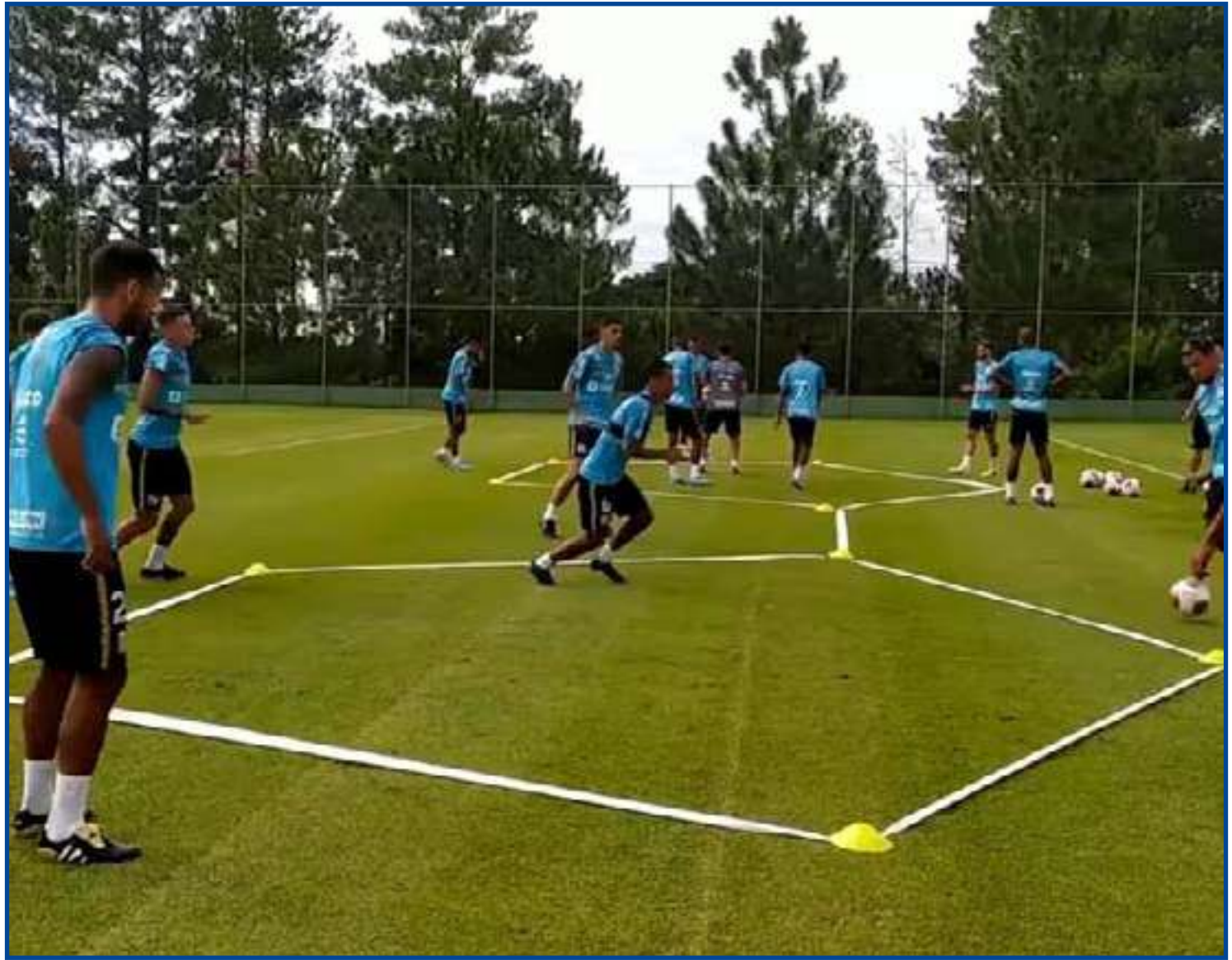
Santos treina para conquistar a terceira vitória no Estadual

O Santos faz novamente um Paulistão muito aquém do que se espera da grandeza do clube. Mesmo os sete títulos conquistados neste século não revigoraram a equipe, que lutou até a última rodada contra o rebaixamento no Estadual do ano passado e repete a cena nesta temporada. Com apenas DUAS vitórias em 10 jogos até agora no campeonato, o Peixe soma apenas 10 pontos e está entre a glória e o fracasso. Uma vitória hoje fora de casa coloca a equipe no G2 para enfrentar o RB Bragantino e, matematicamente, livra a equipe da queda, deixando a situação mais confortável para garantir a classificação na última rodada. Entretanto, uma derrota ou mesmo um empate ainda deixam a sombra das trevas até a rodada derradeira, em que pode sair tanto classificado quanto rebaixado – ineditamente – do Paulistão. O Peixe ocupa a terceira colocação do grupo D, com 10 pontos. O Bragantino é o líder, com 19, seguido pelo Santo André, com 12. Se vencer a Ferroviária, o Santos assume a segunda colocação da chave, além de afastar o risco de rebaixamento no estadual.