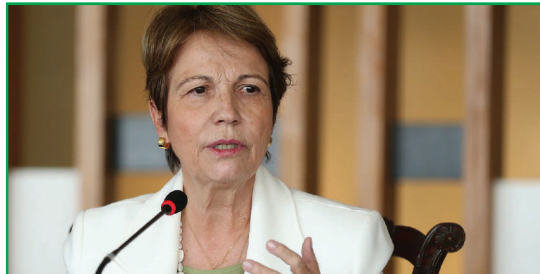
Ministra da Agricultura está em missão no Canadá

Tereza Cristina, que está em missão no Canadá desde o último fim de semana, disse, na postagem, que ainda hoje terá uma série de reuniões para tratar da importação de fertilizantes pelo Brasil. Como quarto consumidor global de fertilizantes,