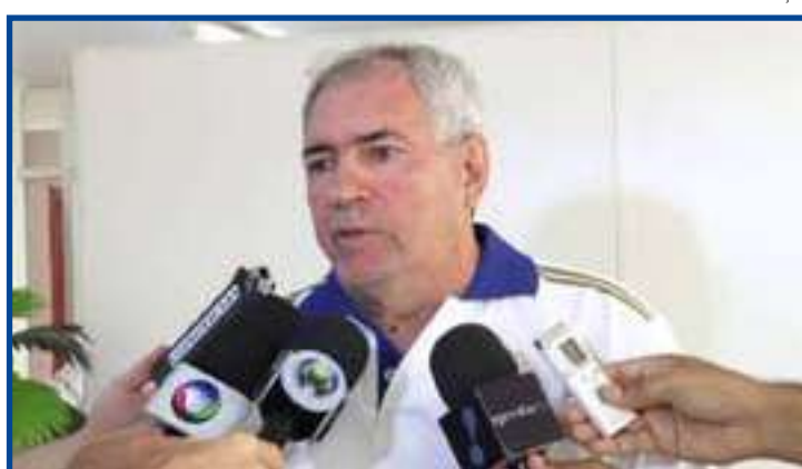
Birigui retorna ao clube onde levantou a taça do Estadual em 2007

O treinador soma passagens por União Rondonópolis, Dom Bosco, Sinop, Poconé, Mixto, Sorriso e Sport Sinop, seu último clube antes de fechar com o Cacerense para esse retorno.