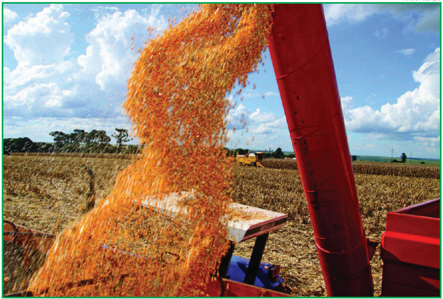
Grãos para produção de etanol não faltará

O cereal é considerado o pilar da transformação da proteína vegetal em proteína animal abastecendo granjas suínas e de aves, confinamentos de bovinos, a caprinocultura e a ovinocultura. Cultivado em rotação de cultura com a soja, o milho aumenta a lucratividade do produtor rural por hectare, além de contribuir para a melhoria do solo, graças ao avanço agrônomo, que é empregado pelos produtores, independentemente do tamanho de suas áreas cultivadas.