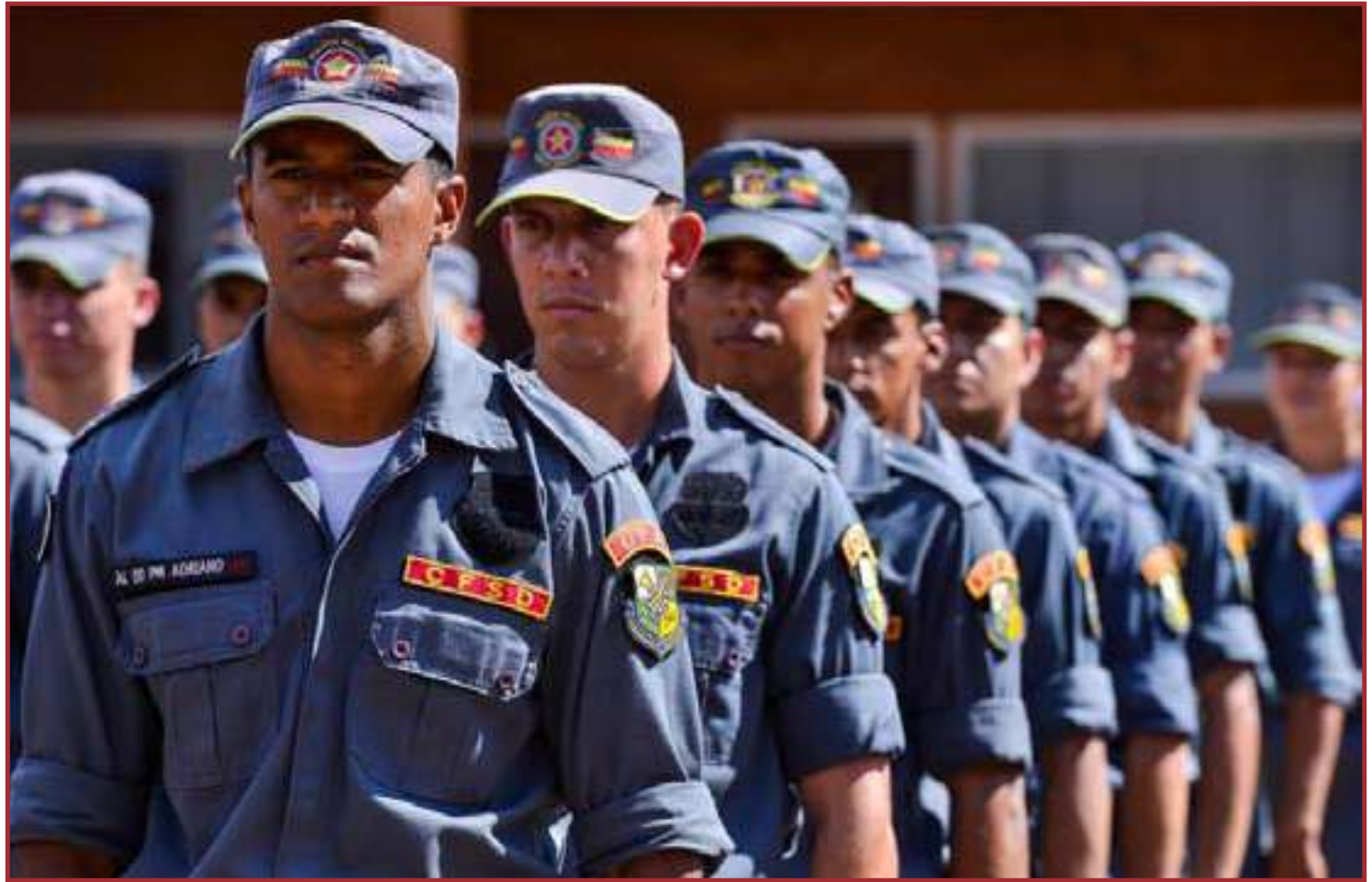
O concurso realizado foi para a formação de cadastro de reserva

Para a Polícia Militar e o Corpo de Bombeiros Mil-