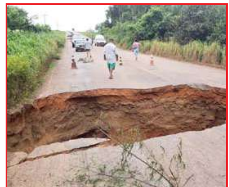
Asfalto cedeu e cratera foi aberta na MT-423