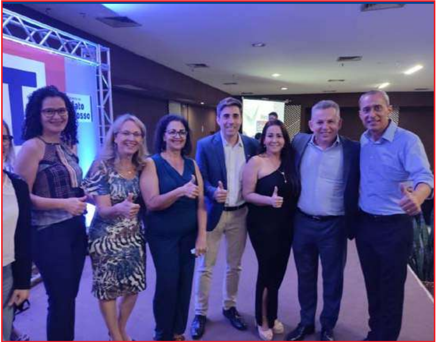
Prefeito ao lado do governador em cerimônia

O programa Alfabetiza MT foi lançado pelo Governo de Mato Grosso em 2021 e, ao todo, serão investidos R$ 16.500.850,00 em recursos próprios, por meio do Programa Mais MT. Ele é inspirado no Programa de Alfabetização na Idade Certa (PAIC) do Ceará.