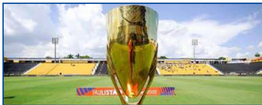
Seis das oito partidas são antecipadas; apenas Corinthians e São Paulo jogam domingo

Veja como ficou a tabela da última rodada. No sábado, Santo André x Inter de Limeira; Ferroviária x Mirassol; Ponte Preta x Ituano; Santos x Água Santa; São Paulo x Botafogo; São Bernardo x Guarani. No domingo, Novorizontino x Corinthians; RB Bragantino x Palmeiras.