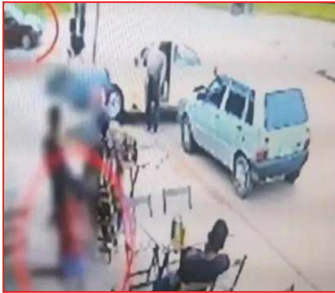
Pais da menina registraram boletim de ocorrência do fato

Segundo o pai, na hora pessoas que estavam no bar tentaram perseguir o suspei-