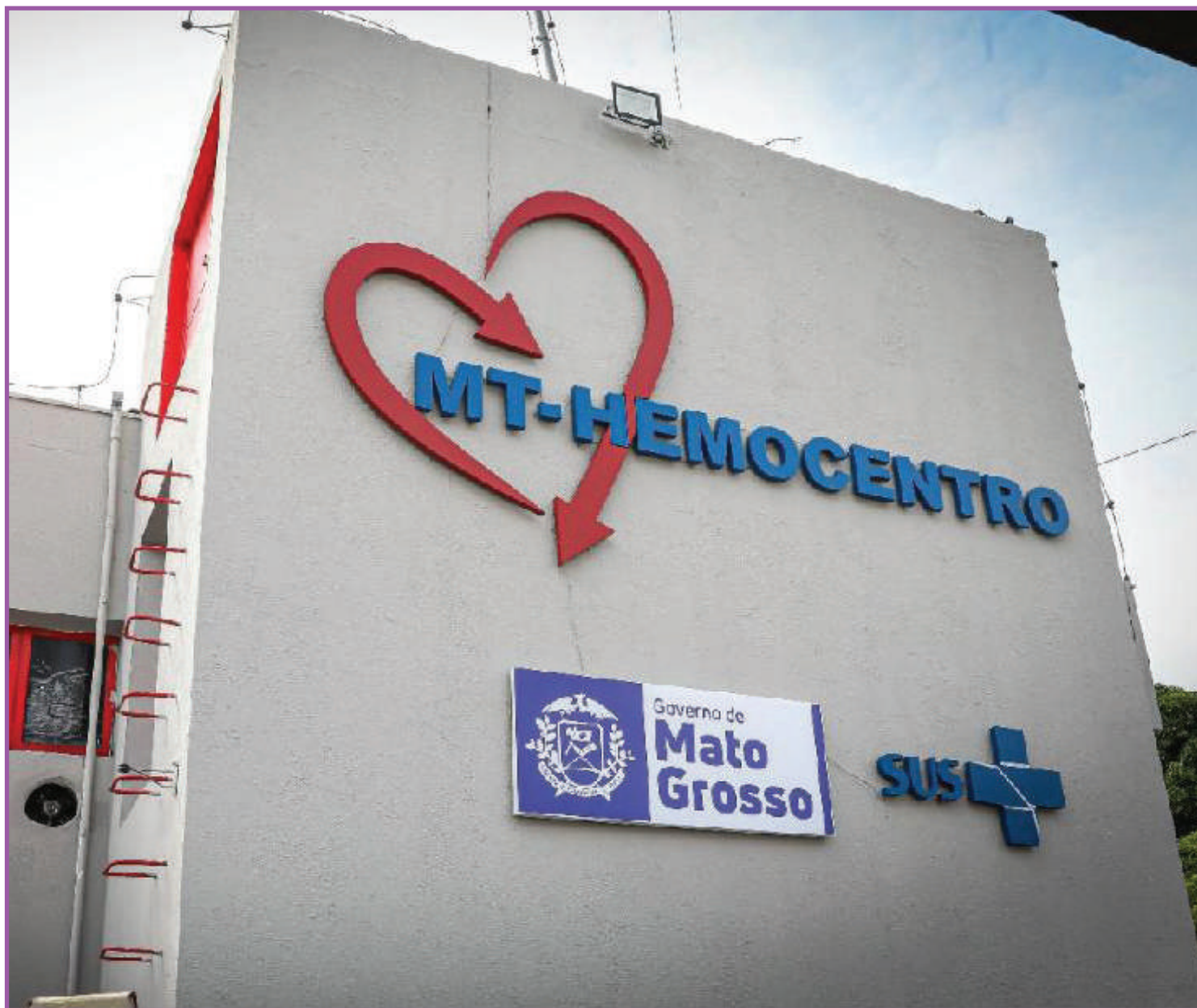
Governo do Estado está investindo R$ 19,2 milhões na construção da nova sede

"A PM toda se mobilizou nessa missão. Essa campanha já ultrapassou os limites da baixada cuiabana e os comandos regionais do interior já estão empenhados em formar uma rede de doadores permanentes para que possamos sempre doar