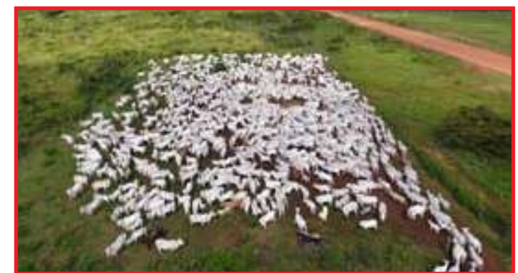
Arrendamentos de terra para criação de gado rendia cerca de R$ 90 mil por mês