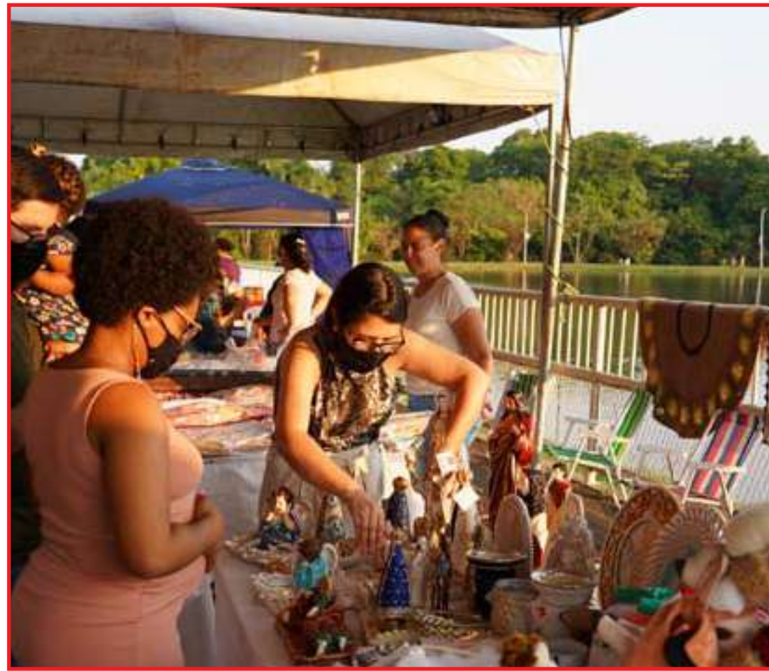
Eventos gratuitos serão realizados sábado e domingo, a partir das 16h

A Casa do Artesão, um dos pontos turísticos de Lucas