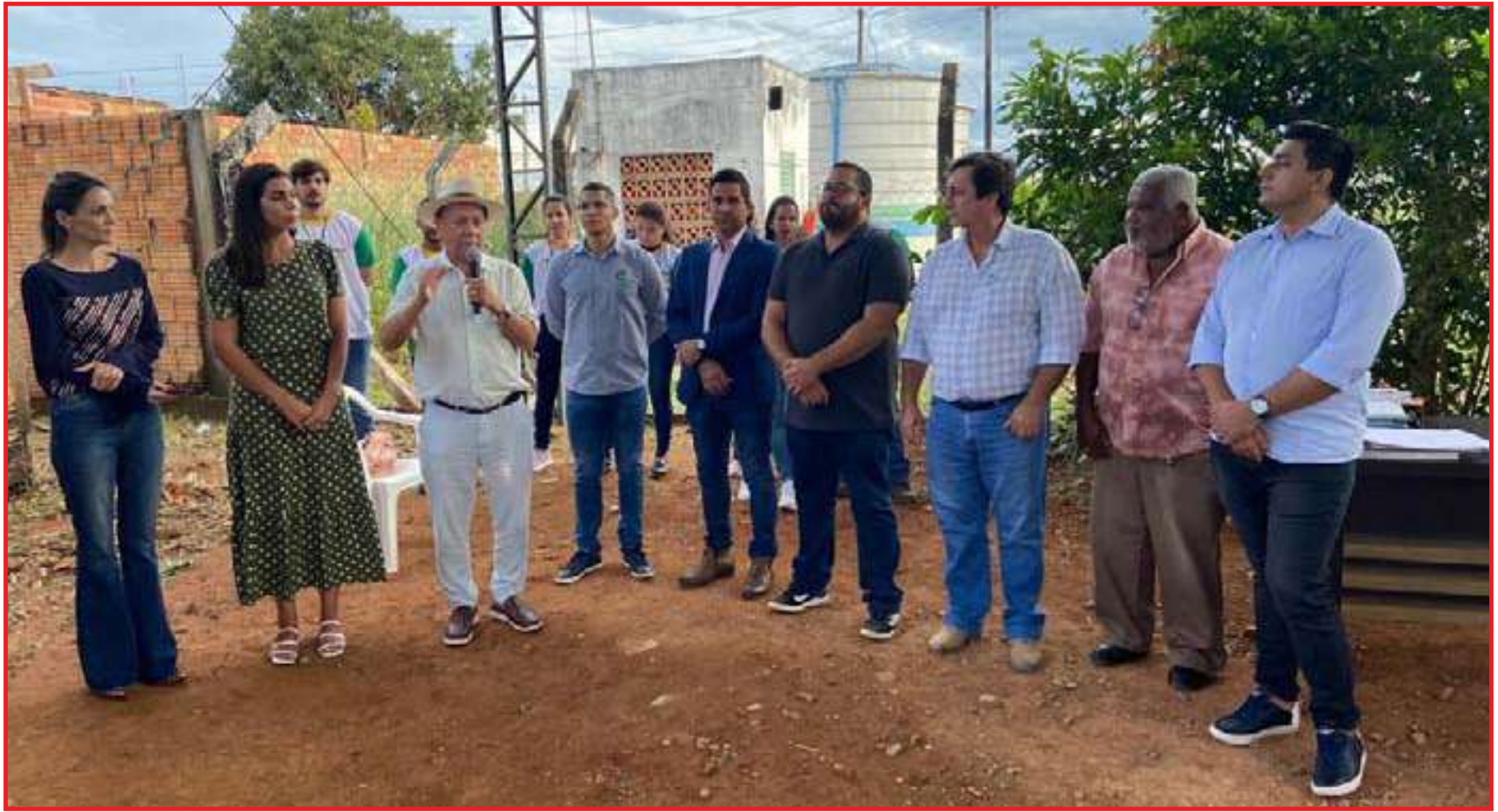
Prefeito e vereadores participaram de reunião no Jardim do Ouro