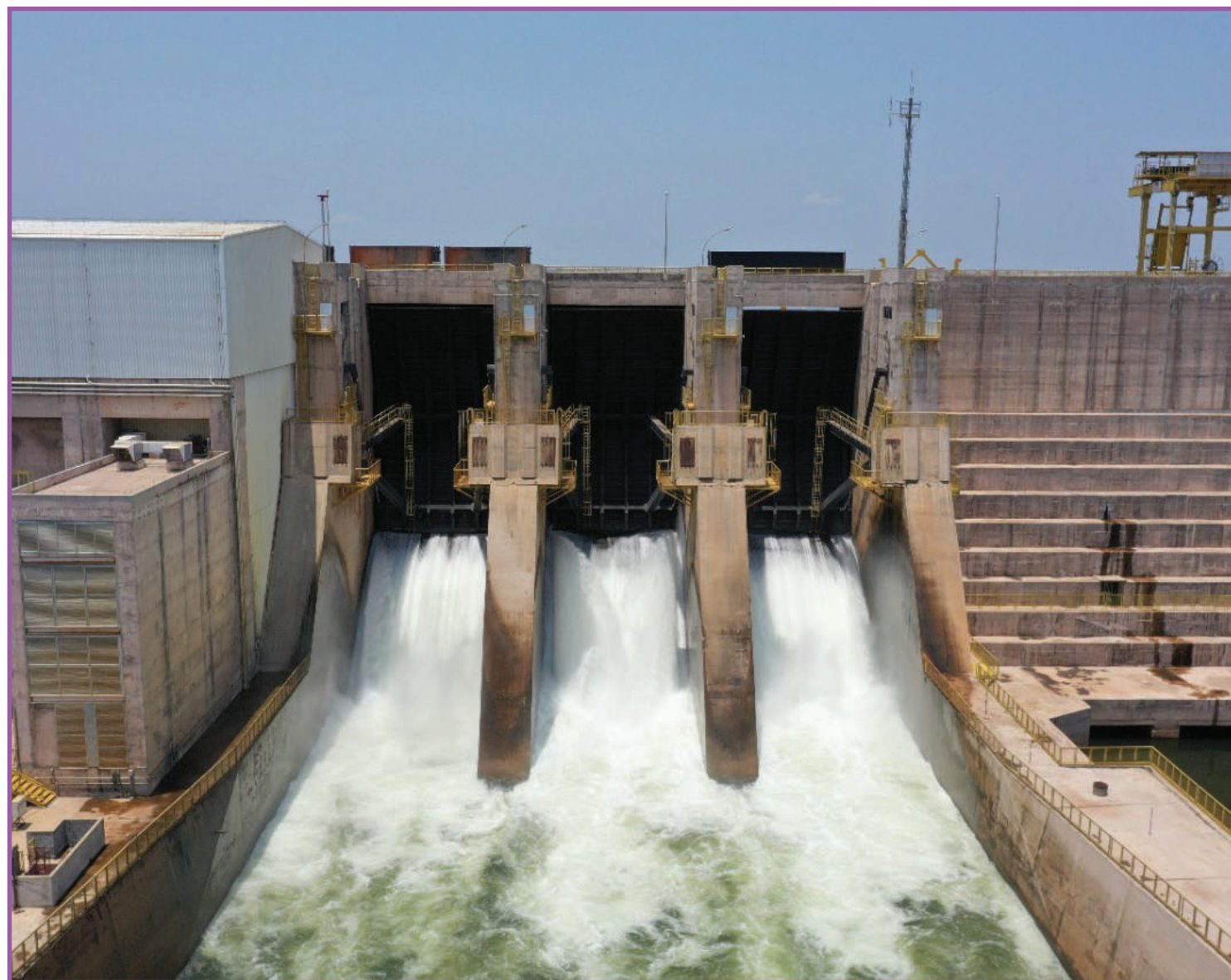
Parte dos investimentos foi para municípios vizinhos ao empreendimento

O pagamento dos royalties da água está diretamente ligado à produção de energia. O valor pago pela UHE Sinop cresceu