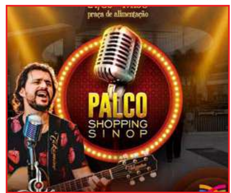
Shopping terá atração cultural nesta quinta