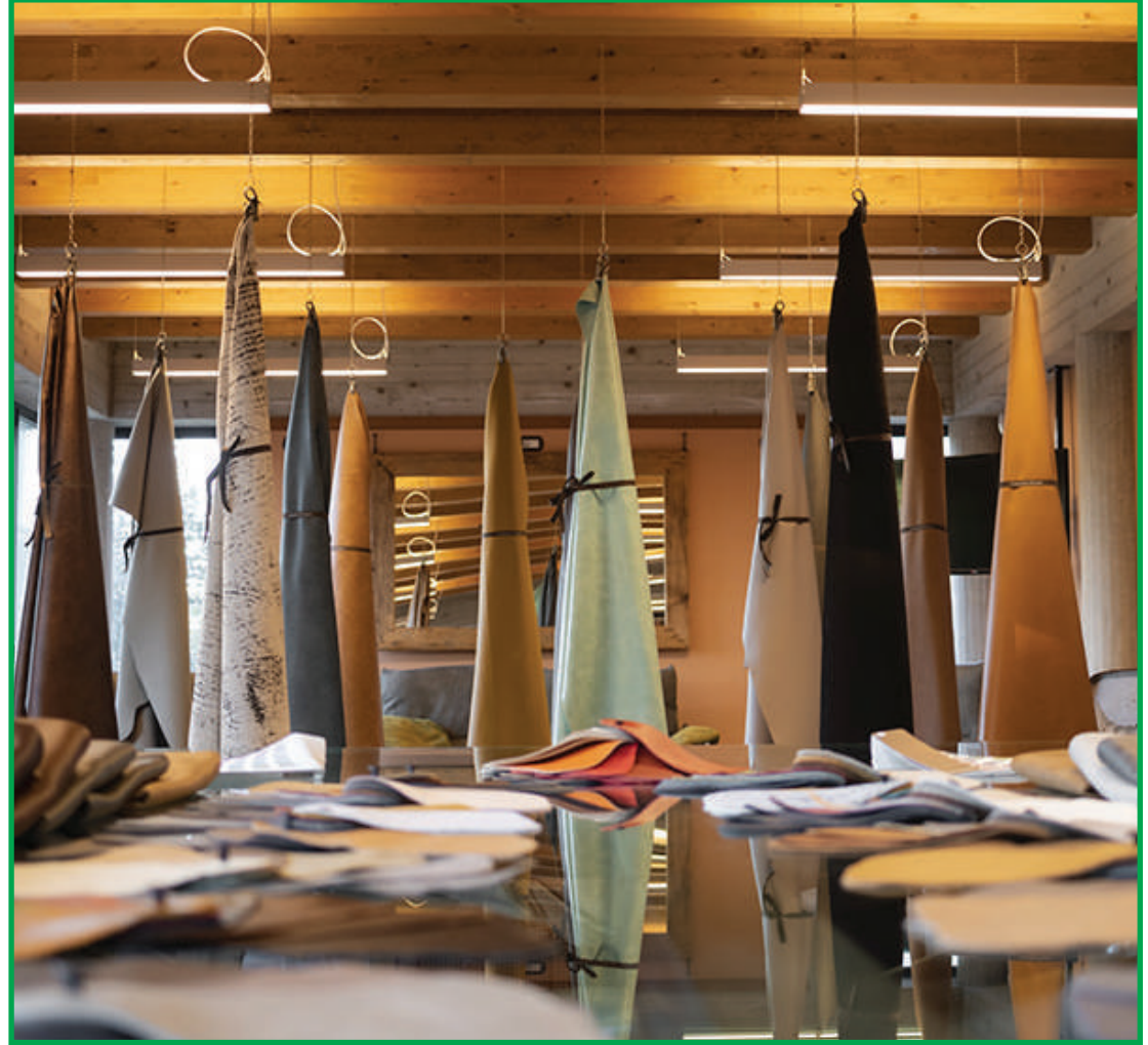
Objetivo da ação é fortalecer o conceito Kind Leather entre os profissionais de mercado

A JBS Couros é a maior indústria de processamento de couros do mundo, com 21 unidades produtivas, três unidades de corte, cinco centros de distribuição, três showrooms e quatro escritórios comerciais, em quatro continentes. Atualmente, a empresa conta com cerca de 7 mil colaboradores em todo o mundo e produz couros nos estágios wet blue, semiacabado e acabado para os setores automotivo, moveleiro, de calçados e artefatos. Nas linhas de processamento de couros, os procedimentos claros e padronizados, aliados a investimentos constantes em tecnologia e capacitação, fazem da JBS Couros uma das empresas mais modernas do mundo, transformando materiais orgânicos em produtos nobres e de qualidade, amplamente usados nas indústrias globais.