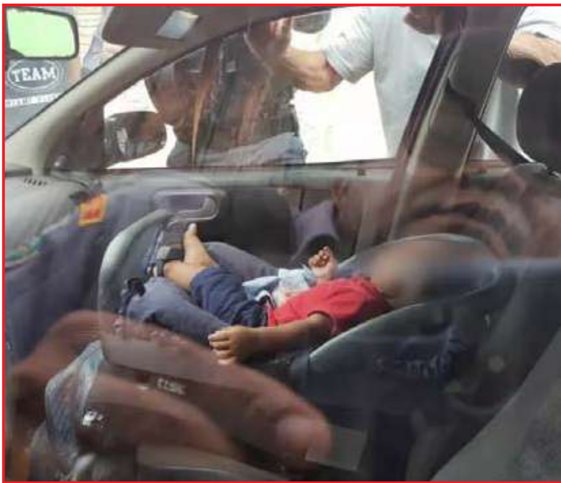
Menino estava na cadeirinha do banco da frente do automóvel

agentes procuraram por um chaveiro na cidade, mas ele não estava na região.