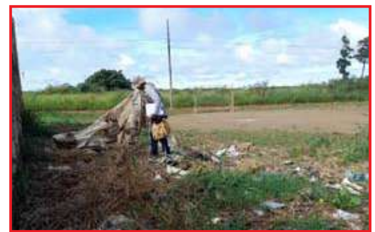
Mutirão foi realizado no Jardim do Ouro