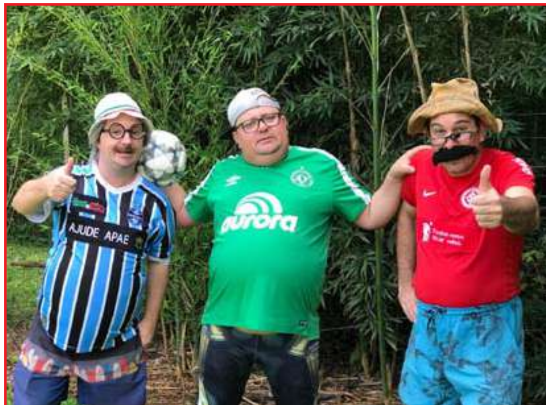
Humoristas vão se apresentar em quatro cidades no sul do país

A turnê segue pela cidade de Xaxim/SC, onde na quarta (27), os humoristas atendem ao pessoal da Rádio Amiga que estará de aniversário. Parte da renda do evento vai para a Rede Feminina de