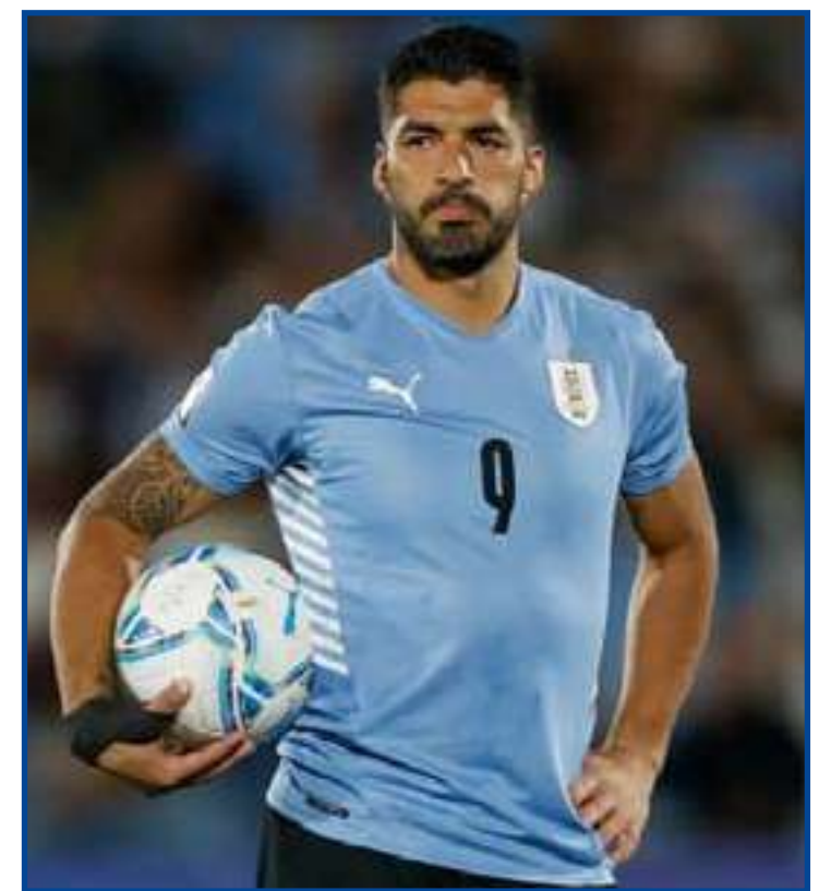
Uruguai de Luis Suárez pode garantir vaga em mais uma Copa