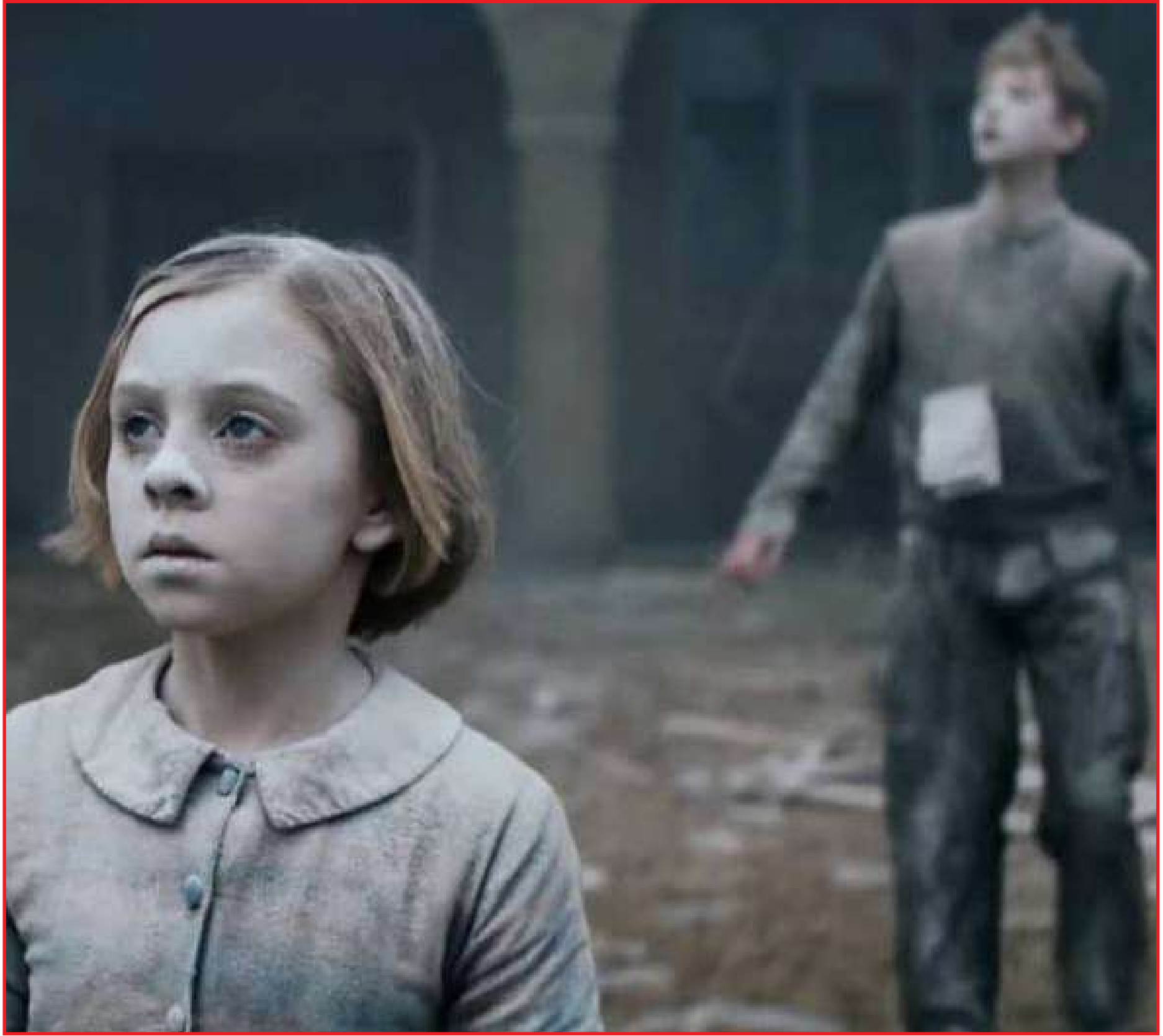
O Bombardeio traz trágica história da 2ª Guerra Mundial

Em meio ao bombardeio, uma aeronave britânica atingiu um poste, o que causou danos na asa do avião, o que fez com que ele colidisse contra a escola Jeanne d'Arc. Para piorar, diversos outros bombardeiros confundiram a escola como um dos alvos. Isso resultou na morte de 125 civis, 18 desses eram adultos, muitas freiras e 86 crianças. O Bombardeio está disponível na Netflix.