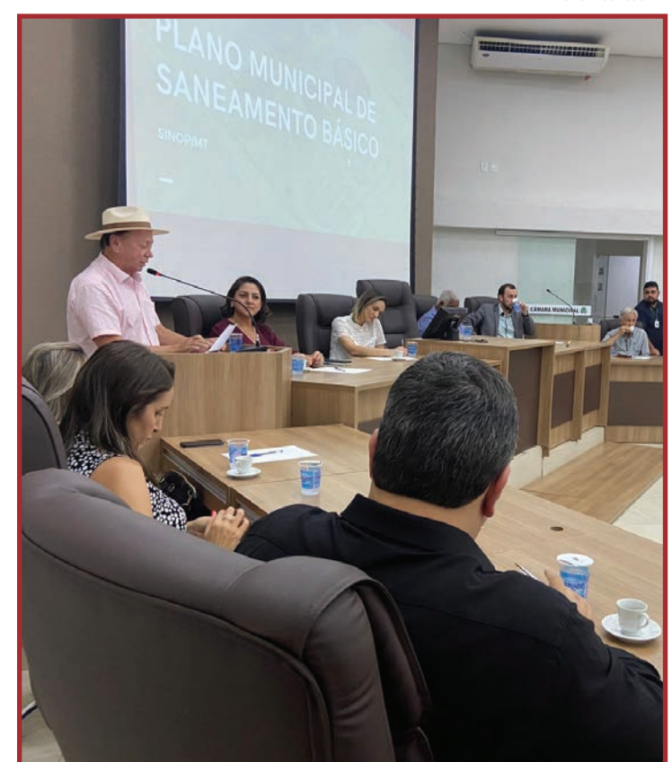
Nos próximos dias será finalizada a parte técnica