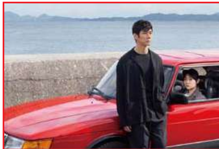
No filme de Ryūsuke Hamaguchi, a ficção é a graça redentora de um mundo cruel

Todos esses personagens estrelam momentos em que desenrolam as trajetórias trágicas que os levaram até o lugar onde os conhecemos. Hamaguchi é fascinado (não de hoje, como os fãs de seu cinema podem comprovar) com o simples ato de observar humanos falando de si mesmos, e encontra infinita variedade e dinamismo nessas cenas quase monológicas. Por exemplo: Takatsuki conta a última história escrita por Oto para Kafuku dentro do carro durante uma viagem noturna, em uma sequência claus-