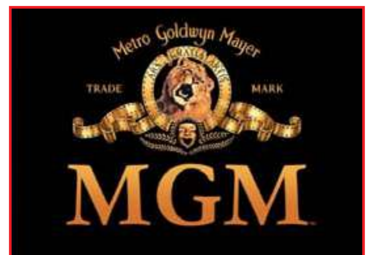
Estúdio centenário é dono de grandes franquias do cinema