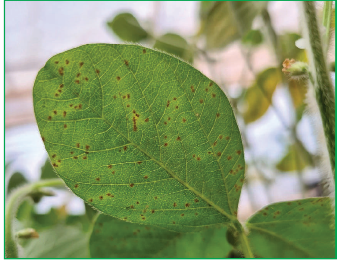
Ferrugem Asiática reduziu o prejuízo sobre a produtividade nas lavouras

Além disso, a especialista afirma que a concentração da semeadura no início do período autorizado, lança mão da estratégia de escape. Na safra 21/22, de acordo com os dados do IBEA, em 26 de