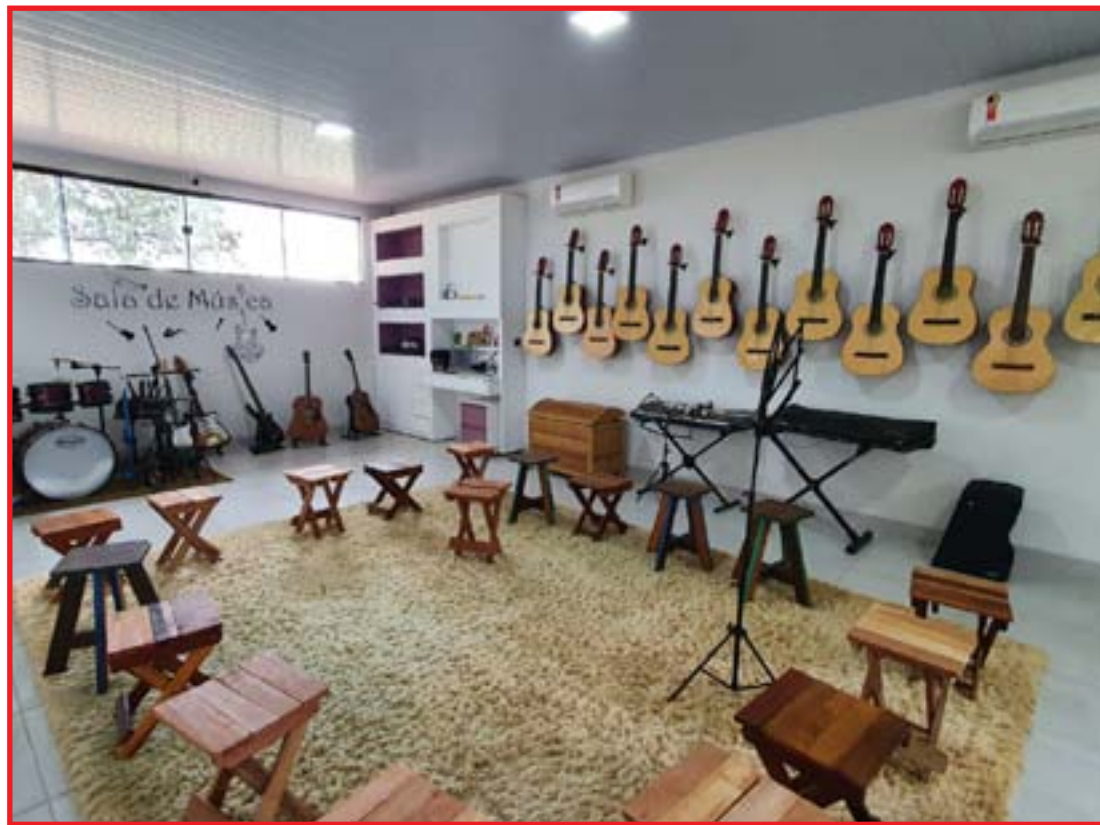
Projeto fortalece cultura em diversos pontos da cidade

O pontapé inicial do "Clube Cultural" ocorreu no Centro Social Menino Jesus, na oportunidade, foram desenvolvidas aulas de musicalização e teatro para as crianças, e no decorrer dos próximos meses serão levadas apresentações culturais, desenho e pintura para complementar as atividades. Nesta instituição o projeto será realizado todas as se-