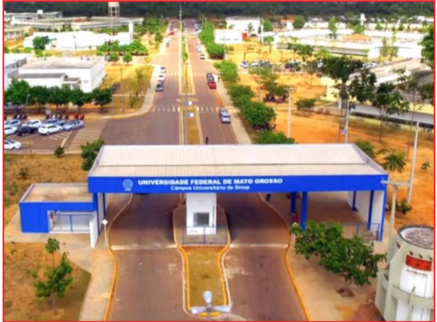
Em fevereiro, o STF decidiu, em plenário, que as universidades podem exigir a comprovação

A universidade abriu nesta semana um espaço no site institucional para