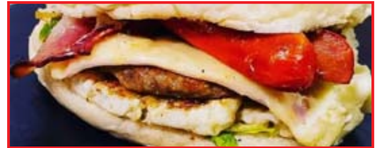
Baguncinha agora faz parte da cultura de Cuiabá, disse vereador

O preparo do lanche é feito na chapa com combinações de sabores, contendo pão, hambúrguer, ovos, queijo, presunto, alface, tomate, salsicha, bacon e calabresa. Para o autor da proposta, "a maionese temperada traz um sabor inigualável de degustação".