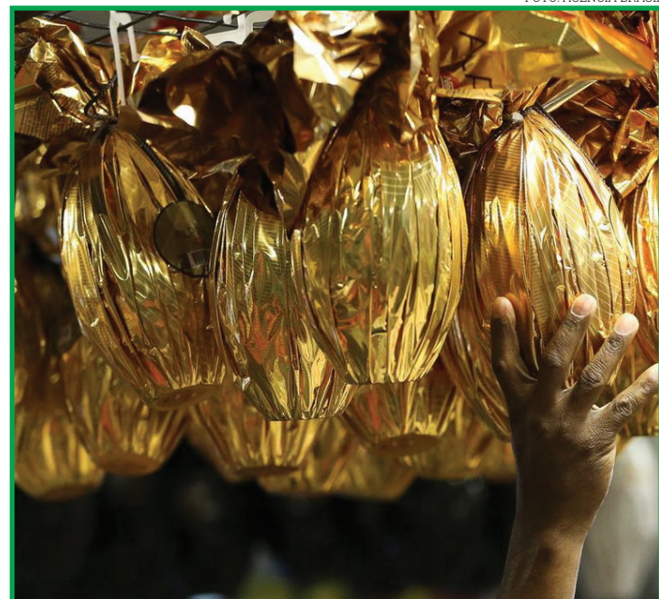
Facilidade de participação no mercado é atrativa para empreendedores