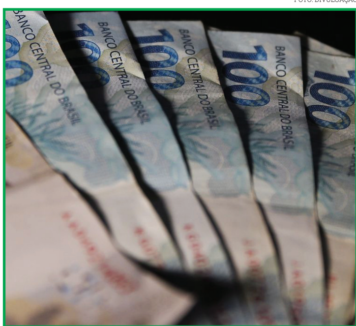
Em 2020, o mesmo indicador tinha atingido 31,76%

Todo mês de março, o Tesouro divulga uma estimativa própria da carga tributária do ano anterior.