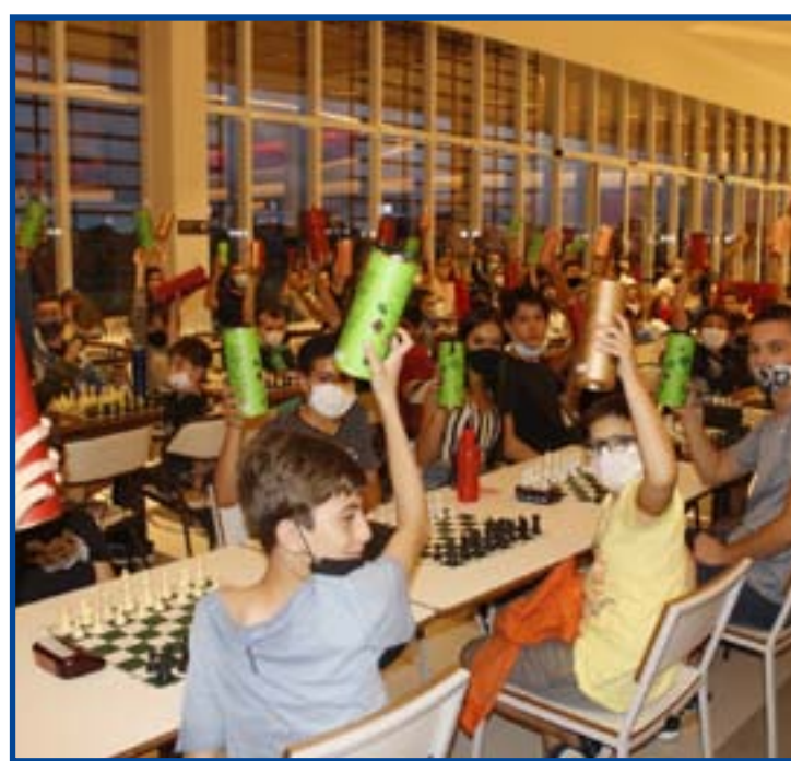
Evento será realizado no próximo sábado