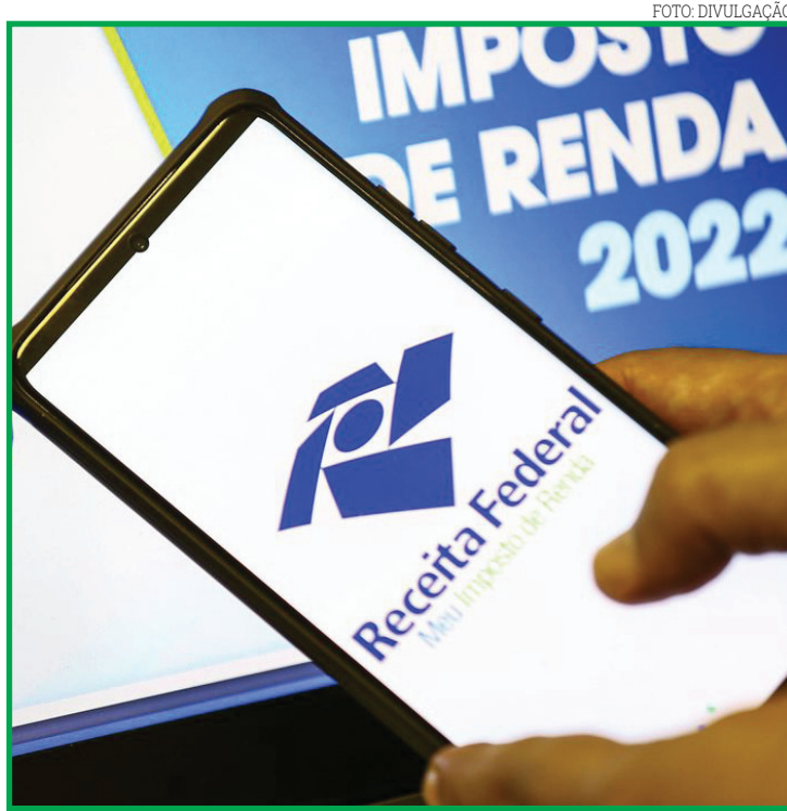
Instrução Normativa com nova data foi publicada no DOU

A Instrução Normativa de hoje mantém o cronograma para a restituição dos cinco lotes aos contribuintes. O primeiro está previsto para 31 de maio. Os segundo e terceiro lotes serão restituídos no dia 30 de junho e de julho. O quarto lote está previsto para 31 de agosto; e o quinto, para 30 de setembro.