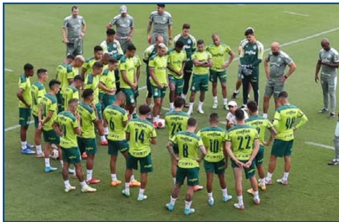
Verdão estreia na competição sul-americana nesta quarta, contra o Deportivo Táchira

A estreia do atual campeão na Libertadores será nesta quarta (6), contra o Deportivo Táchira, às 20h, na Venezuela. Os outros rivais do Grupo A são Emelec, do Equador, e Independiente Petrolero, da Bolívia.