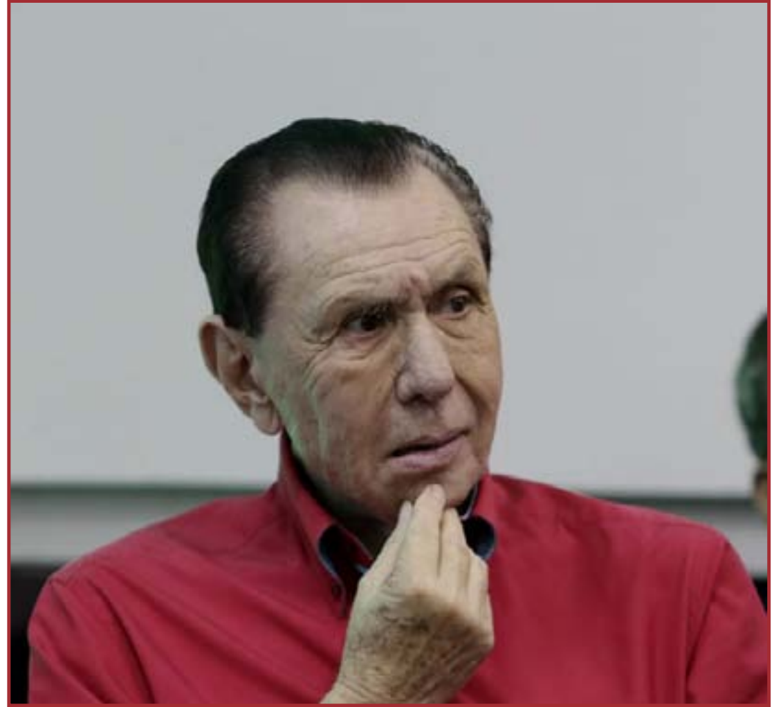
Ele foi apontado como o verdadeiro responsável pelas irregularidades