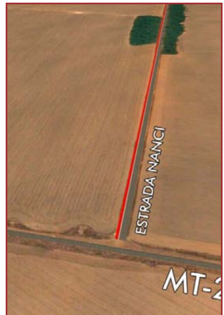
O investimento é de R$ 33 milhões