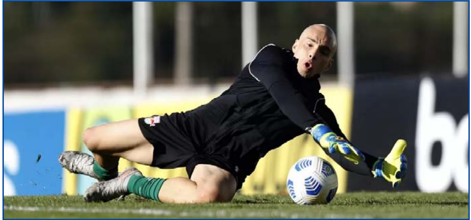
Julio Cesar é o jogador com mais participações na Libertadores