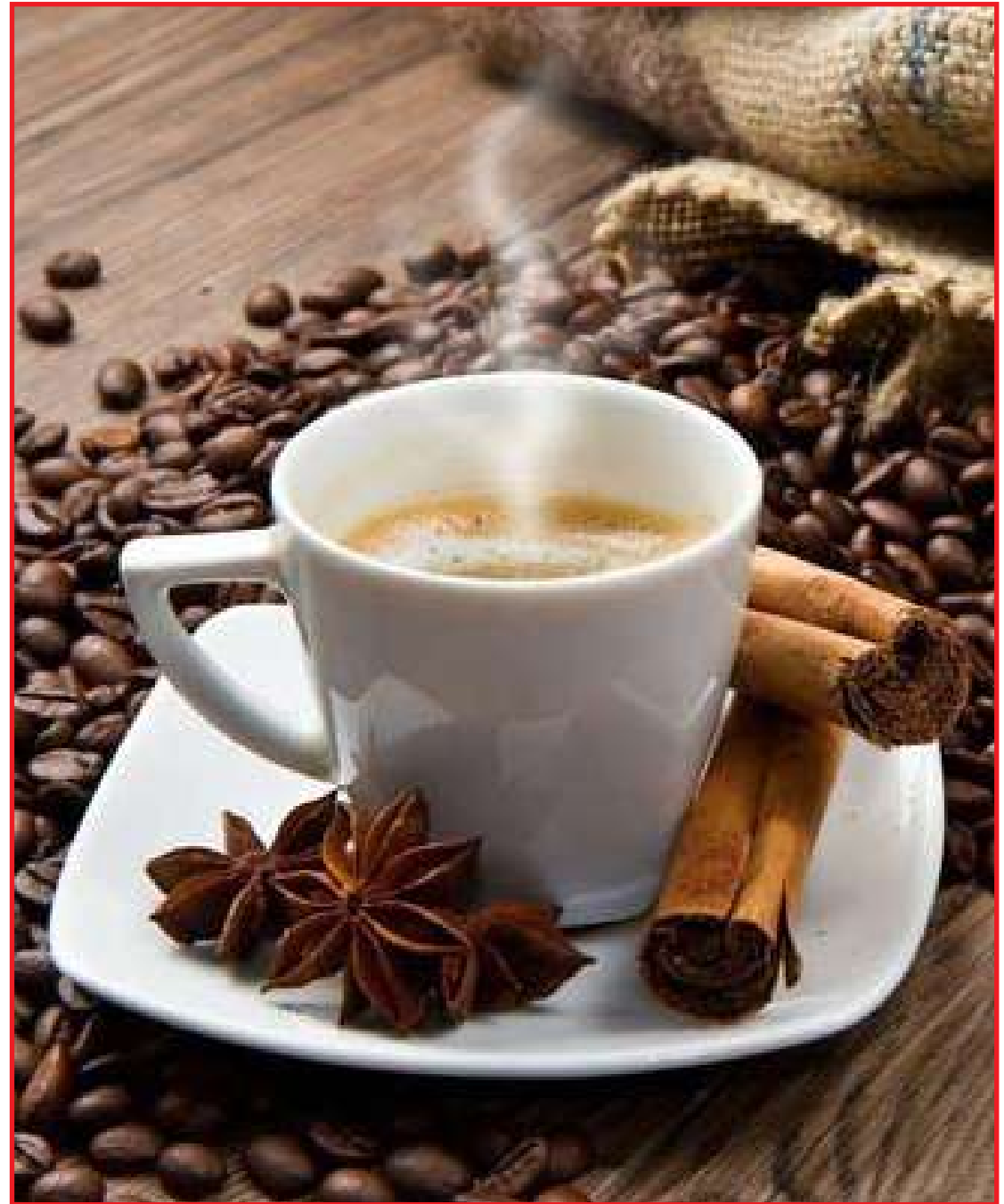
Na mesa do café da manhã, depois da refeição, no meio da tarde

O grande segredo para o consumo saudável do café, é o equilíbrio. Segundo pesquisas, o consumo seguro diário indicado é de 400 mg. A indicação é não adoçar, assim você garante o sabor e aroma originais. É importante lembrar que o alto consumo de açúcar pode gerar aumento de peso, diabetes, colesterol, triglicérides, desregular o funcionamento do intestino e aumentar o cansaço físico.