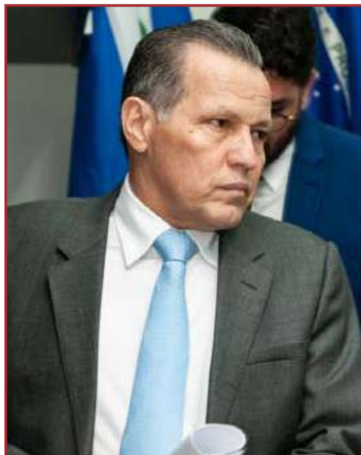
Ação apura suposto esquema de concessão de benefícios fiscais irregulares a JBS/Friboi

“Na medida em que embora a sentença prolatada não encerre definitivamente a relação processual, pois se firma na homologação de Termo de Ajustamento de Conduta celebrado entre as partes, a suspensão de sua tramitação até o adimplemento da obrigação instituída no acordo é medida que se impõe”.