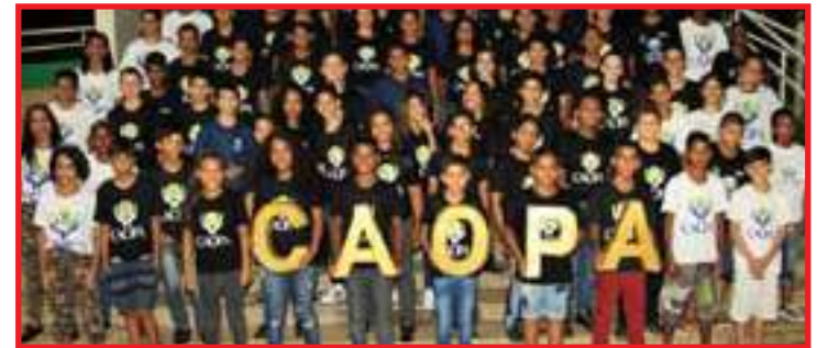
100 famílias serão beneficiadas