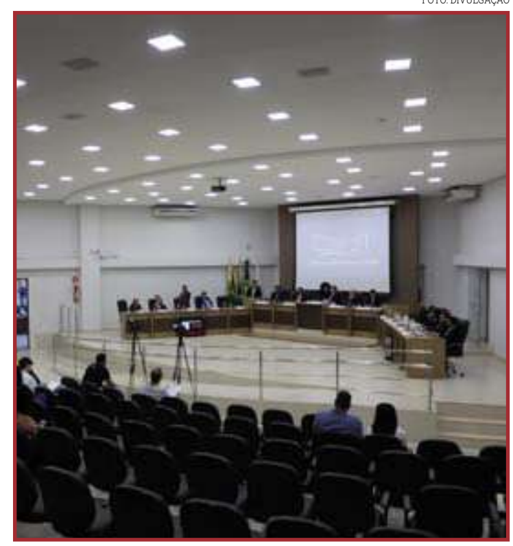
Projeto adequa a ouvidoria à lei federal nº 13.460/2017

A medida visa garantir o acesso e a inclusão dos menores com dificuldade em acessar brinquedos comuns.