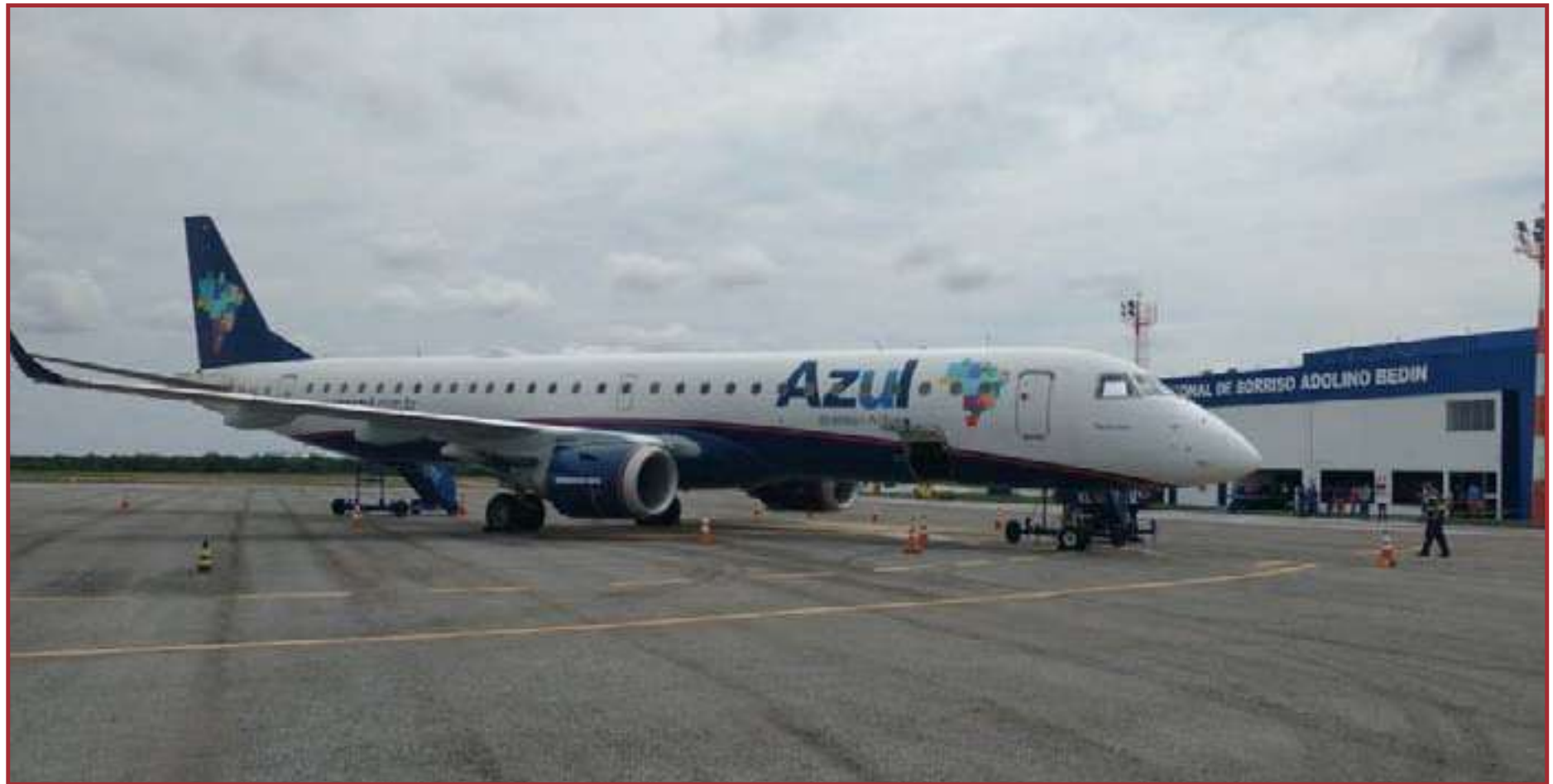
A Infraero assumiu a Administração do aeroporto em janeiro

mos uma reunião on-line com as equipes técnicas da Azul e da Infraero, e, novamente os técnicos da Azul ressaltaram a conduta correta do piloto: seriam mais de 100 vidas (eram 105 passageiros) a bordo; não