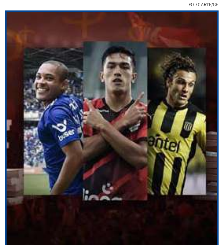
Furacão tem trio mais caro da sua história

Grêmio Anápolis, Anápolis e Brasiliense. Os quatro melhores de cada chave avançam para o mata-mata.