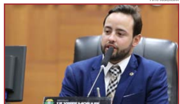
Em requerimento, cobra providências do governo em relação esse ajuste