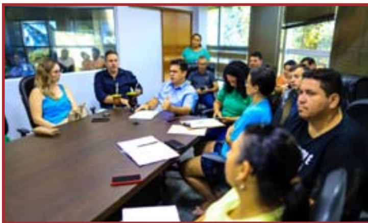
Administração propôs ainda nova rodada de negociações em setembro