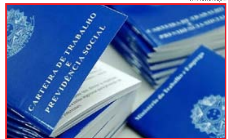
Empresas exigem uma qualificação imediata que falta nos trabalhadores