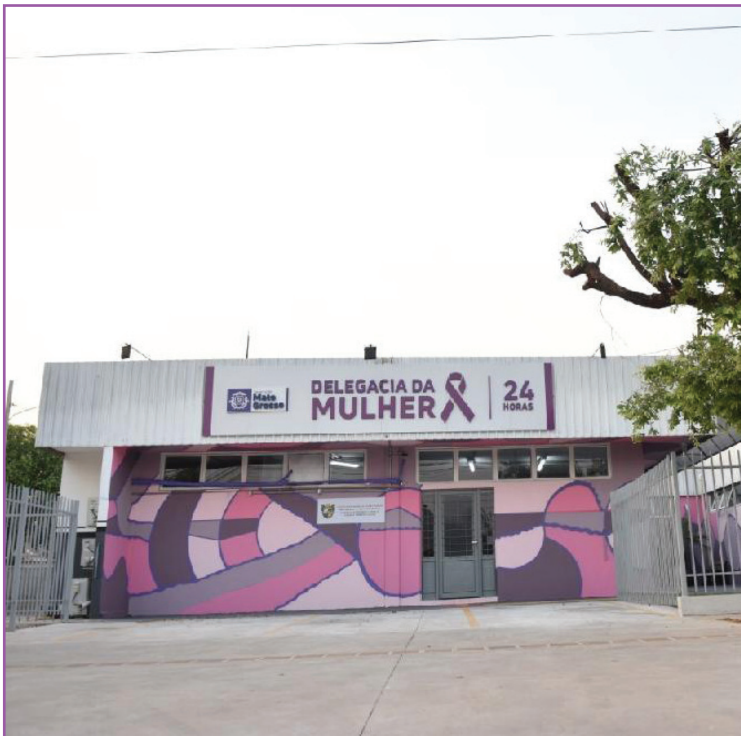
Estado contabiliza ainda diminuição nos números de ameaça e injúria

Além disso, a Sesp também adotou como medida o site E-Denúncias, que pode ser realizado para qualquer tipo de denúncia. O diferencial é que a denúncia pode ser feita anonimamente, com espaço para anexos como fotos, vídeos, áudios, etc. Ainda há os disque-denúncias 197 (Capital) e 181 (interior) ou 190 para ocorrências em andamento. Eles funcionam 24 horas por dia, sete dias da semana.