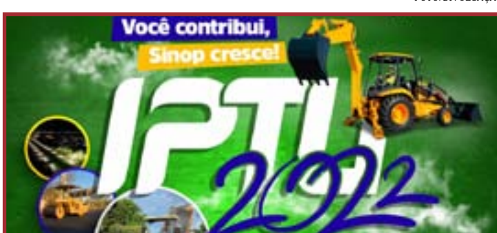
Os boletos estão disponíveis para retirada online ou presencial

São aproximadamente 92 mil imóveis tributados em