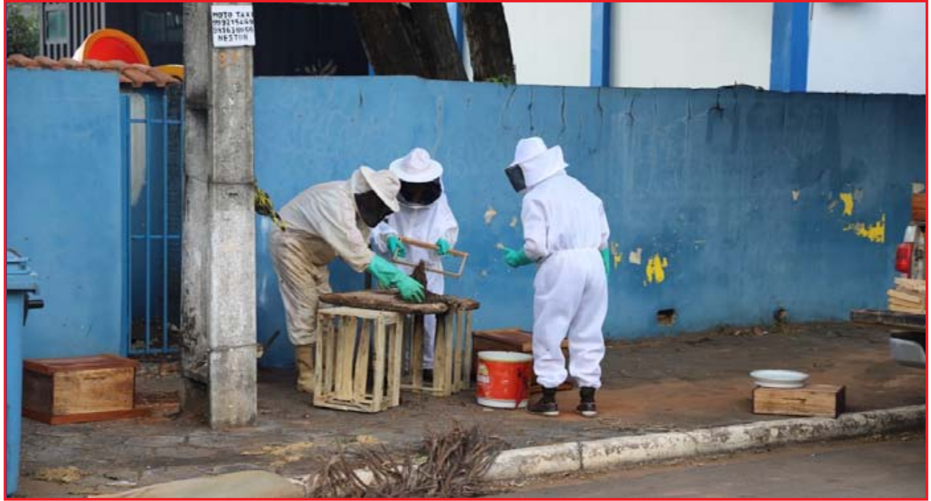
Enxame foi retirada de uma escola na última semana