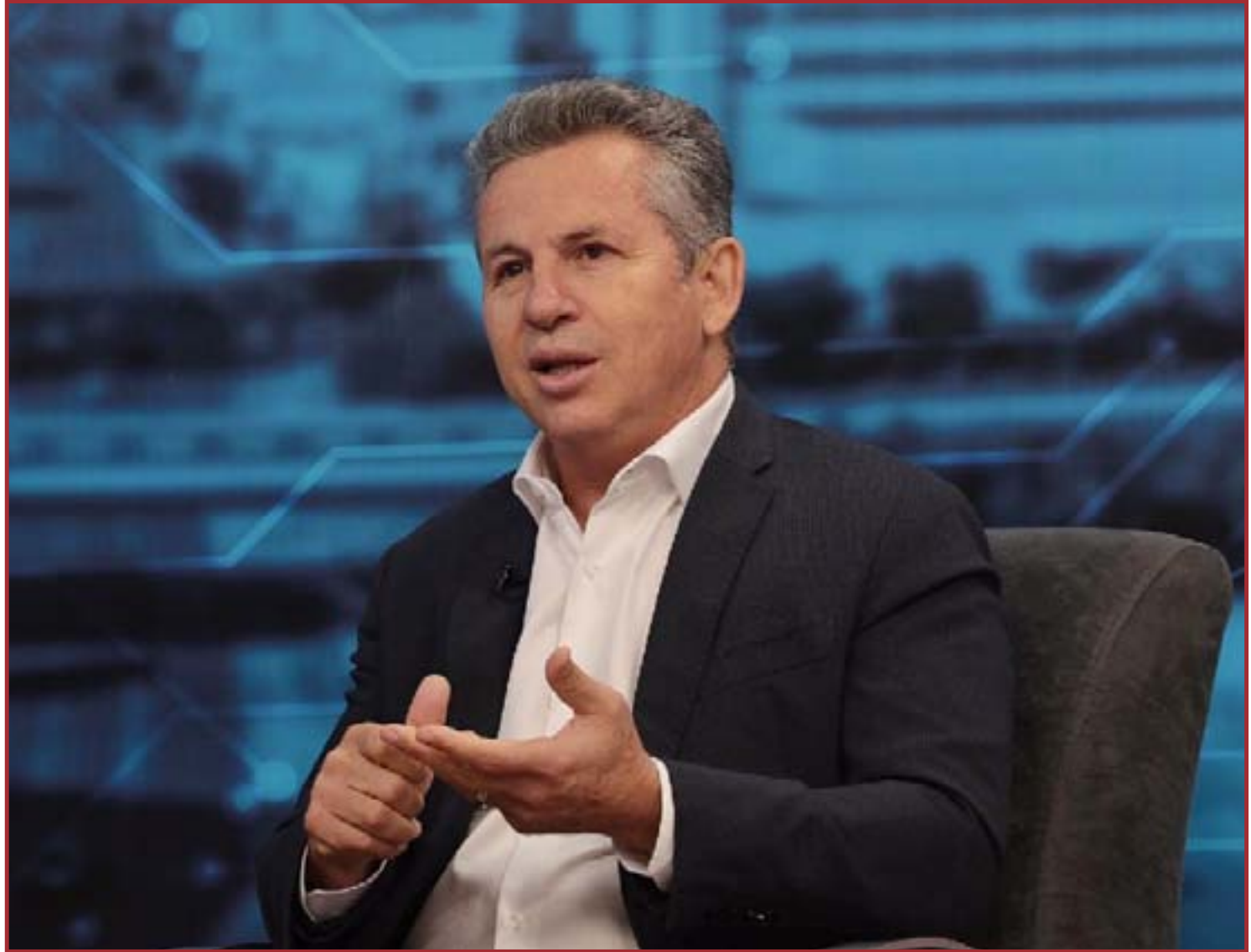
Mendes falou das obras e ações que beneficiam a população mais vulnerável

Os programas voltados à área social, liderados de forma voluntária pela primeira-dama Virginia Mendes junto com a Secretaria de Estado de Assistência Social, também foram destacados pelo governador. "Quando o governo distribui mais de 1 milhão de cestas básicas, isso é cuidar dos que mais precisam, e nunca foi entregue uma quantidade como essa. Uma cesta básica é pouco para quem tem dinheiro, mas para muitas pessoas é necessário. O auxílio que o Governo fornece para mais de 100 mil famílias compreendem alimentos também tem sido de grande importância, ainda mais nesse momento em que passamos pela pandemia e a inflação tem dificultado a vida de quem ganha menos", completou.