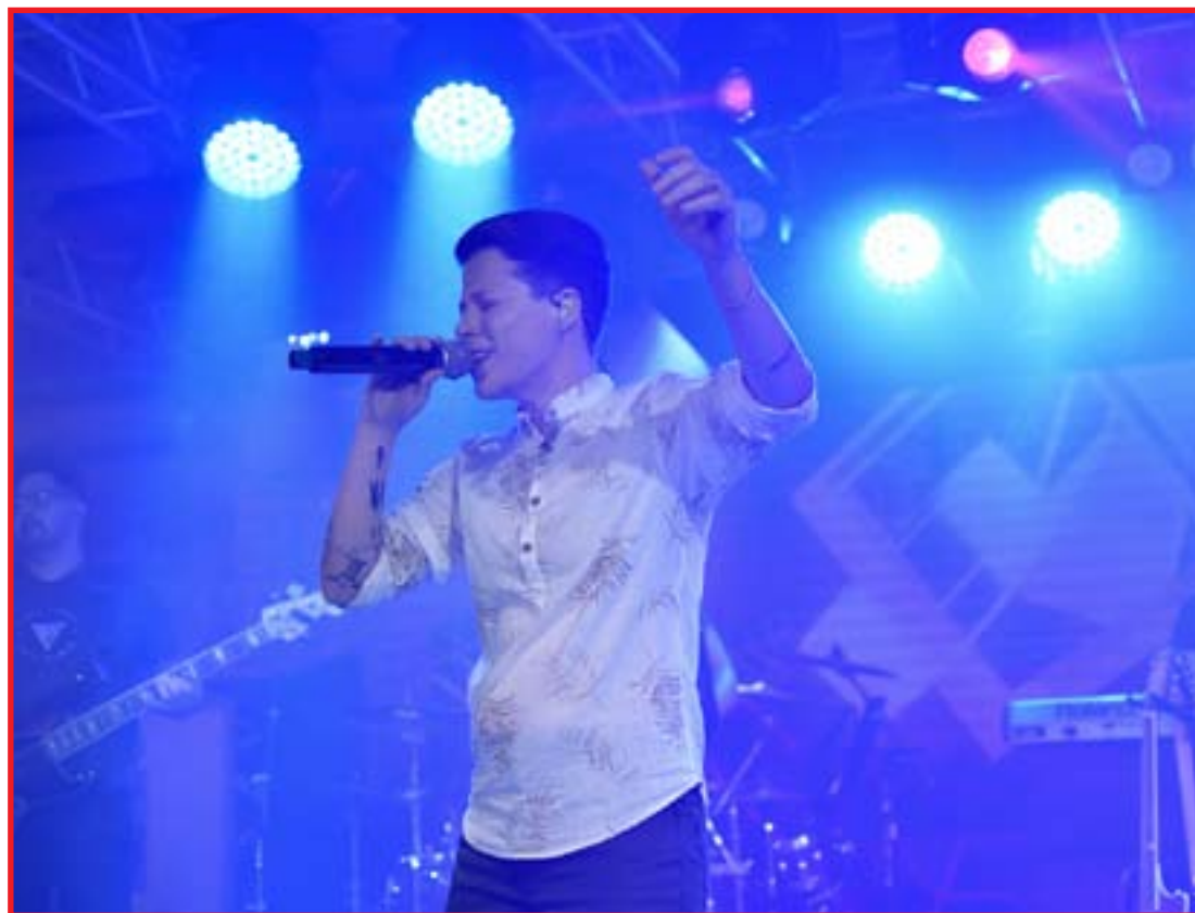
Evento começa às 19h e é gratuito