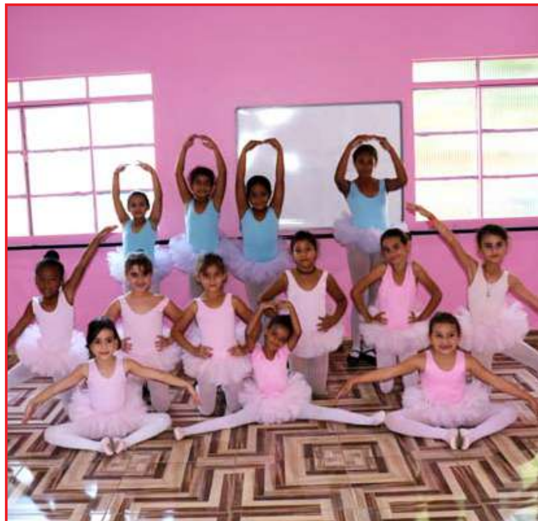
Cerca de 40 meninas participam das aulas e dizem amar o ballet

Segundo ela, o ballet traz para as jovens muitos benefícios, como melhora da coordenação motora, da postura, da socialização através do trabalho em grupo, ajuda no fortalecimento muscular, no alongamento, na flexibilidade.