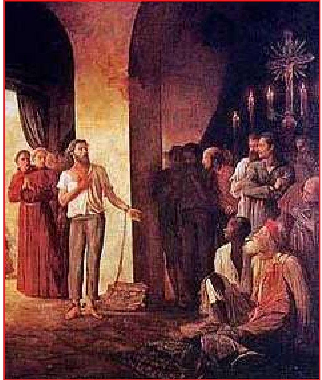
Conheça um pouco de quem foi Tiradentes

Com o fim da monarquia, perde o cargo de pintor oficial e decide pintar