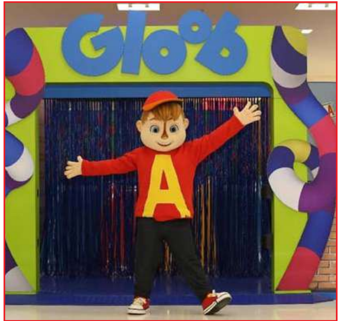
Atividades repaginadas do canal infantil da Globo

Já os pequenos fãs de “Senninha na Pista Maluca” vão acelerar através de uma parede interativa que simula uma corrida com