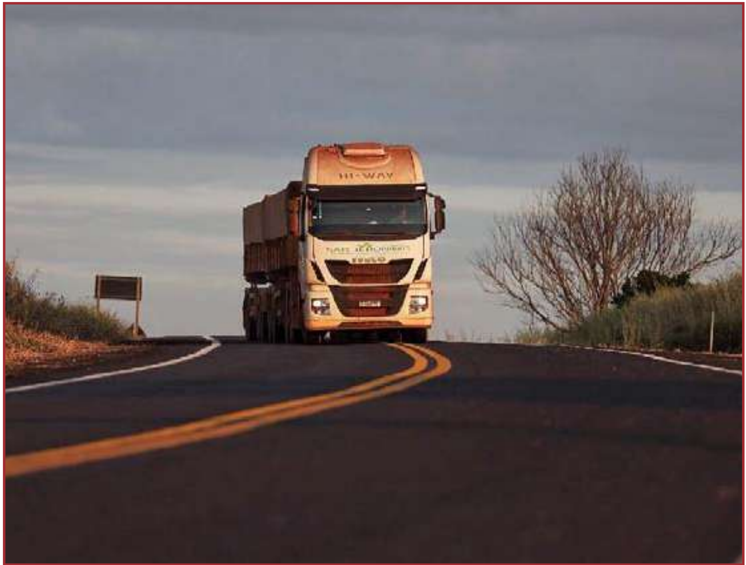
Governo inaugura 39 quilômetros de asfalto na MT-129

Já na MT-130, no trecho do Anel Viário de Paranatinga, a pasta já destinou R$ 2,6 milhões e concluiu a construção de uma ponte de 60 metros sobre o Rio Corgão. A rodovia ainda irá ganhar outras três pontes de concreto sobre os rios Jatobá (41 metros), Ronuro (31 metros) e Paranatinga (100 metros). As três pontes somam um investimento de R$ 9,2 milhões com recursos do Governo e parceiros.