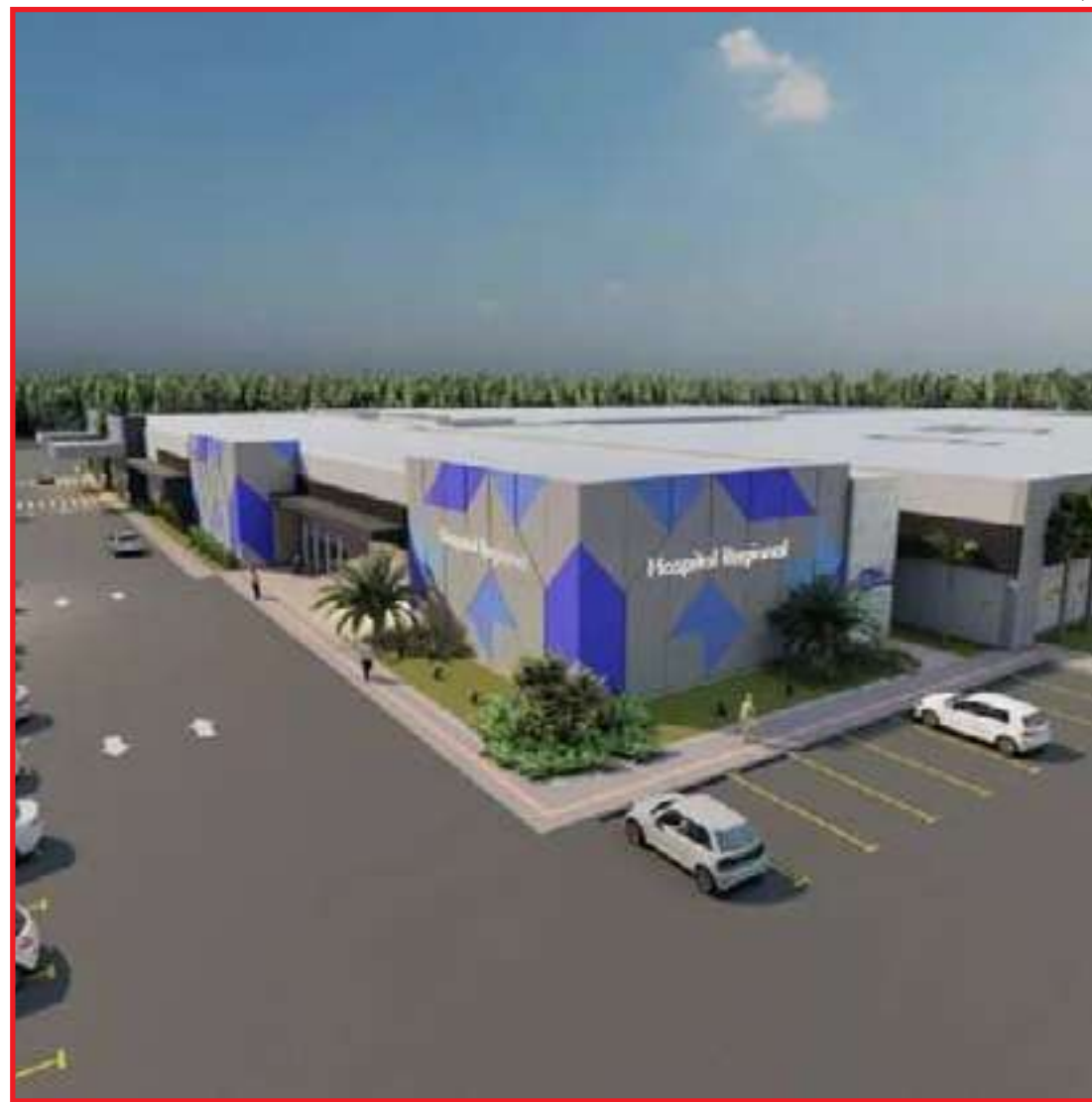
Unidade terá 111 leitos de enfermagem e 40 UTI

As empresas Lotufo Engenharia e Construções LTDA, a Construtora Itamaracá LTDA e a Endeal Engenharia e Construções LTDA irão concorrer entre si para apresentar o menor preço. As empresas podem apresentar recursos até a próxima terça (10), e poderão saber o motivo da desclassificação indo até a Coordenadoria de Aquisições e Contratos da Secretaria Estadual de Saúde (SES) ou no portal de aquisições do governo de Mato Grosso. O novo Hospital Regional de Alta Floresta terá 111 leitos de enfermagem e 40 UTIs (adulta, pediátrica e neonatal), para atendimento de média e alta complexidade. Terá 10 consultórios médicos e consultórios exclusivos para atendimento a gestante. A unidade contará com seis centro cirúrgicos, espaço para banco de sangue, banco de leite materno e sala de realização de exames.