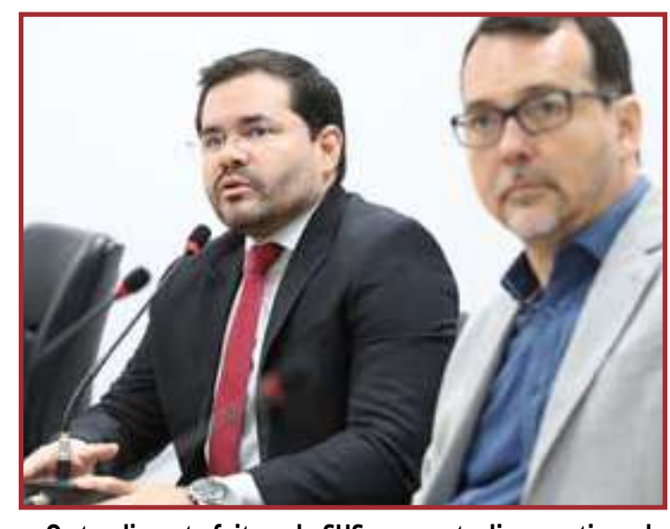
O atendimento feito pelo SUS apresenta diversos tipos de deficiência