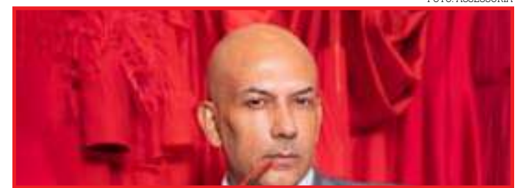
Autor participou de eventos internacionais em Dubai e em Luanda