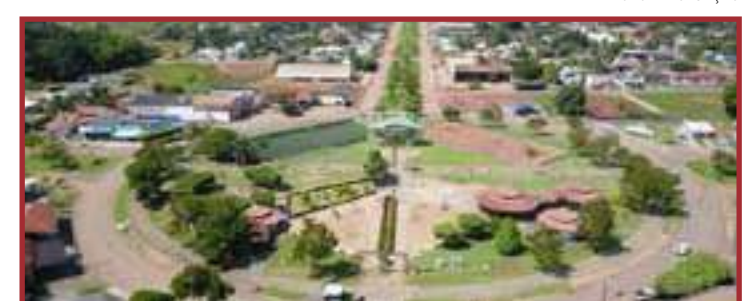
Os recursos financeiros chegarão aos municípios de forma mais rápida