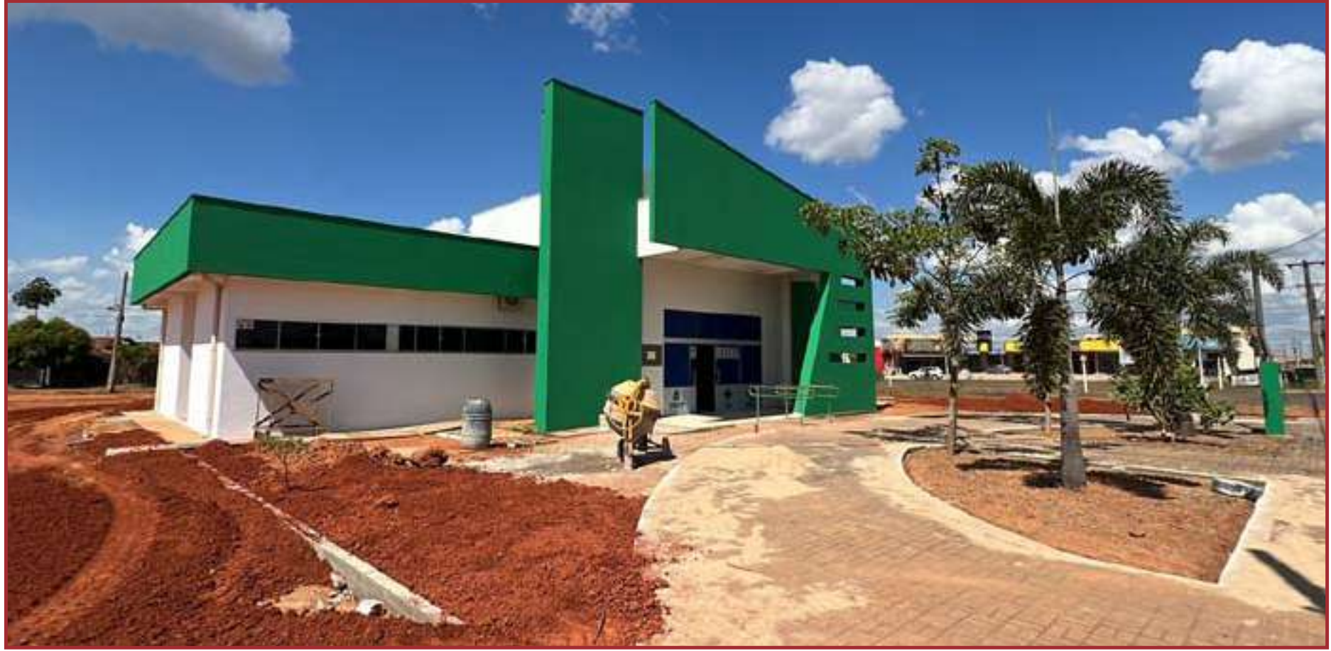
Foram investidos R$ 3 milhões em reformas

Também estão no cronograma de reformas e rea-