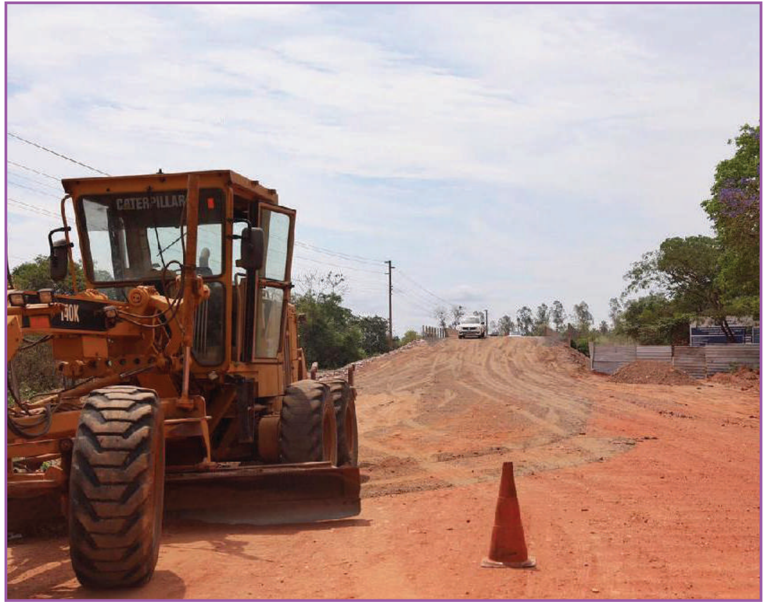
Governador anuncia pavimentação da MT-400, antiga estrada da Guia

Por meio da Sinfra-MT, o Governo de Mato Grosso investe mais de R$ 1 bilhão em obras de infraestrutura na capital mato-grossense. Entre as obras estão a construção do Novo Hospital Universitário, implantação do Contorno Norte