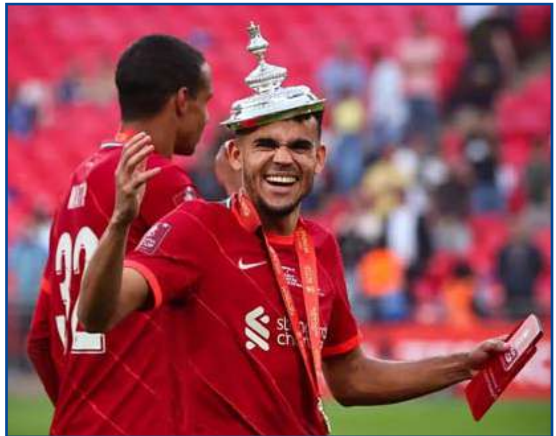
Luis Díaz comemora a conquista da Copa da Inglaterra

O Liverpool pagou 40 milhões de euros ao Porto para contratar Díaz em janeiro. E o colombiano ignorou o senso comum de que a adaptação à Premier League seria difícil.