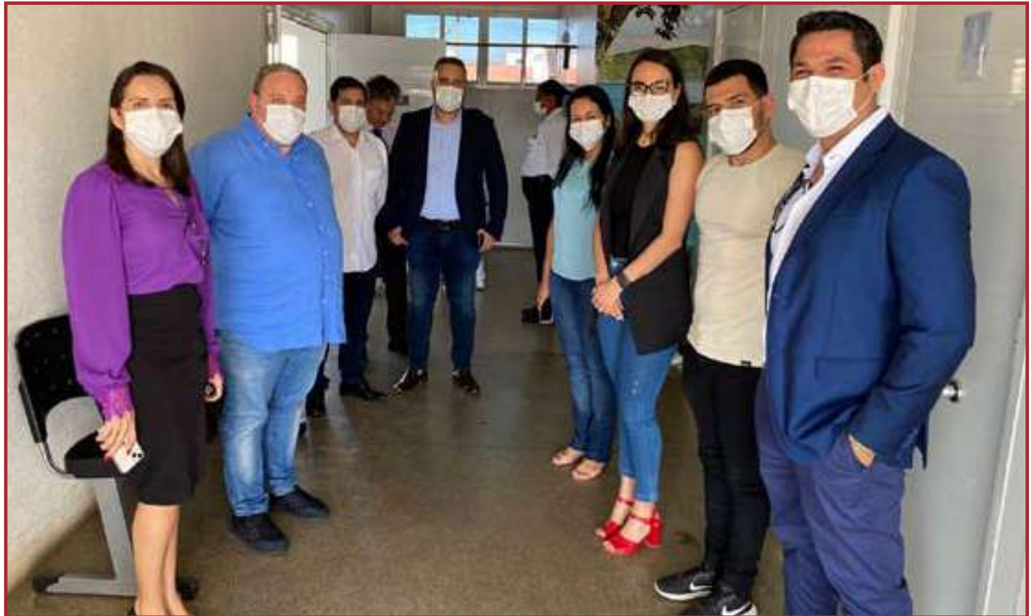
Nova gestão começa hoje os trabalhos

Por conta do fator emergencial a contratação se deu