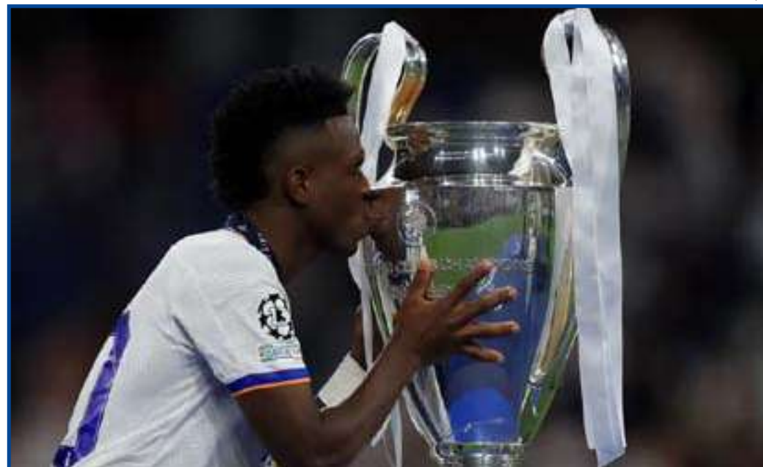
Atacante brasileiro é o escolhido pelo grupo de observadores técnicos da Uefa

O prêmio da Uefa de melhor jogador da Liga dos Campeões foi para o atacante Karim Benzema, também