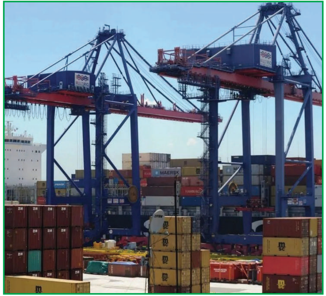
Preços em dólar subiram 28%

Assim, se, por um lado, preços em alta animam os vendedores e ajudam a compensar a alta dos custos de produção, para os consumidores, é sinal de que a inflação deve continuar a corroer o seu poder de compra.