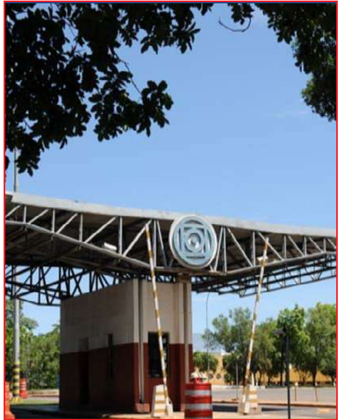
Governo diz que a medida é necessária para cumprir o teto de gastos

Este valor representa aproximadamente 21,2% do orçamento discricionário, aquele destinado ao funcionamento da Instituição de