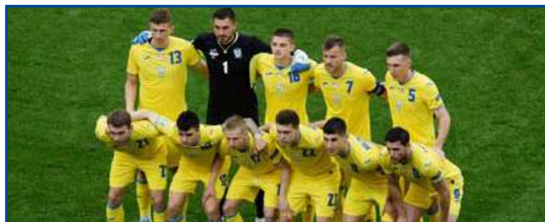
Seleção ucraniana joga na Escócia

O País de Gales, que venceu a Áustria por 2 a 1 na outra semifinal, sediará a final da repescagem no Car-