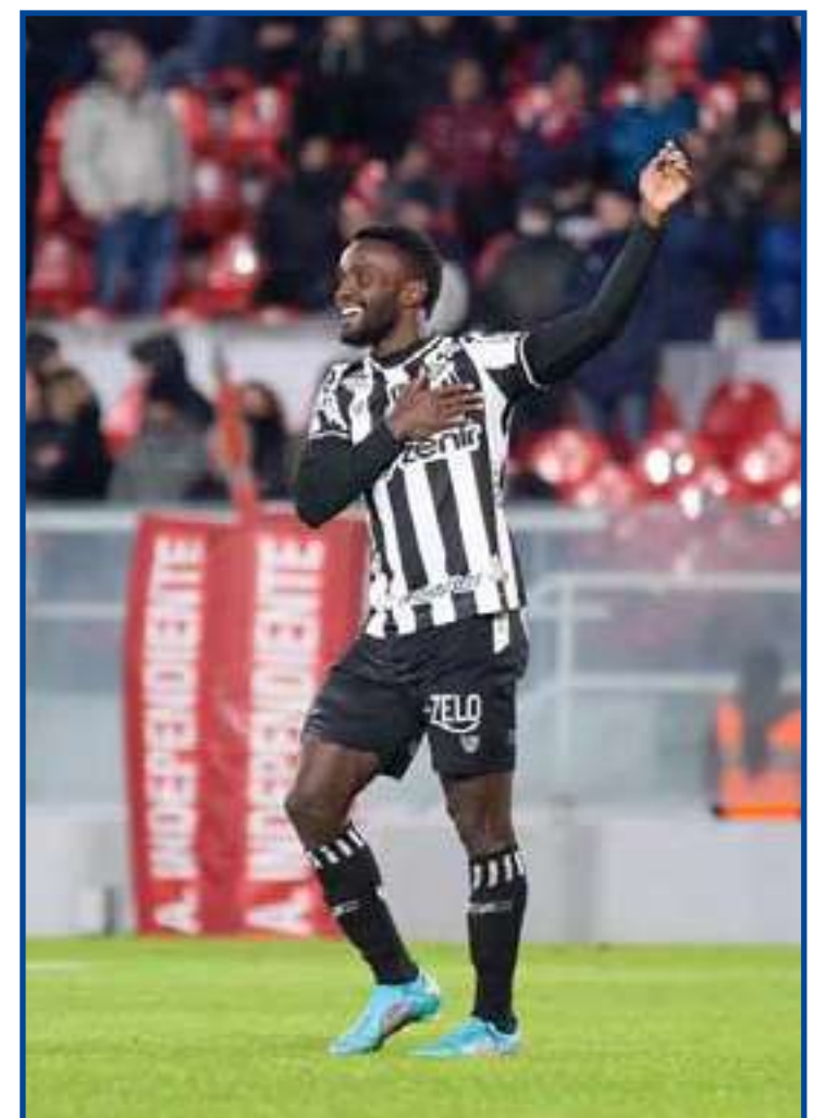
Vozão não perde para o Fortaleza há três jogos