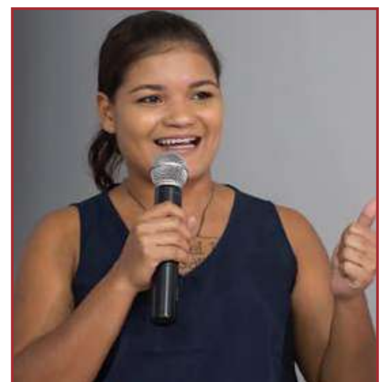
PT não colocou o nome da atriz em lista de pré-candidatos