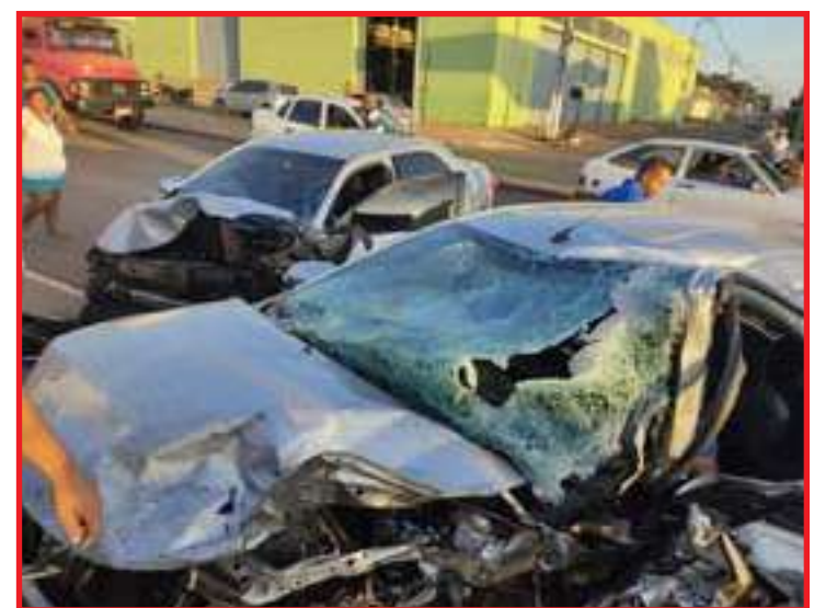
Defesa argumentou que ele não possui condições financeiras para o pagamento

O veículo que provocou o acidente seguia no sentido Filinto Müller e perdeu o controle. O carro invadiu o canteiro e passou para outro lado da pista, atingindo outro automóvel que estava na frente. O motorista é suspeito de embriaguez. Após ser preso em flagrante, ele foi encaminhado para a delegacia. Em seguida, o Tribunal de Justiça de Mato Grosso (TJMT) determinou a prisão preventiva do suspeito. Segundo a Justiça, ele não teve direito à fiança no dia da prisão.