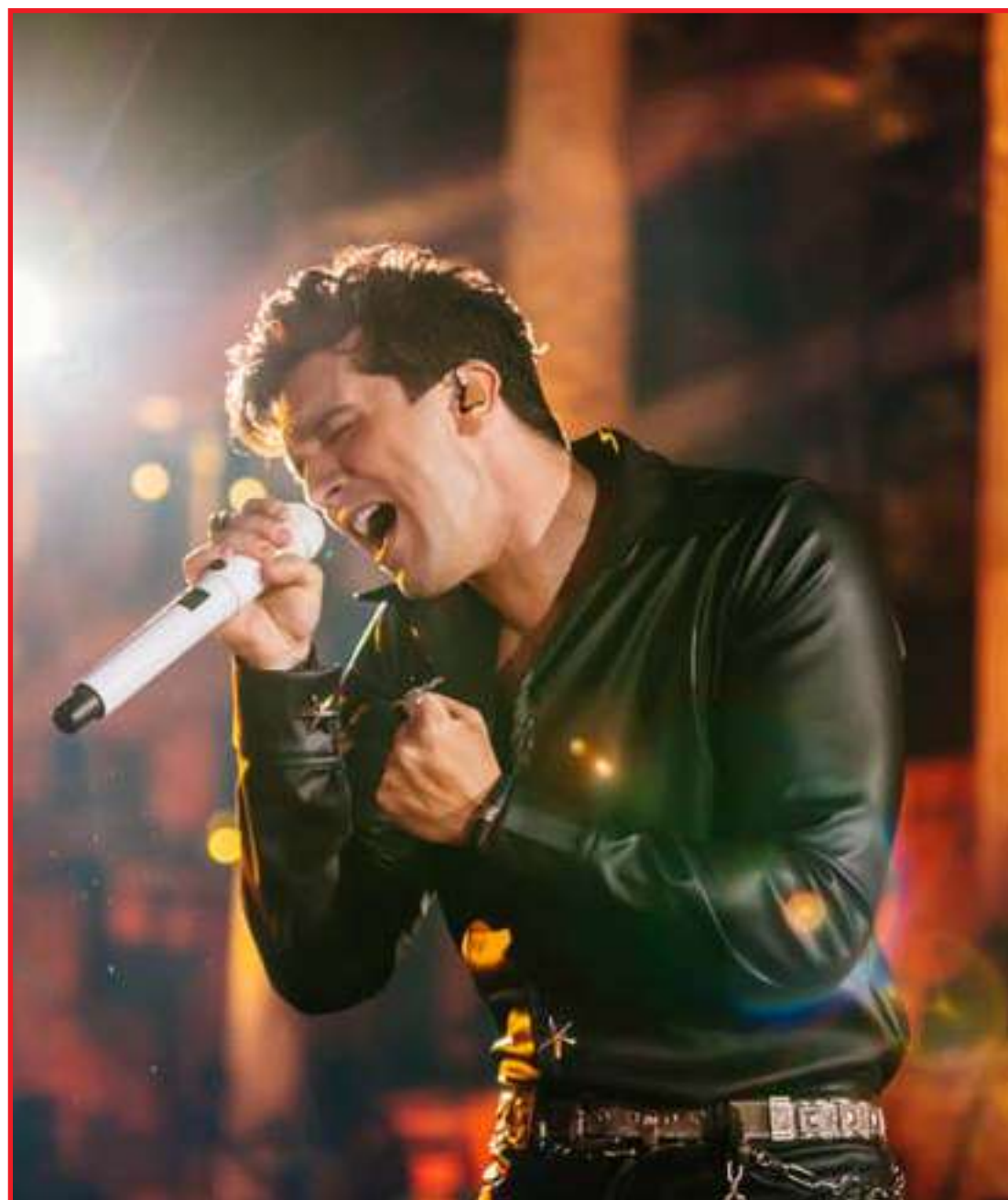
Arrecadação da bilheteria será destinada à filial do Hospital de Amor em Sinop

"A procura pelos ingressos está grande, o lote promocional esgotou em 24 horas e em breve vamos virar o lote. Colocamos a disposição a meia-entrada, para