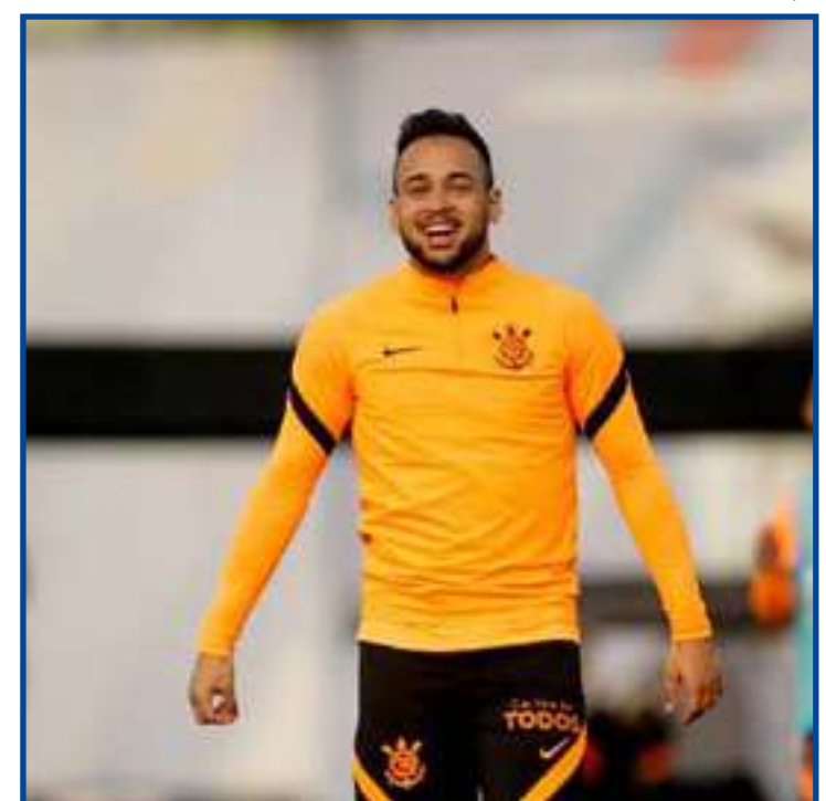
Meio-campista está cedido pelo Shakhtar Donetsk até dezembro