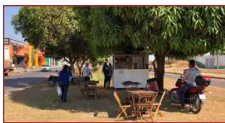
O vendedor ambulante não licenciado pode perder a mercadoria

As fiscalizações realizadas pela Prefeitura apontam sobre venda de produtos sem autorização, comércio sem alvará, uso indevido do passeio público, entre outras questões. Segundo a Lei 166/2018, “o exercício do Comércio Ambulante dependerá, sempre, de prévio licenciamento da Fiscalização Municipal e pagamento da Taxa de Fiscaliza-