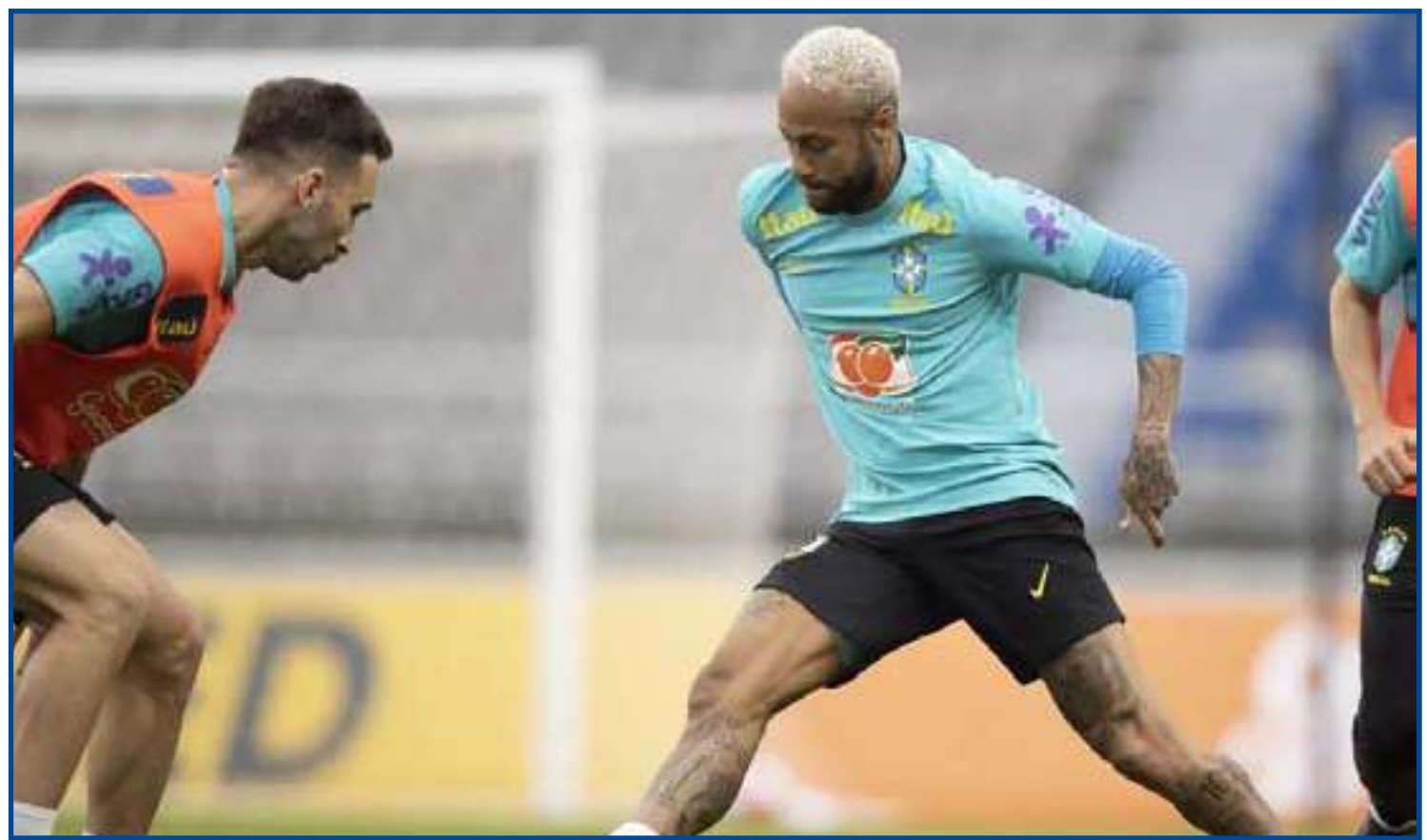
Neymar se machucou em treino da seleção brasileira

Após a saída do camisa 10 de campo, Vini Júnior entrou na equipe por um