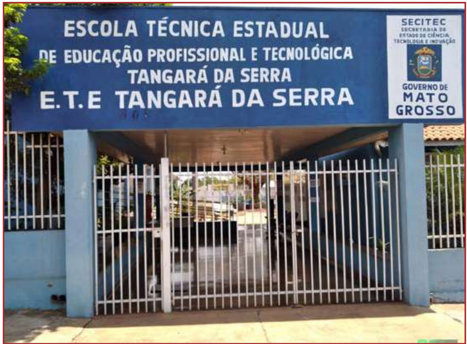
Escolas técnicas estaduais não têm recurso para internet e laboratórios

“O descompromisso do governo com a educação profissional não está somente no loteamento irregular dos prédios das escolas técnicas estaduais, mas também na utilização dos recursos destinados à Educação Profissional e Tecnológica para a contratação de vagas junto a entidades integrantes do Sistema S, enquanto a SECITECI detém em seus quadros profissionais com competência técnica para essa oferta, com mais de 80% dos professores mestres e doutores, ao mesmo tempo que as ETEs remanescentes não têm recursos para a contratação de internet, manutenção dos laboratórios, aquisição de materiais para as aulas práticas”, diz trecho do requerimento.