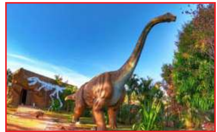
Exposição foi montada às margens do Rio Paraguai em Cáceres