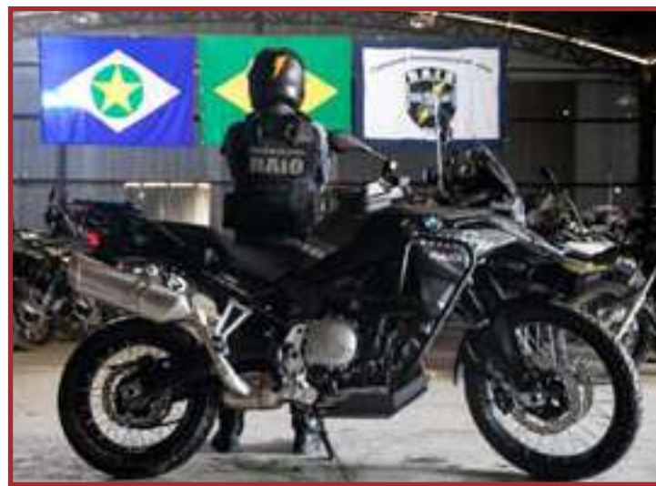
Serão 62 motocicletas, 110 viaturas, 181 armas, 110 drones, rádios comunicadores

Os investimentos incluem, ainda, oito caminhonetes modelo S10 e radiocomunicadores para o Gepron (Grupo Especial de Fronteira). Somente em radiocomunicação para a segurança na fronteira foram investidos R$ 13 milhões. Para o Sistema Socioeducativo do Estado foram adquiridos mobiliários, computadores e outros.