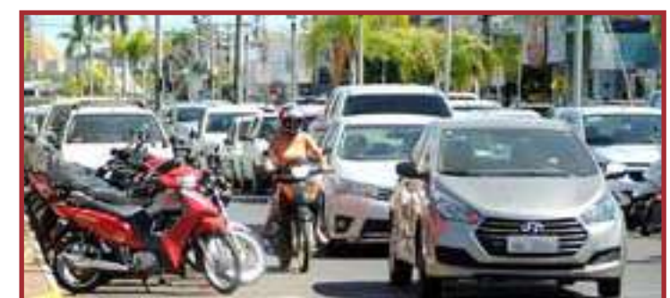
Secretaria prepara ações de mobilidade