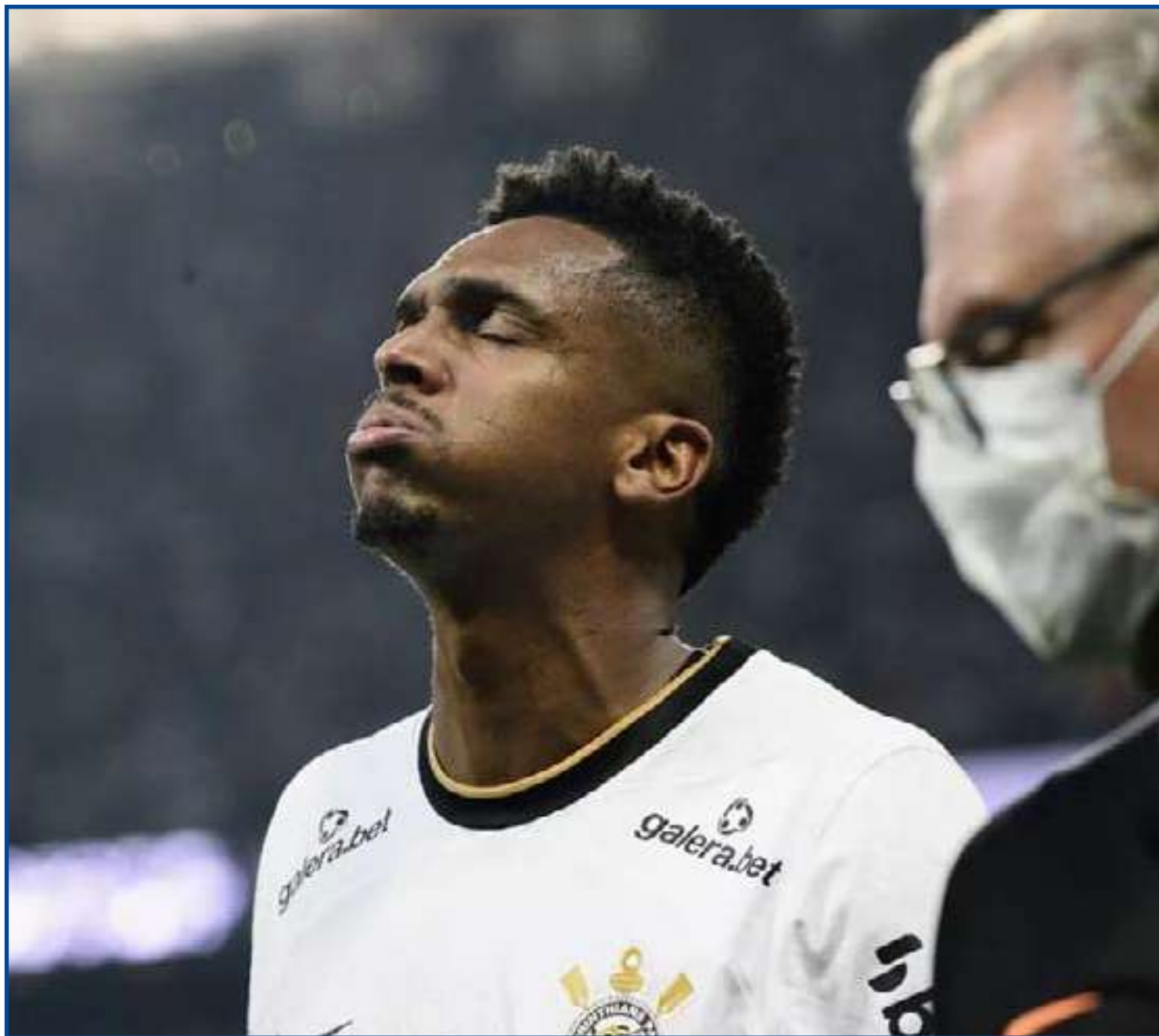
Tendência é de que o clube tente contratar um novo centroavante na próxima janela

Outra marca importante de Jô, que foi conquistada na temporada passada, é a de maior artilheiro da Neo Química Arena. Ele deixou Ángel Romero para trás e exibe marca de 30 gols em Itaquera.