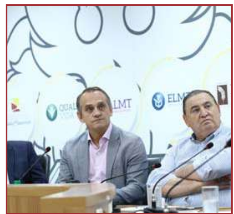
Documento reúne dados sobre quatro setores