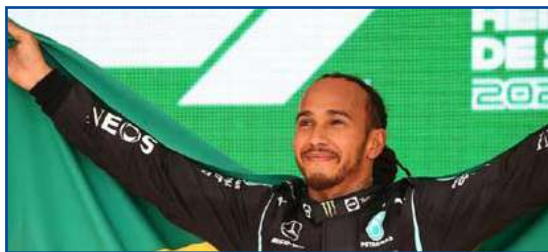
Lewis Hamilton sobe ao pódio do GP de São Paulo com bandeira do Brasil

O piloto inglês usou um capacete com as cores do Brasil e repetiu Senna ao carregar a bandeira brasileira em uma volta de consagração pelo autódromo depois de vencer a corrida. "Acreditamos que o esporte e a celebração das vitórias nacionais, bem como as homenagens a nossos campeões, poderão nos ajudar a resgatar nossa bandeira como símbolo de união nacional", justificou Figueiredo.