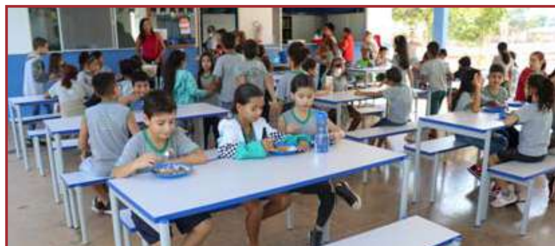
Estudo foi feito entres os dias 1 e 6 de junho e ouviu 812 eleitores

"Estávamos a bastante tempo tentando a aquisição deste mobiliário e por conta dos trâmites e da legislação, uma hora você não consegue adesão a ata, outra hora não consegue entrega aqui. Mas enfim conseguimos com o apoio da Admi-