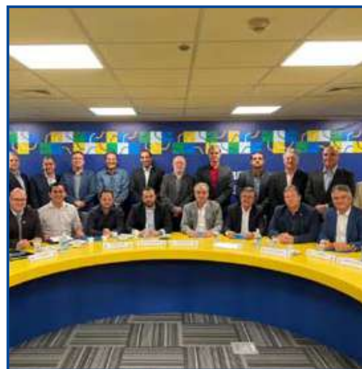
Intenção é buscar entendimento com a Libra, que se recusa a negociar no momento