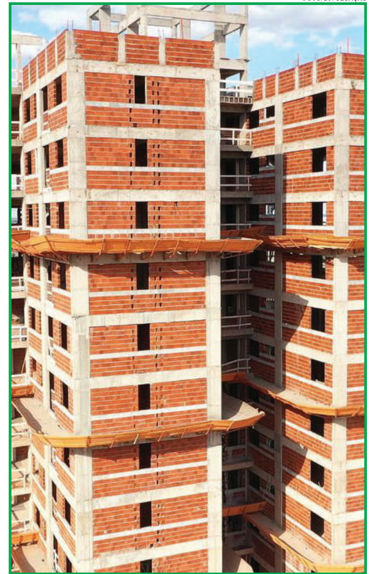
Esta é a maior taxa desde julho de 2021