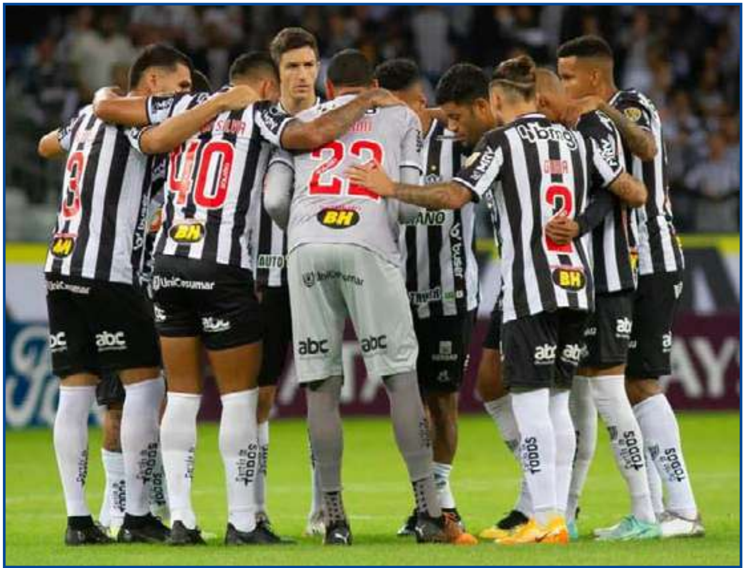
Galo apanhou do Flu no meio de semana

Na lateral esquerda, Arana está de volta da seleção.