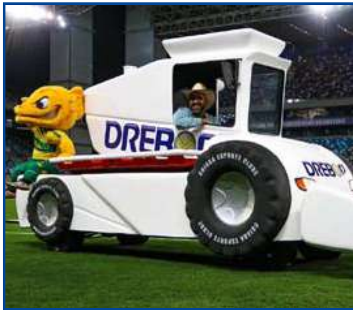
Equipamento foi utilizado no duelo contra o Corinthians

O carro-maca deve ser atração novamente neste sábado, quando o Cuiabá