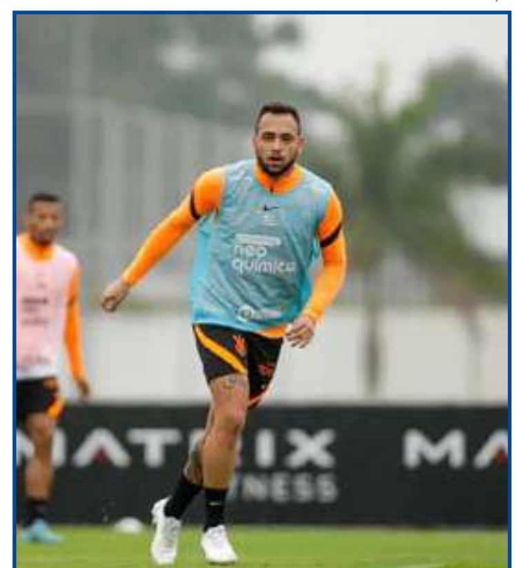
Técnico do Timão está mais perto de contar com quarteto contra o Juventude

sistências nesta temporada. Com Cano inspirado, o Fluminense volta a campo neste sábado, novamente no Maracanã, às 18h, para enfrentar o Atlético-GO, pela 11ª rodada do Brasileirão.