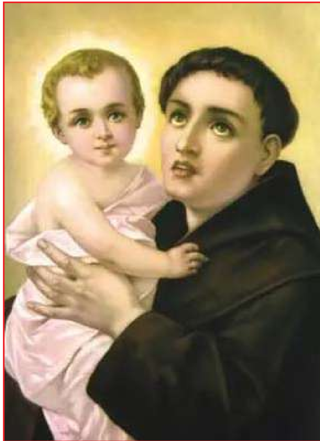
Padroeiro de Sinop, 13 de junho é feriado por conta do dia de Santo Antônio

Acredita-se que, em Nápoles, uma moça percebeu que sua família não teria dinheiro para pagar o dote necessário para que ela se casasse - como era de praxe na época. Assim, ajoelhou-se aos pés de uma imagem do santo e pediu sua intercessão. Então, milagrosamente, ele apareceu e entregou a ela um bilhete que dizia para