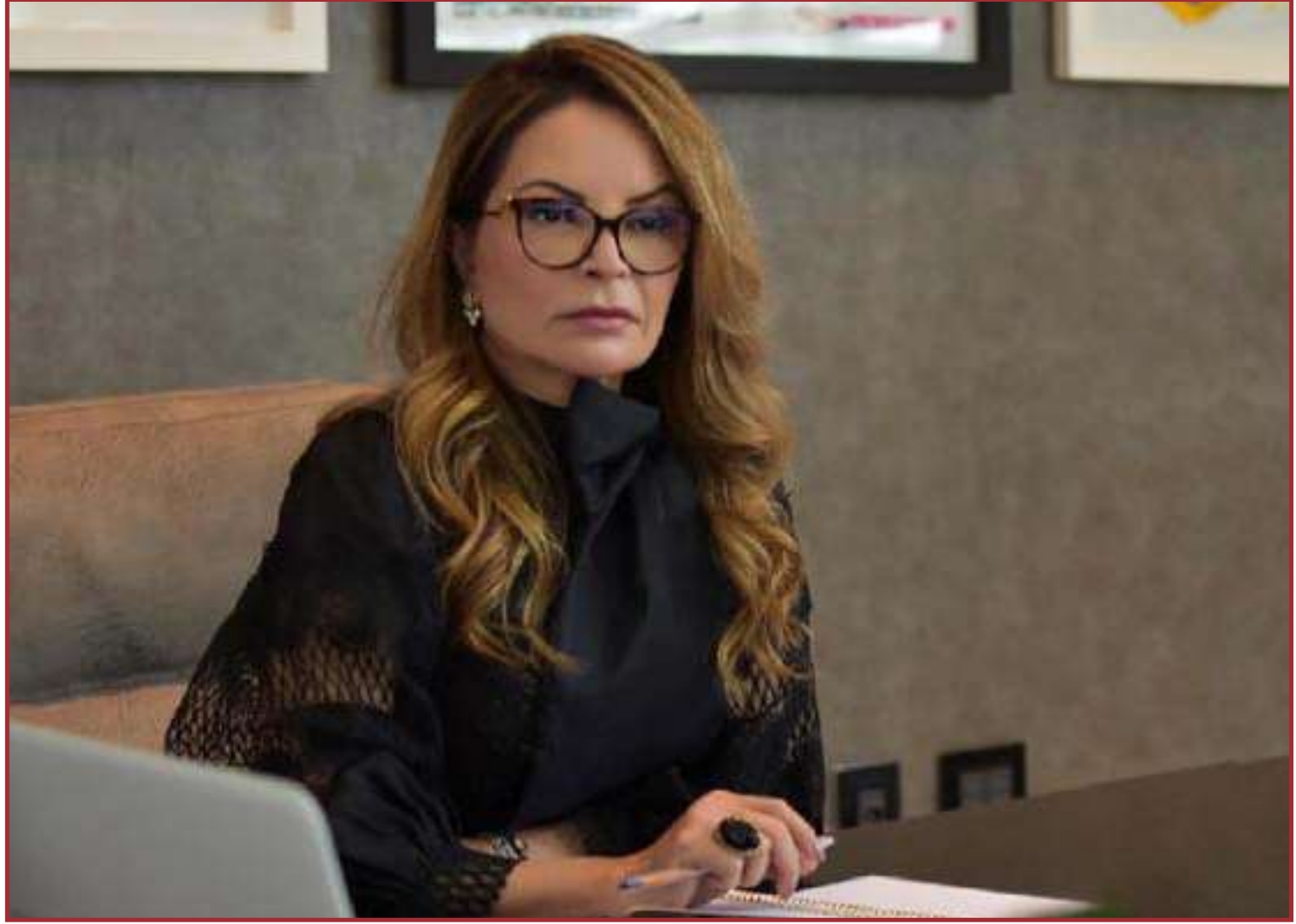
Confirmação foi feita em sua conta no instagram