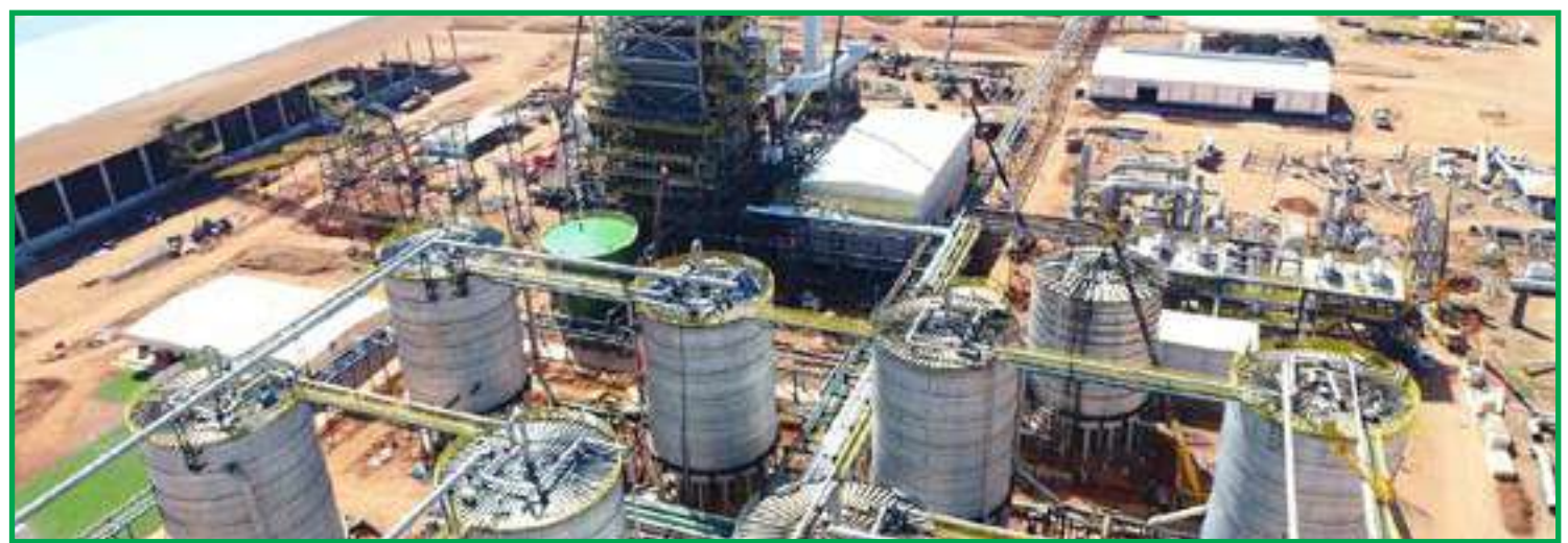
Área cultivada de soja subiu 4,1% em relação à temporada anterior

Ele ainda lembra que o investimento realizado na implantação de usinas é da ordem de bilhões de reais. "É um investimento feito aqui