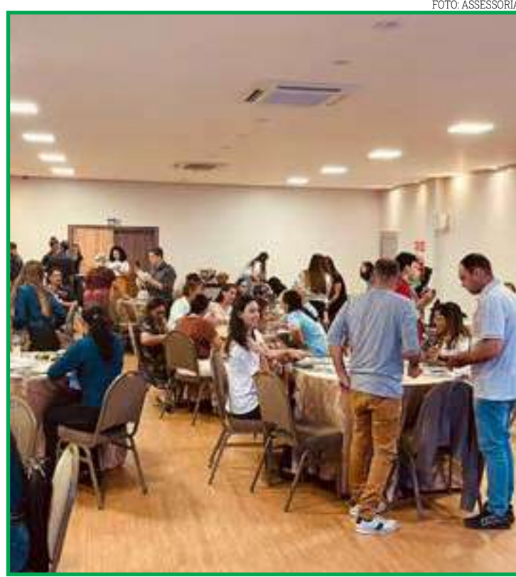
Evento foi realizado nessa semana em Sinop

definiu o evento como uma excelente oportunidade para ter variados produtos na prateleira de casa. "Se eu tenho a procura por um determinado produto turístico e não tenho na minha casa para oferecer, eu posso tranquilamente pegar o produto do município vizinho e ofertar. Isso é uma relação de comensalismo e todos ganham porque ele também poderá se deparar com uma demanda e ofertar o meu produto ou o do seu vizinho". Capitanado pelo Serviço Brasileiro de Apoio às Micro e Pequenas Empresas (Sebrae) e pela Secretaria Adjunta de Estado de Turismo, o "Encontro de Negócios Destinos Turísticos Mato Grosso" reuniu profissionais da área do turismo, como turismólogos e operadores de Campo Novo do Parecis, Nova Xavantina, Alta Floresta, Chapada dos Guimarães, Cuiabá, Várzea Grande, Poconé, Nobres, Santa Carmem e Sorriso.