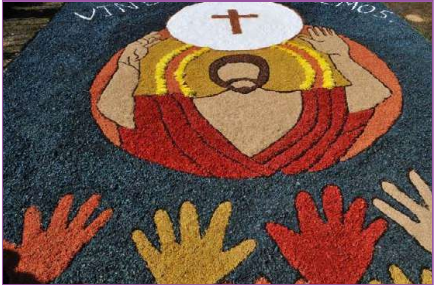
Data é celebrada no Brasil desde o século 16

A celebração do feriado no Brasil acontece em todos os Estados por meio de missas e do ritual de enfeitar as ruas com tapetes, confeccionados no próprio chão das ruas que levam à igreja, durante a noite anterior ao feriado. A confecção dos tapetes é feita com a união de centenas de fiéis que uti-