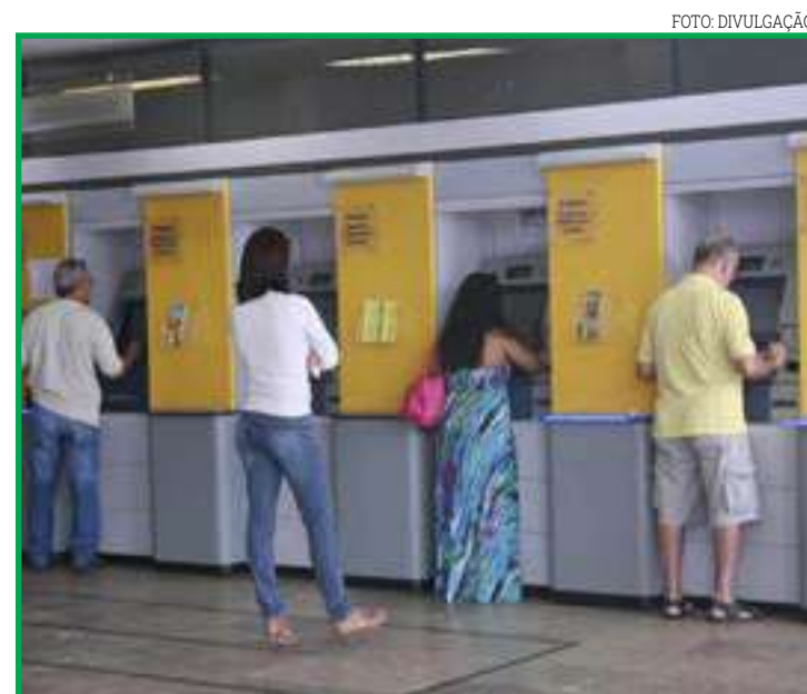
Canais digitais e remotos de atendimento ficam disponíveis

ne, por exemplo – que tiverem o dia 16 de junho como vencimento poderão ser pagas na sexta-feira (17), sem acréscimo de juros, quando as agências reabrirão com atendimento normal aos clientes. De acordo com a Febraban, normalmente os tributos já vêm com datas ajustadas ao calendário de feriados. Caso isso não tenha ocorrido no documento de arrecadação, a sugestão é antecipar o pagamento ou, no caso dos títulos que têm código de barras, agendar o pagamento nos caixas eletrônicos, internet banking e pelo atendimento telefônico dos bancos. Já os boletos bancários de clientes cadastrados como sacados eletrônicos poderão ser pagos via DDA (Débito Direto Autorizado).