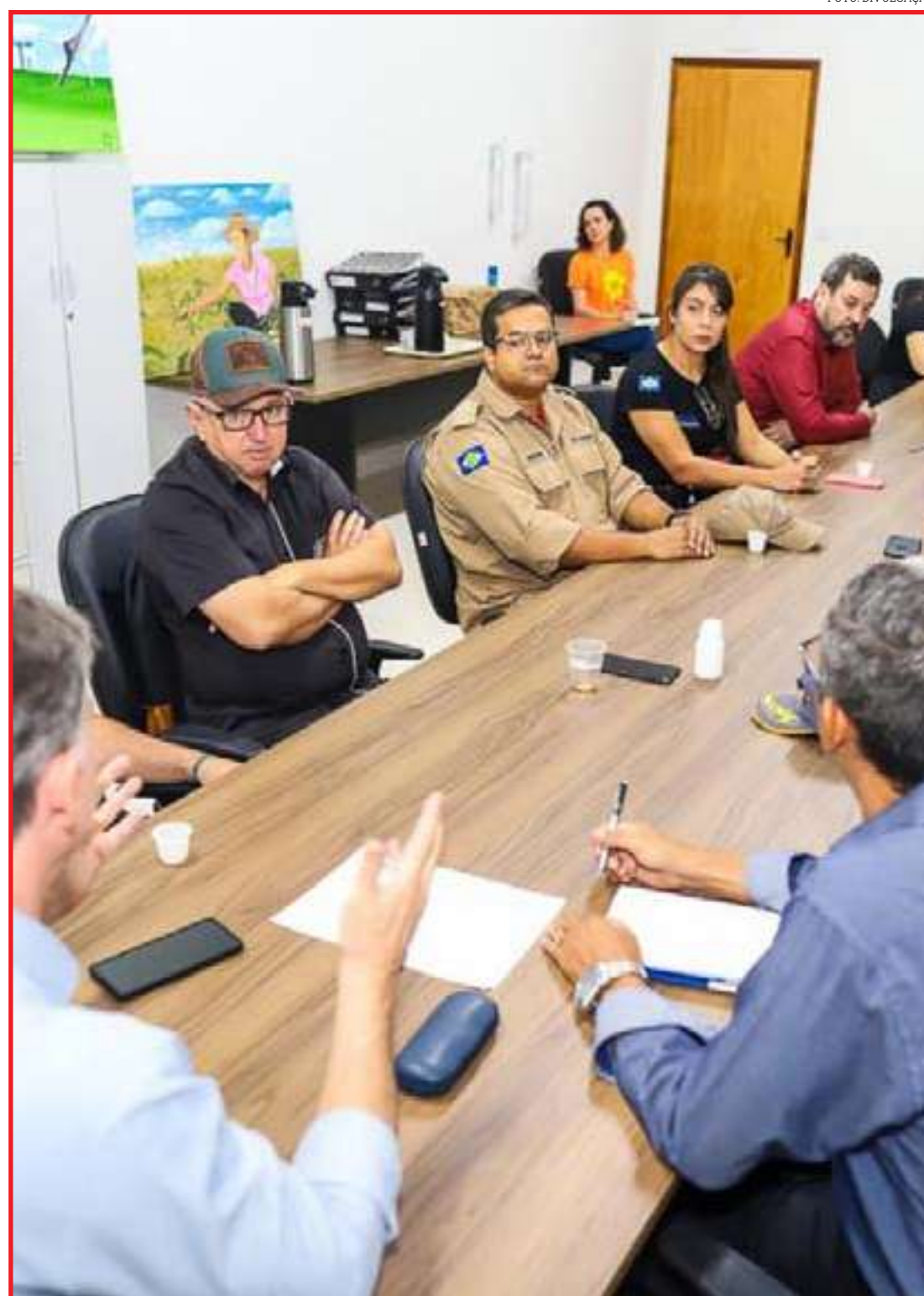
Conselho volta a se reunir mensalmente