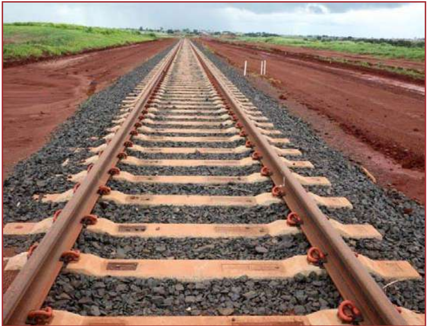
O empreendimento de 933 km é estimado em R$ 25,20 bilhões

Segundo Neri Geller, campos de pastagens degradadas em Mato Grosso e no Pará poderão ser incorporados ao sistema de produção de grãos sem derrubada de mata. "Essa ferrovia deveria ter sido liberada no ano passado para que a obra fosse licitada e hoje já estaria acontecendo. No entanto, se tivéssemos votado a Lei Geral do Licenciamento, essas matérias teriam sido superadas", concluiu Neri Geller.