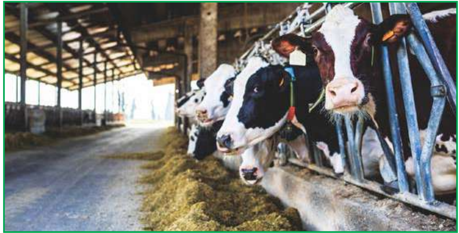
Gastos com ração aumentaram quase 50%

Outra preocupação do setor é a estiagem que passa de 40 dias em algumas