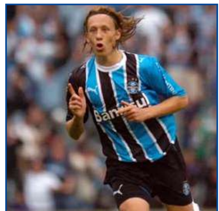
Volante acertou o retorno para ser um dos líderes do Tricolor