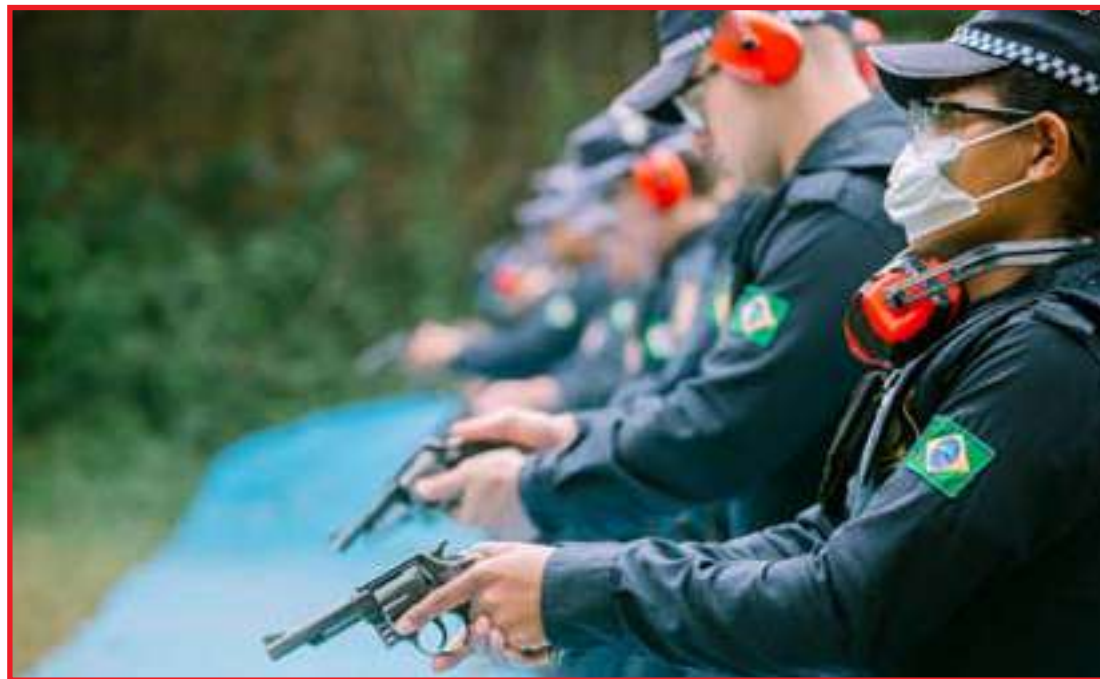
Agentes estão em Cotia participando do curso de formação em segurança pública

"Teremos uma Guarda bem aplicada no atendi-