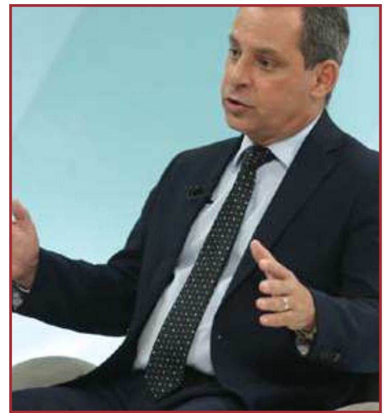
Coelho não resistiu dois meses na estatal