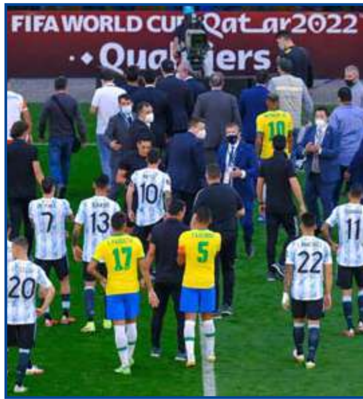
Não está descartada possibilidade de jogar no Brasil