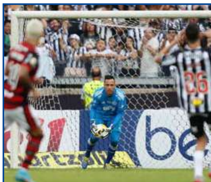
Camisa 1 afirma que time não passou perto de atender às expectativas

Questionado sobre isso, agradeceu o carinho recebido na concentração rubro-negra e admitiu estar curtindo os últimos momentos dentro de um clube que defende desde o segundo semestre de 2017.