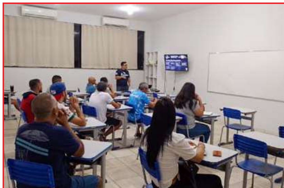
Inscrições são gratuitas e já podem ser realizadas

O workshop de tênis de mesa será nos dias 8 e 9 de julho, sendo uma realização da Prefeitura e da Federação Mato-grossense de Tênis de Mesa. O encontro é voltado aos atletas, técnicos e profes-