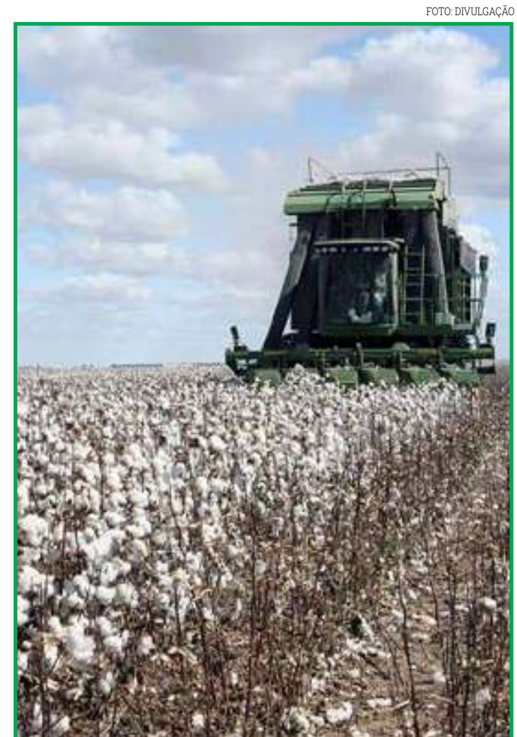
Expectativa é colher 1,18 milhão de hectares

Nacional do Sistema Elétrico (ONS), a bandeira verde será mantida até dezembro, por causa da recuperação dos níveis dos reservatórios das usinas hidrelétricas no início do ano.