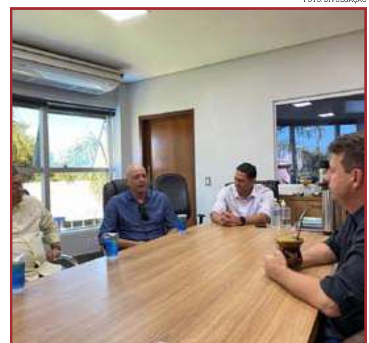
Representantes do Grupo Funada buscam área para instalar nova fábrica