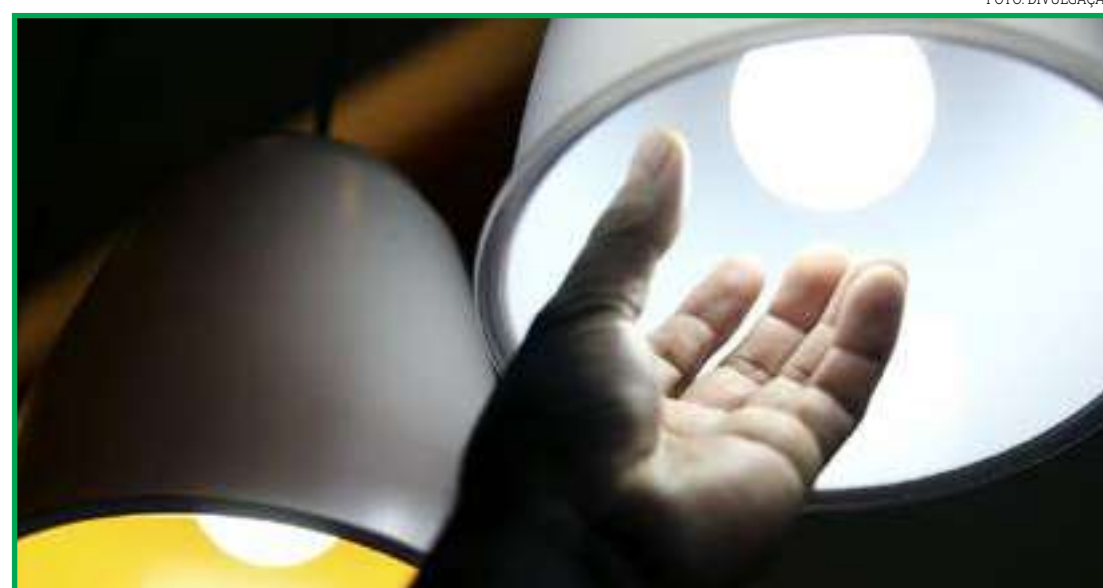
Consumidores não pagarão mais porque bandeira está verde

Bandeira verde: sem cobrança adicional; Bandeira amarela: +59,5%, de R$ 18,74 para R$