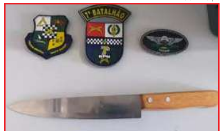
Vítima disse à polícia que o filho também a ameaçava com uma faca