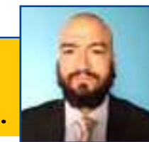
POR LEANDRO CARECA

Um proprietário de um sítio encontrou uma ninhada de cinco corujas-das-torres no telhado da propriedade, localizada na BR-070, em Várzea Grande. A espécie é conhecida como coruja branca e também pelos nomes de coruja-da-igreja, coruja-católica, rasga-mortalha e suindara. A ninhada com os cinco filhotes foi encontrada do forro da casa, após uma noite em que os proprietários dormiram no local, se depararam com o som dos silvestres e subiram para verificar. Apesar do susto, a beleza do animal deixou a família, que registrou algumas fotos e vídeos, encantada. Os donos acionaram a Sema que já agendou uma data par resgate da espécie. De acordo com a Secretaria de Estado de Meio Ambiente (Sema) a orientação é que sempre que encontrar o animal silvestre a pessoa deve entrar em contato com a Polícia Ambiental pelo 190 ou com a Secretaria Estadual de Meio Ambiente pelo 0800 065 3838.