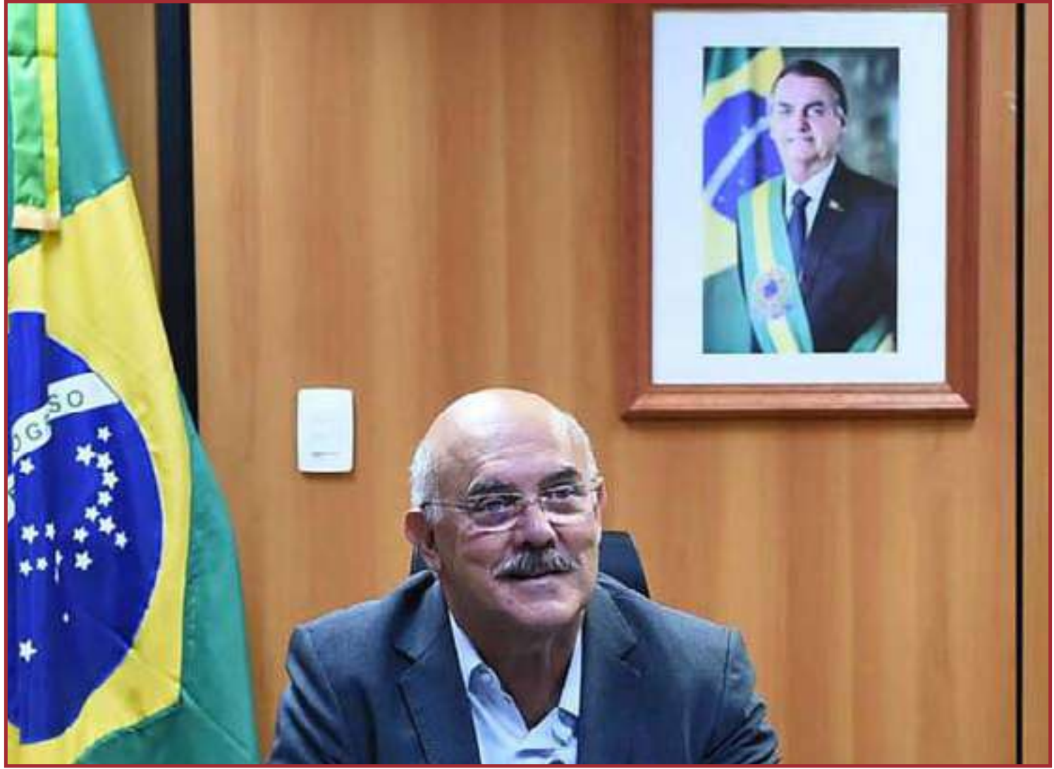
Em áudio ex-ministro confessou favorecimentos

Após a reunião com os pastores em questão, em dezembro de 2021, o MEC firmou termos de compromisso com nove prefeituras que totalizaram R$ 105 milhões em repasses. Além de levarem os prefeitos a Brasília para encontros com Milton Ribeiro, os pastores também acompanhavam o ministro em viagens pelo Brasil. O mandato de prisão preventiva contra Ribeiro foi expedido por ordem do juiz Renato Borelli, da 15ª Vara Federal Criminal do Distrito Federal, e cita supostos crimes de corrupção passiva, prevaricação, advocacia administrativa e tráfico de influência.