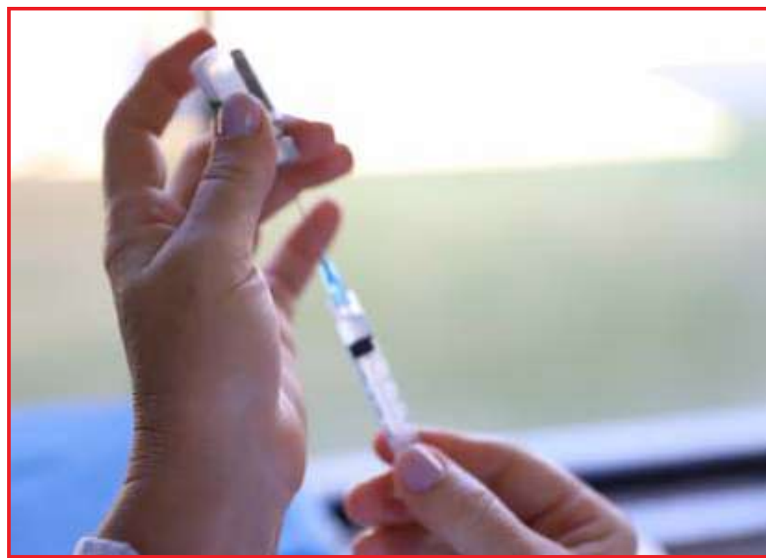
Medida atende recomendação do Ministério da Saúde

A vacina faz parte do Calendário de Vacinação e é aplicada em crianças menores de cinco anos, em esque-