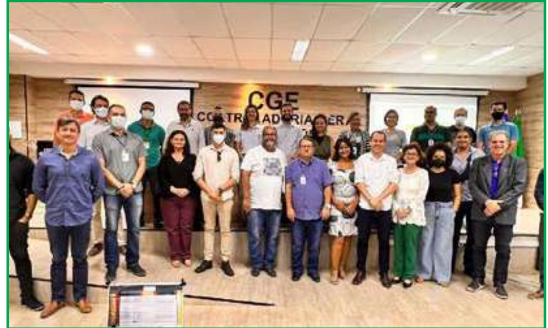
Representantes de entidades participaram de workshop

"Coletar é trabalhoso e caro, mas não o mais importante dentro desse processo. O mais importante é fazer a leitura do que for coletado, de modo que o Estado possa