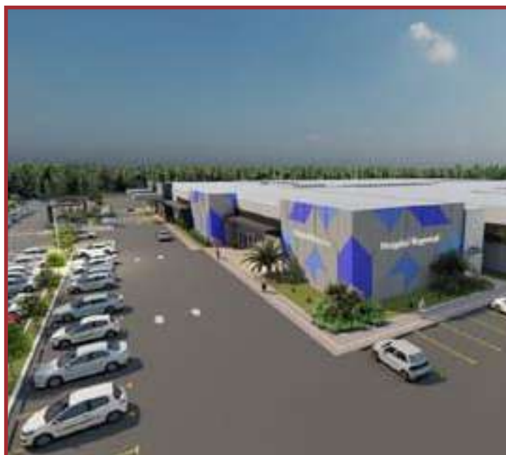
Unidade contará com 151 leitos, 111 de enfermaria e 40 de UTI