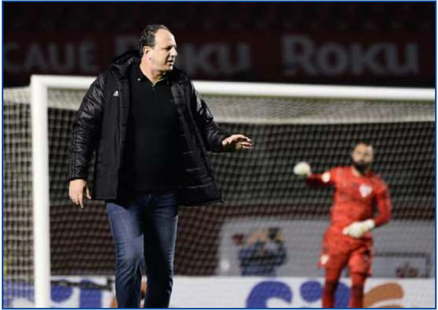
Derrota de virada para o Palmeiras no Brasileirão abalou o grupo

“Se tivéssemos todos os jogadores à disposição, teríamos uma rotação boa e com chances de mudar. Hoje temos poucas opções.