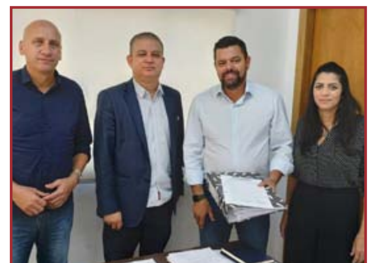
Secretários municipais apresentaram proposta ao titular da Seciteci

e planos governamentais de prevenção e combate aos incêndios florestais, passando inclusive pela formação e treinamento de pilotos.