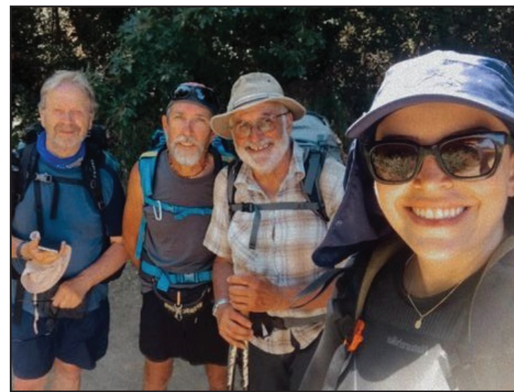
“Esse grupo de senhores me viram e começaram a chamar pelo meu nome. Pediram para fazer uma foto. Me assustei: ‘como sabiam meu nome?’. Eles falaram que já tem muita gente falando de mim”