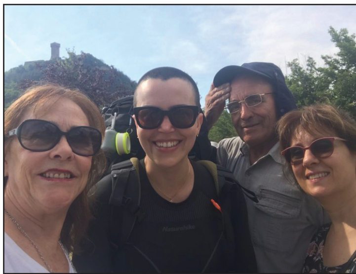
“Amigos que fiz na Itália. Dormi na casa deles, me levaram para conhecer a cidade de Montefiascone e, depois de 3 dias, foram até a mim para levar água gelada e cereja”