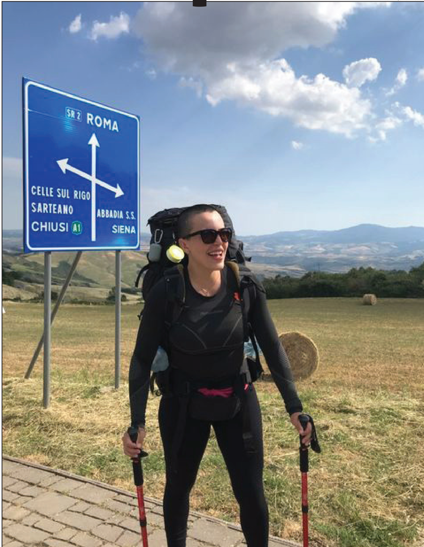
“A foto que mais gosto! Foi quando cheguei na Toscana. Agora, tenho a certeza que a região é linda, mas as subidas e descidas acabam com qualquer pé!”

surpreendendo no sentido de que existem muito mais pessoas boas do que ruins. Deus existe e milagres existem o tempo todo.