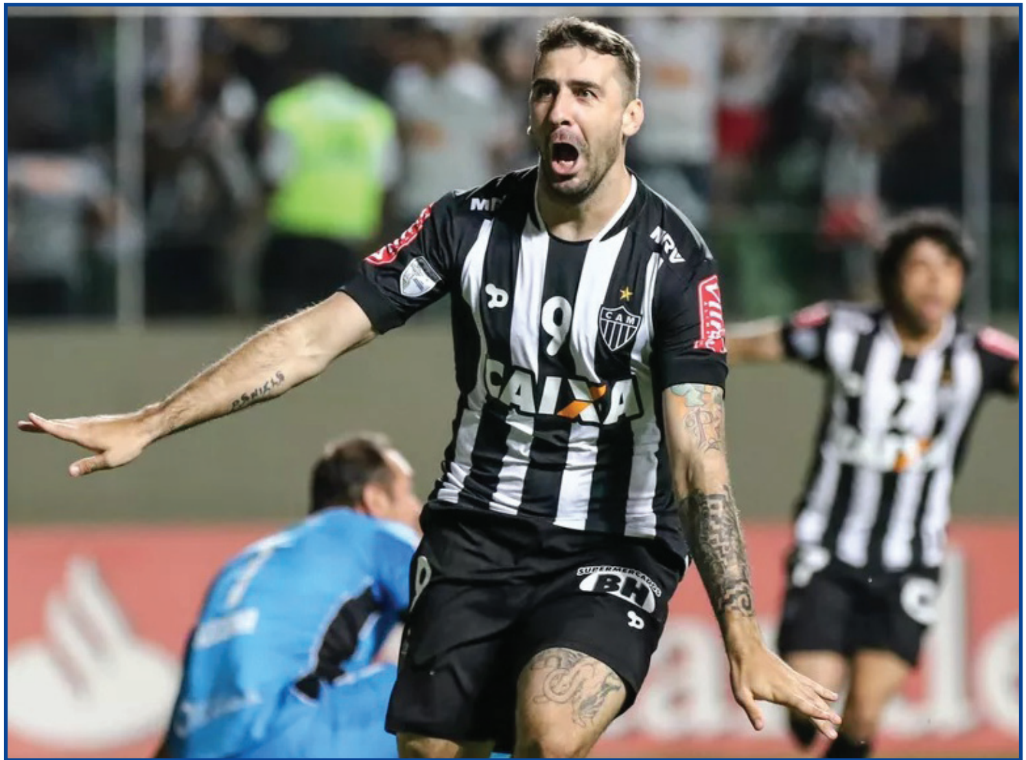
Nova vitória nesta terça assegura Alvinegro nas quartas de final

Hulk fez dois gols no duelo contra o Independiente del Valle, no Mineirão, pela fase de grupos da