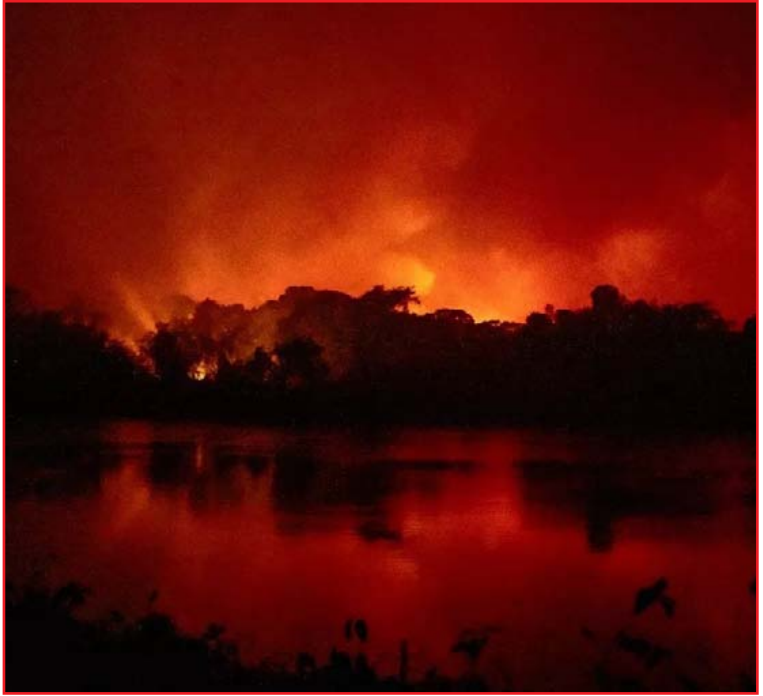
Valor da multa aplicada por atear fogo pode chegar a R$ 15 mil em MT

Colniza está em primeiro lugar no valor de multas aplicadas por crimes ambientais, seguido por Marcelândia, com R$ 50 milhões e Rosário Oeste, R$ 40 milhões.