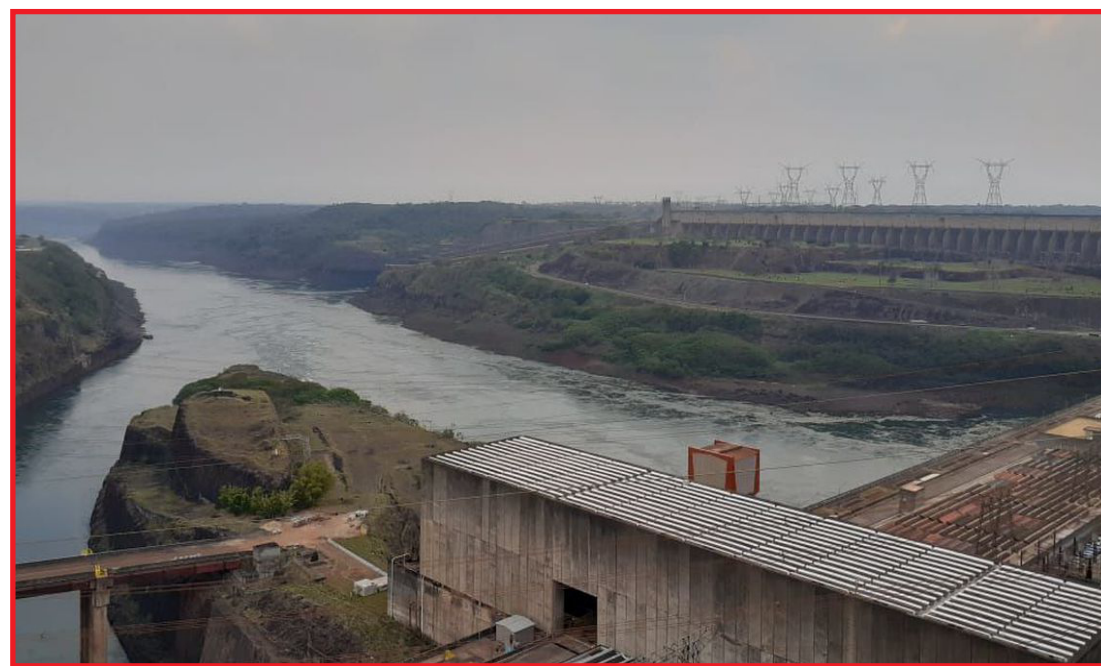
Norma ainda precisa ser validade pelo presidente Jair Bolsonaro

Segundo o Governo Federal, esse plano contribuirá para a estruturação das ações visando à recuperação dos reservatórios das usinas hidrelétricas de regularização, por