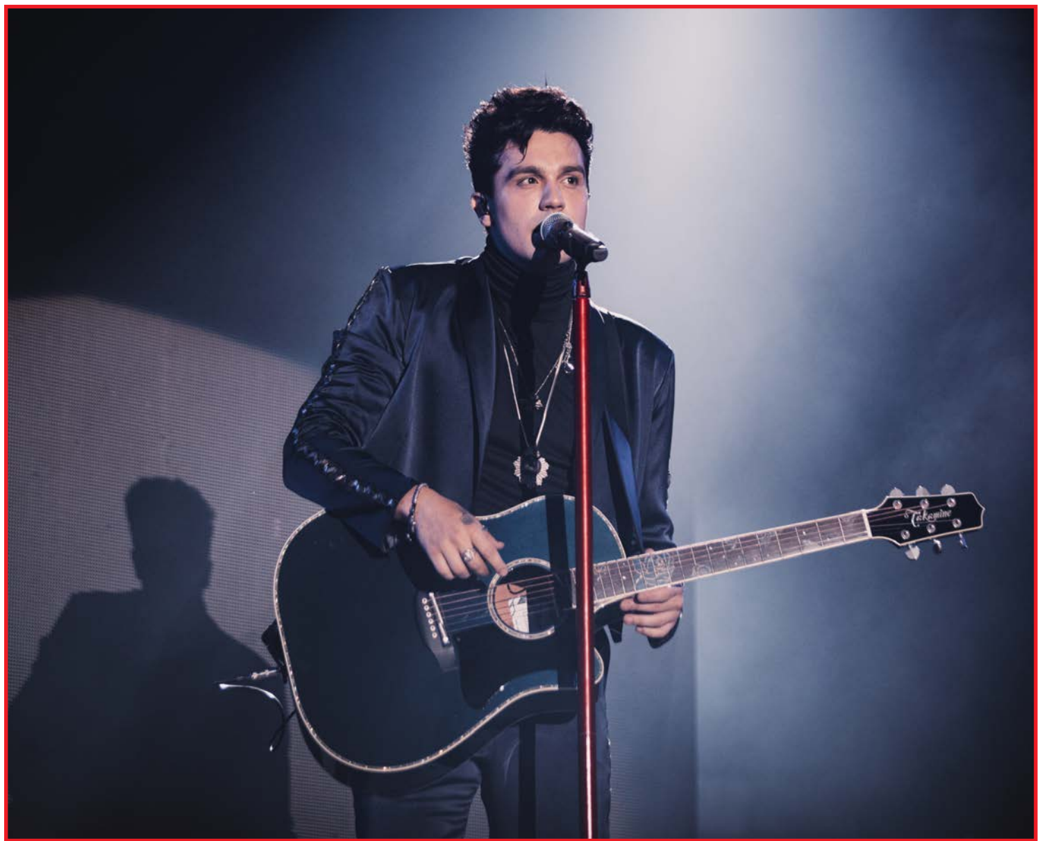
Cantor Luan Santana se apresenta amanhã em Sinop

Os ingressos para área vip e camarote estão no 3º lote e a aquisição pode ser feita