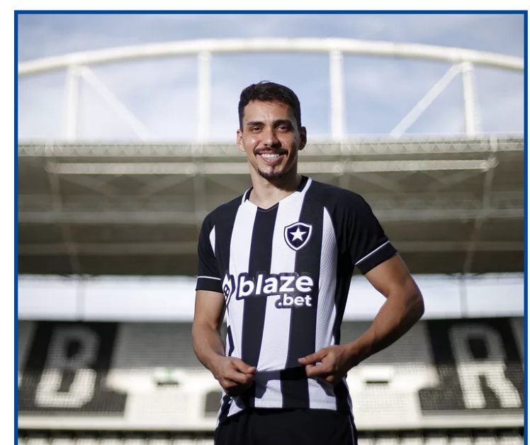
Meia terá contrato até o fim de 2024 após rescindir com o Al-Ahli