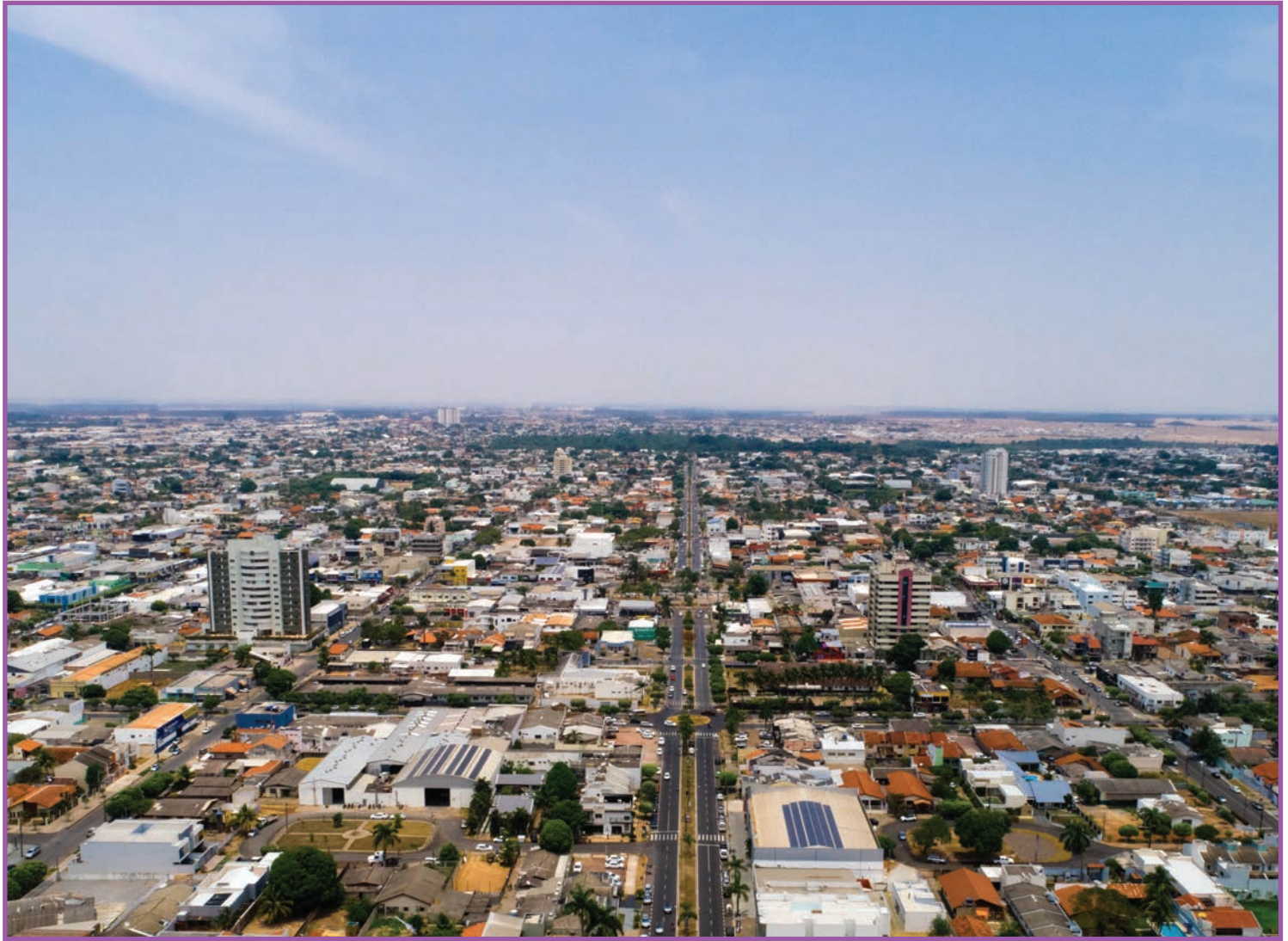
Mato Grosso já teve 6,8 mil focos de calor neste ano

O fogo faz parte do processo de desmatamento que consolida a conversão da vegetação nativa em Mato Grosso. É a alternativa mais comum para mudar a utilização do uso da