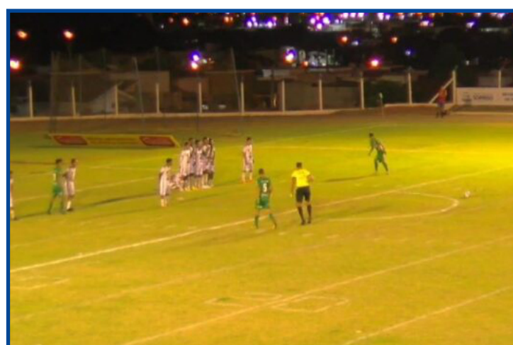
Chicote da Fronteira decide classificação na última rodada contra o Iporá

Líder e vice-líder, respectivamente, Brasiliense/DF e Anápolis/GO também estão classificados para o mata-mata.