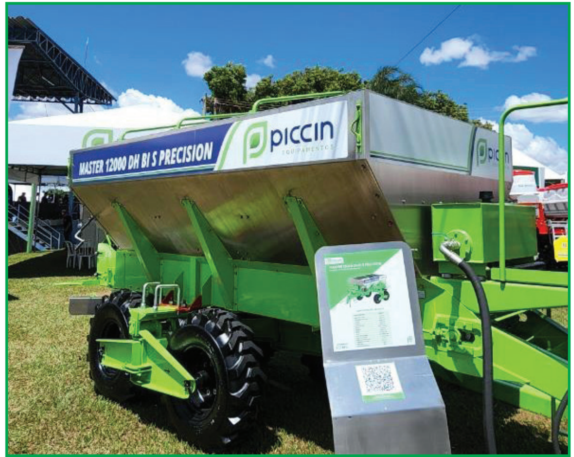
Descompactador estará em exposição durante a feira em Bebedouro

Também será destaque da Piccin Equipamento durante o evento o distribuidor de adubo e corretivos de solo, 12000 DH S, que conta com um moderno sistema de distribuição por centrifugação e acionamento por motores hidráulicos com velocidade variável. "Esta máquina tem estrutura reforçada e baixo custo de manutenção. Além de bloco de controle com válvulas prioritárias e o sincronismo dos discos cõncavos, estando assim prontos para receber módulos de aplicação também em taxa variável de forma homogênea e com qualidade", salienta o engenheiro agrônomo.