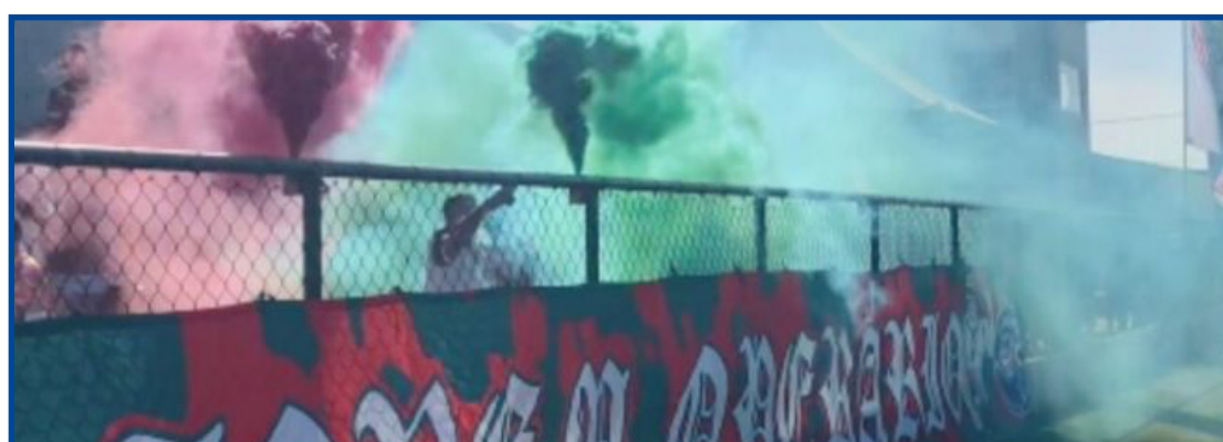
Tricolor recebe o time mineiro no domingo, no Dito Souza

gulamento, fórmula de disputa, tabela, e etc. A abertura do Campeonato Mato-grossense Sub-15 e 17 está prevista para os dias 17 e 18 de setembro.