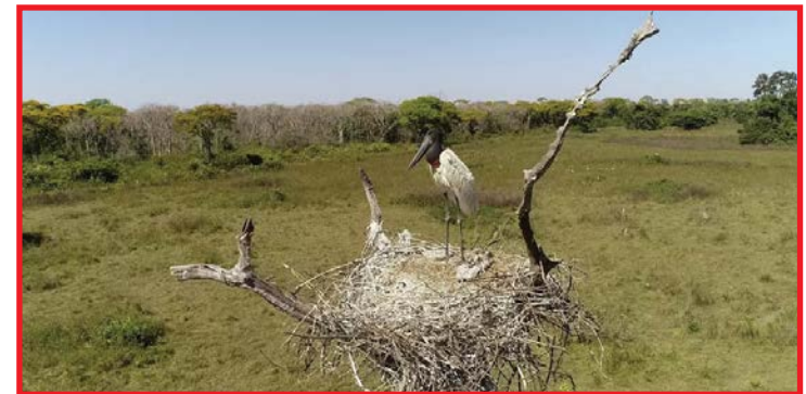
Pacientes recebem os encaminhamentos necessários conforme cada caso