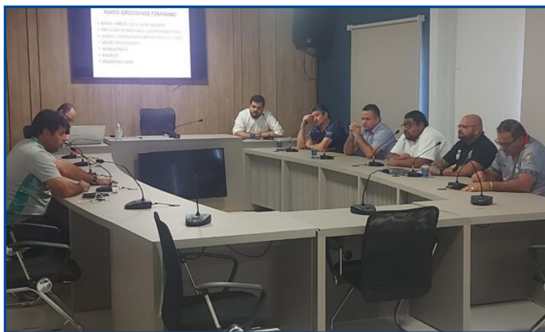
No sub-15 e sub-17, mais de 10 times demonstram interesse na participação

Mais de 10 clubes demonstraram interesse em participar do Campeonato Mato-grossense das categorias Sub-15 e 17 - Edição 2022. As equipes terão até o próxi-