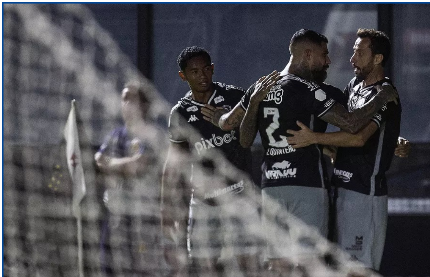
Média de pontos cair mais da metade nos últimos cinco jogos

Ao olhar a classificação final do primeiro turno, dá para dizer que o Vasco teve uma campanha de-