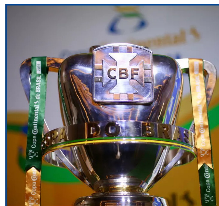
Disputa dos confrontos começa na próxima semana