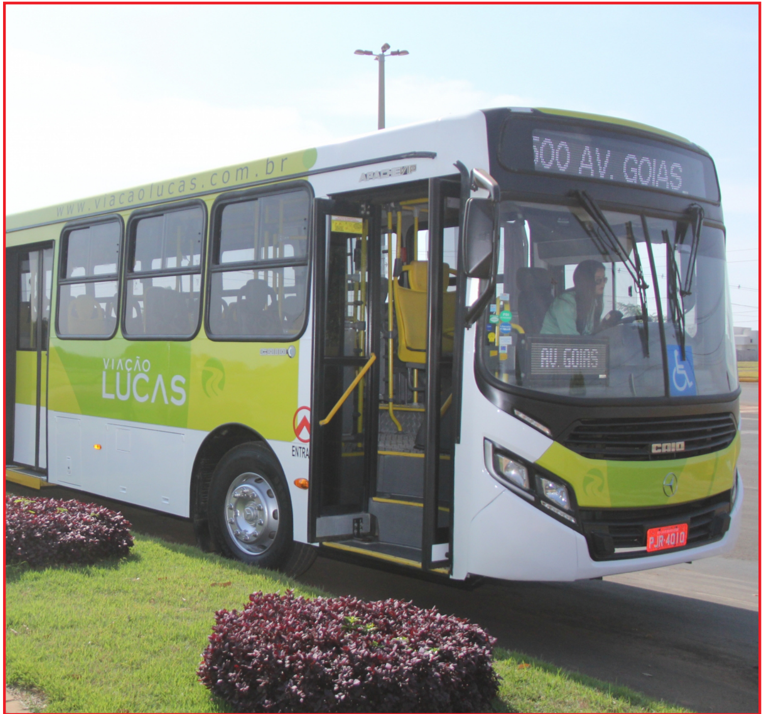
Sistema de Bilhetagem Eletrônica, que custava R$ 4,89, cai para R$ 4,50

participantes de programas e/ou projetos sociais, a gratuidade será válida somente no período das atividades a