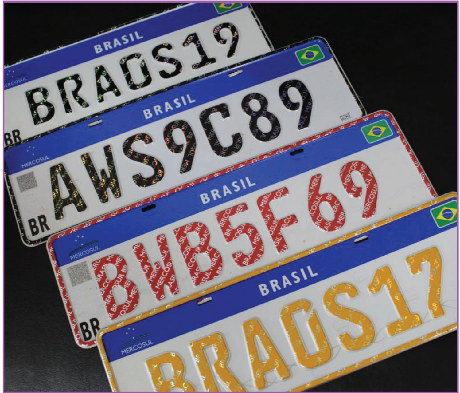
Placa veicular padrão Mercosul

A nova placa não tem mais os símbolos que permitiam a identificação de local de registro do veículo. Também sofreu mudança na cor dos caracteres para diferenciar os tipos de veículos. Os veículos de passeio com a cor preta, veículos comerciais (aluguel e aprendizagem) na cor vermelha, carros oficiais na cor azul, a verde para veículos em teste, para veículos diplomáticos cor dourado e para os veículos de colecionadores o fundo é pre-