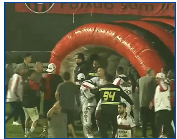
Torcida invadiu gramado no Bento Freitas