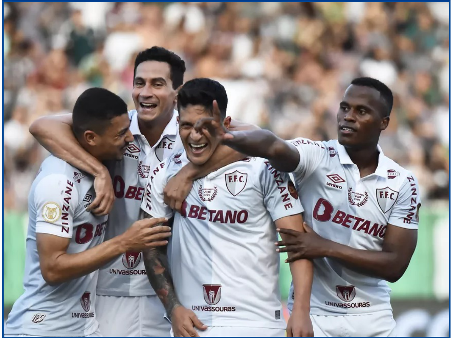
Fluzão venceu o Red Bull Bragantino

O próximo jogo do Fluminense pelo Brasileiro será apenas no dia 1º de agosto, uma segunda-feira, contra o Santos, na Vila Belmiro. Antes disso, nesta quinta (28), o Tricolor faz, contra o Fortaleza, no Ce-