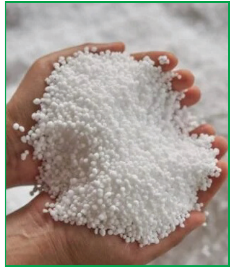
Estudos conduzidos pela iniciativa privada e instituições públicas

Os benefícios dos adubos com nitrato de amônio e cálcio também estão presentes na cultura do algodão. Os dados são da Escola Superior de Agricultura Luiz de Queiroz (Esalq/USP) que, em parceria com a Yara, conduziu um experimento com algodão para avaliar o efeito de fontes nitrogenadas. Os resultados, após o quarto ano de cultivo com algodão, apontam aumento na produtividade do algodão safrinha