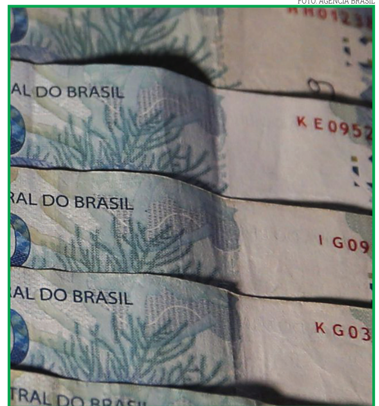
Valor mínimo para cada família é R$ 400