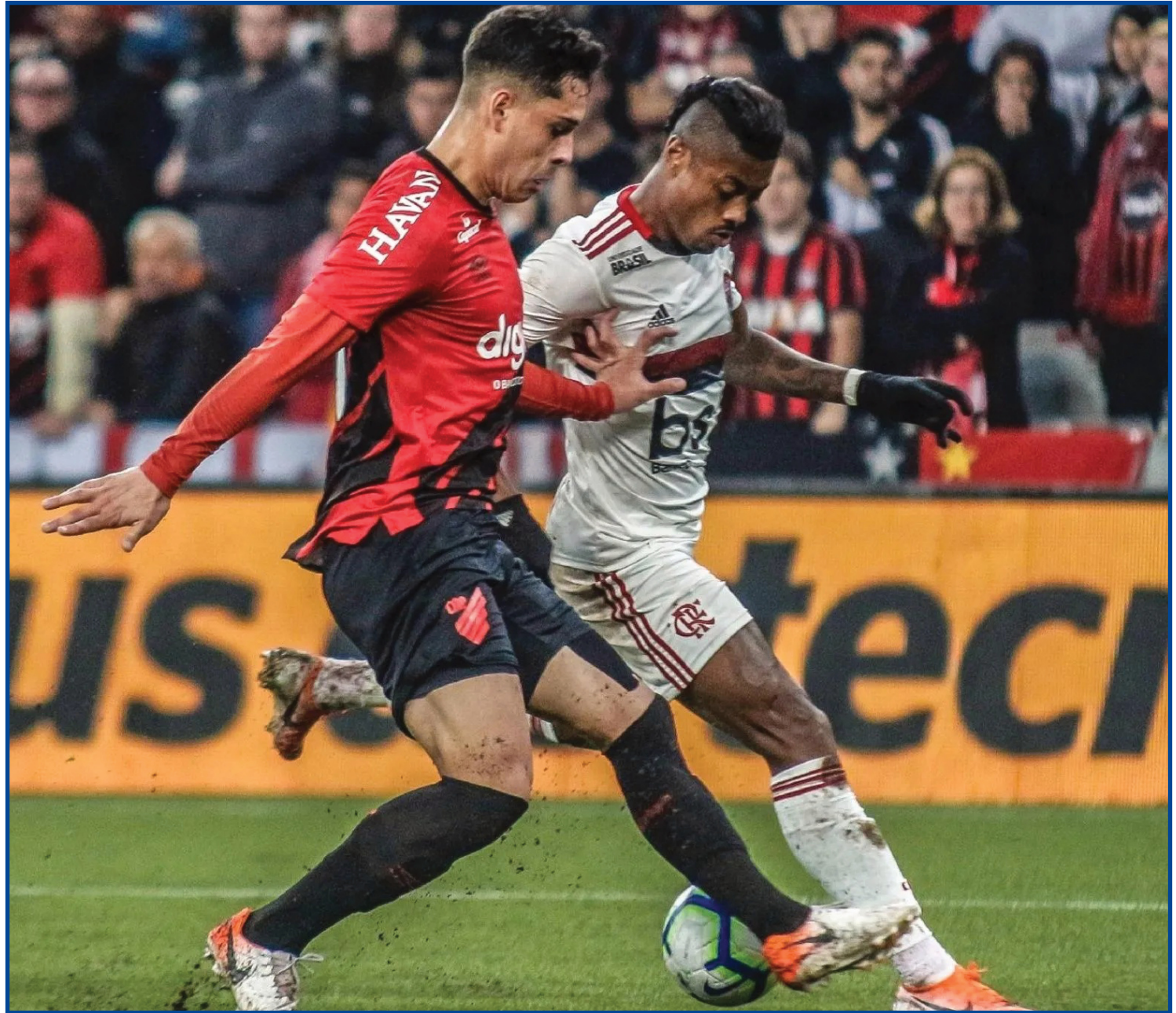
Flamengo e Athletico iniciam quartas de final nesta quarta

O confronto de volta está marcado para 17 de agosto, quarta-feira, às 20h30, na Arena da Baixada. A equipe que tiver o maior saldo de gols nos dois jogos avança às semifinais - em caso de igualdade, decisão nos pênaltis. Quem passar de Athletico x Flamengo enfrentará na semifinal o vencedor de São Paulo x América-MG. Tricolor paulista e Coelho iniciam a disputa na quinta-feira, no Morumbi.