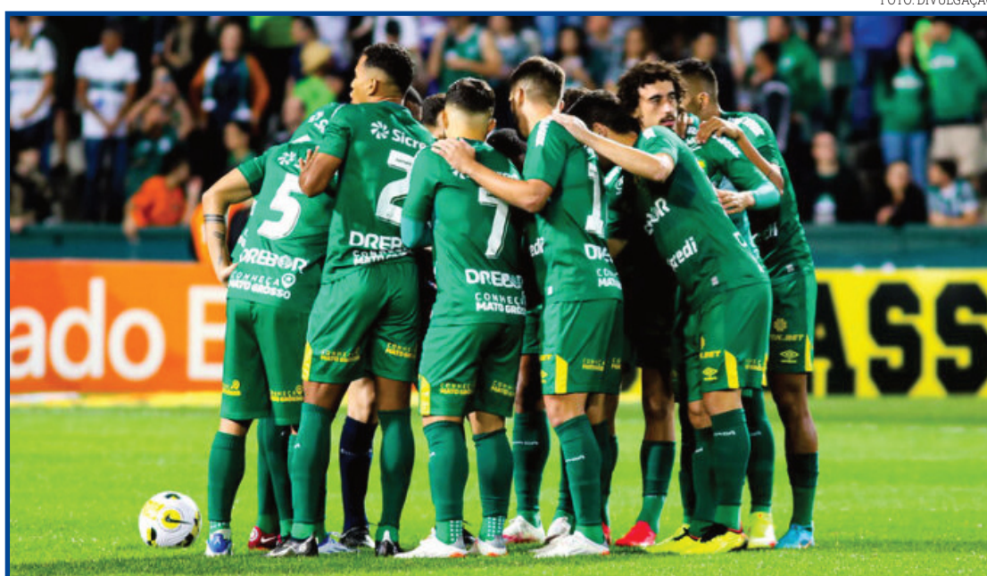
Dourado perde confronto direto, fica com 20 pontos e cai para 17º

O primeiro tempo foi truncado, de muita marcação por ambas as equipes. Enquanto o time da casa tentava levar perigo através de lançamentos na área, o Cuiabá buscava a transição rápida e joga-